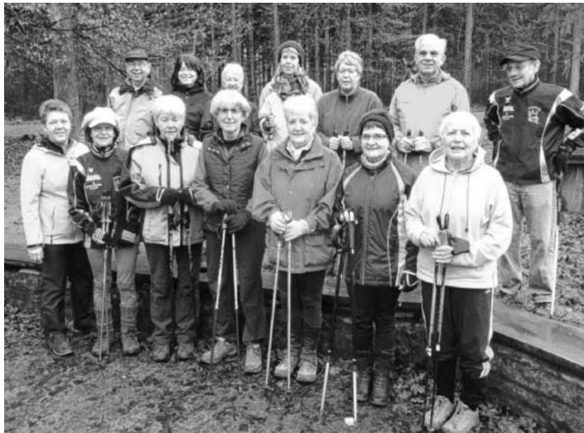
Die Nordic Walking-Gruppe des TVG am Sonntagvormittag in Aktion.

bis September um 9 Uhr und in den Monaten Oktober bis März um 9:30 Uhr. Treffpunkt ist die Schranke am Waldrand an der Berntalstraße. Weitere Informationen unter www.tv-grosssachsenheim.de oder bei der TVG-Geschäftsstelle unter Telefon 07147/900225.