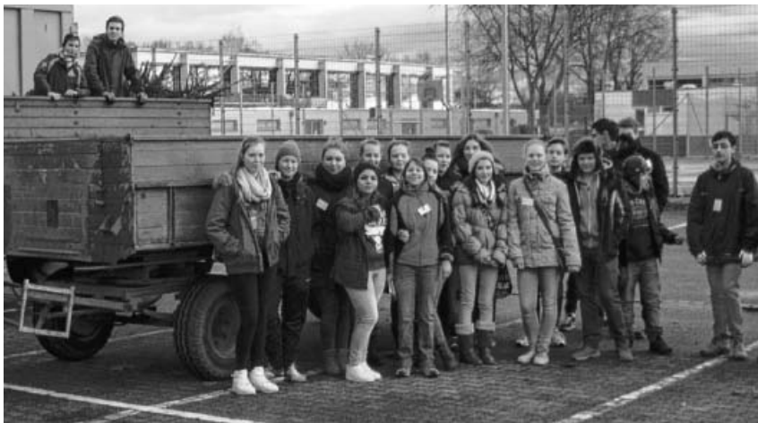
Team Großsachsenheim am Start.

Am Samstag, 10.01.2015, fand in Sachsenheim wieder die vom Förderverein initiierte und organisierte Sammelaktion für die ausgedienten Weihnachtsbäume statt, deren Erlös den beiden lokalen Kleeblatthäusern zugutekommt. Rund einhundert Personen aus allen Stadtteilen haben sich wieder an dieser ersten großen Aktion im neuen Jahr beteiligt, darunter etwa sechzig Schülerinnen und Schüler der Burgfeld-Realschule, zahlreiche Landwirte mit ihren Traktorgespannen, die Motorradfreunde Hohenhaslach e. V., Mitglieder der Feuerwehr sowie weitere Organisationen und Privatpersonen. Der Förderverein bedankt sich sehr herzlich bei allen ehrenamtlichen Helferinnen und Helfern für ihren Einsatz, bei der Bevölkerung für die Teilnahme an der Einsammlung und die Spenden sowie bei den Mitgliedern des Fördervereins für die Vorbereitung und Durchführung der Aktion und die abschließende Bewirtung der Akteure.