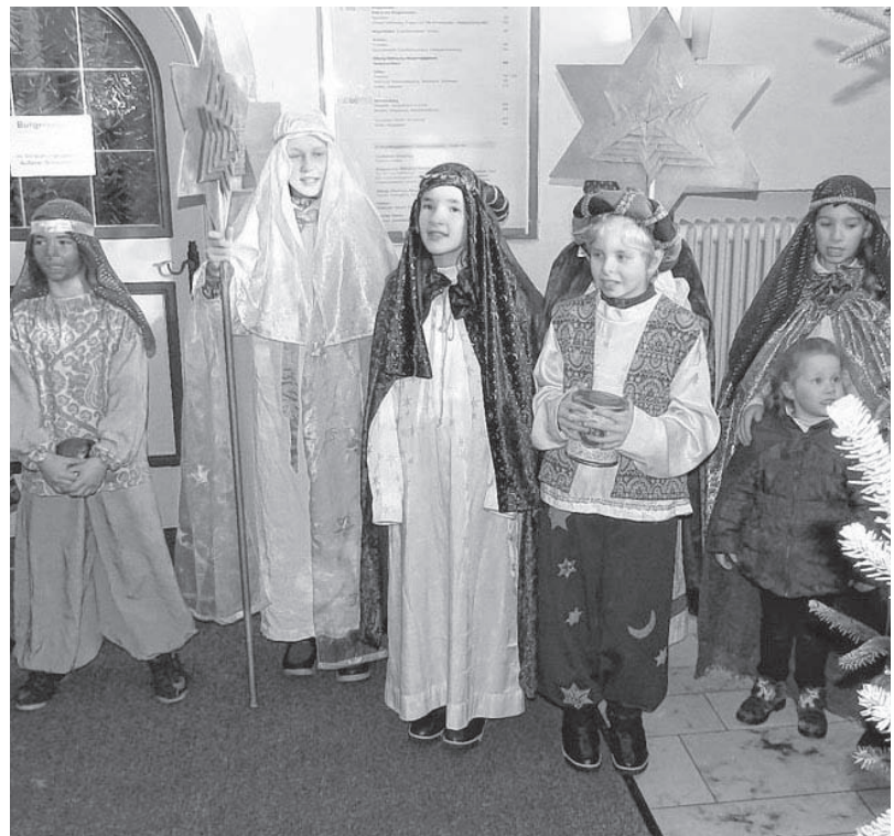
Den Segen „Christus segne dieses Haus“, Lieder und gute Wünsche überbrachten die Sternsinger.