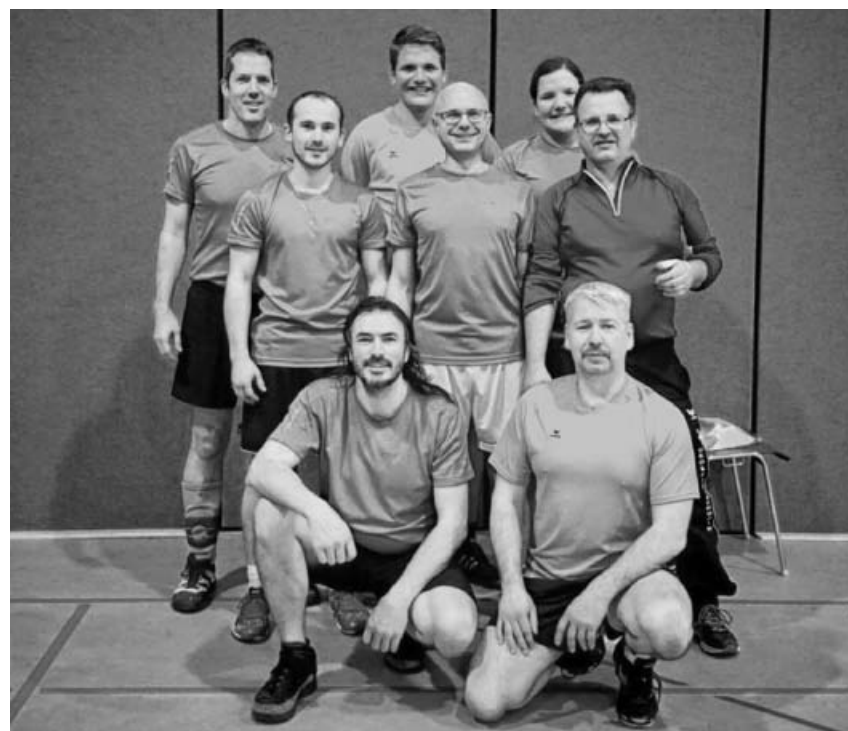
Die Mannschaft des Trägerverein Schloss-Freibad Sachsenheim e. V.