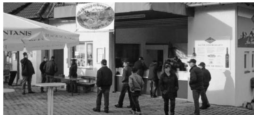
Glühweintreffen Silvester 2014.

Schwäb. Albverein e. V. Ortsgruppe Sachsenheim