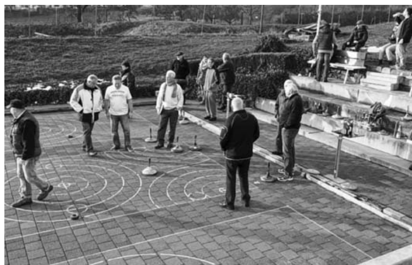
Stockschießen am Dreikönigstag.