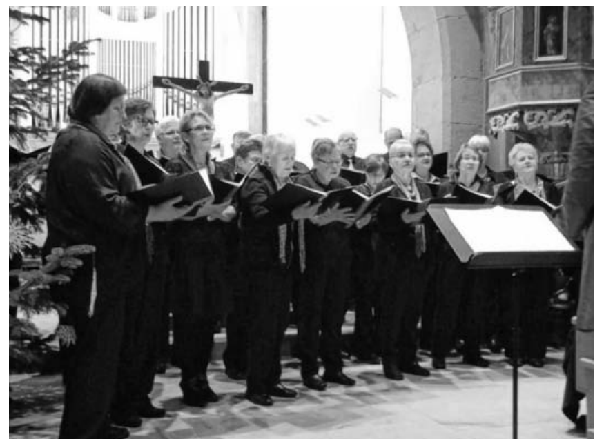
Der Chor beim Silverstergottesdienst.