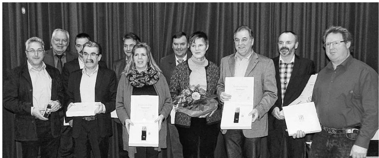
Elf Ortschaftsräte wurde für insgesamt 215 Jahre ehrenamtliche Tätigkeit geehrt.