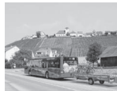
Der Stromer tourt wieder durchs Kirbachtal.

bachtal und zurück. Die Stromer-Saison beginnt dieses Jahr bereits am 28. März und endet am 8. November.