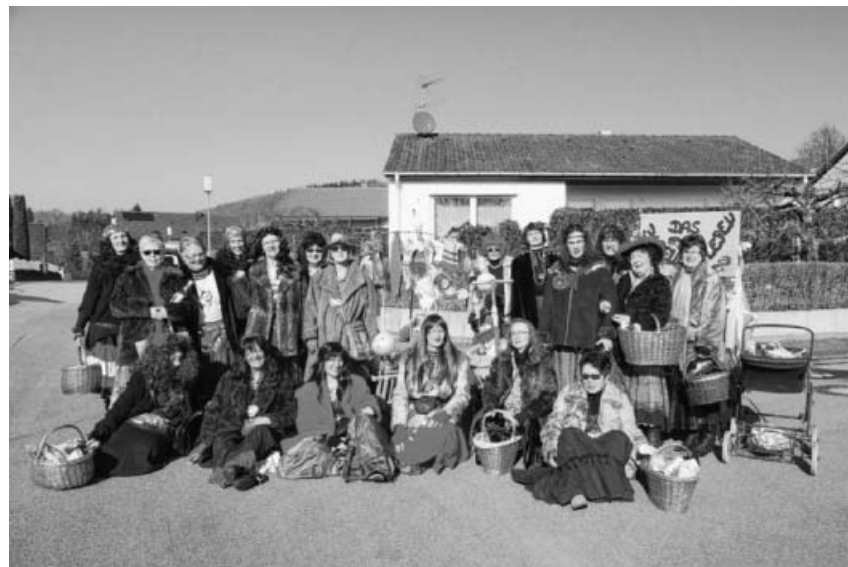
Gruppenbild, Bilder E. Lorch.