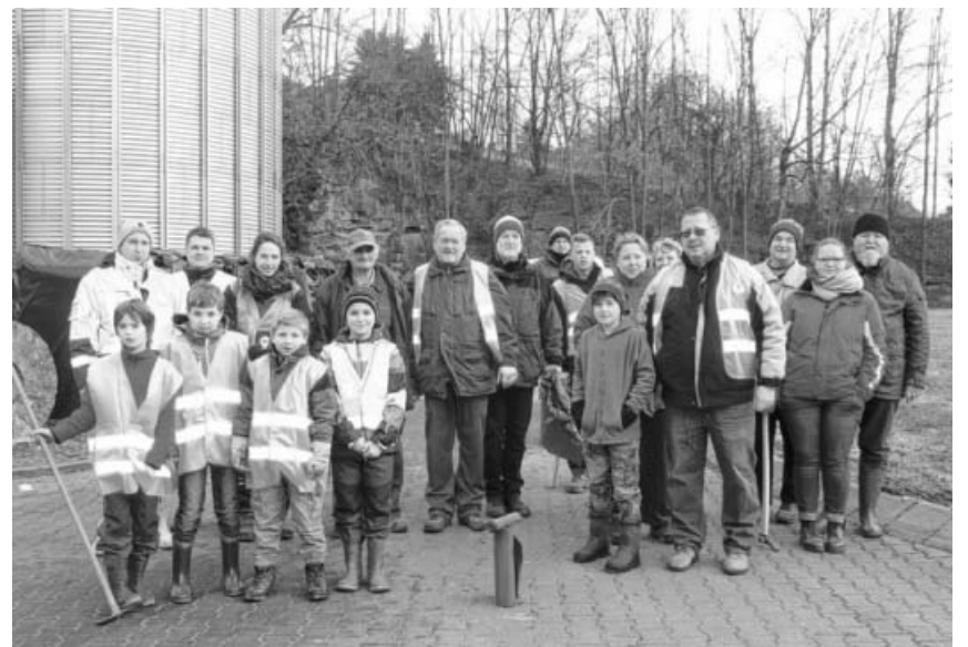
SAV OG Sachsenheim und Hegegemeinschaft bei der Bachputzete.

Fahrt mit ÖPNV. Kleinsachsenheimer fahren mit dem Bus 551 um 13.18