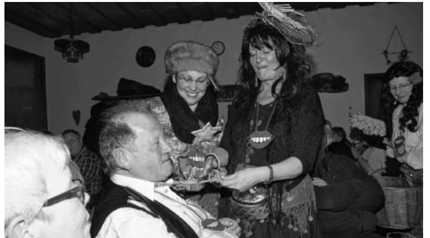
Achtung! Schnipp-schnapp und Krawatte ab.