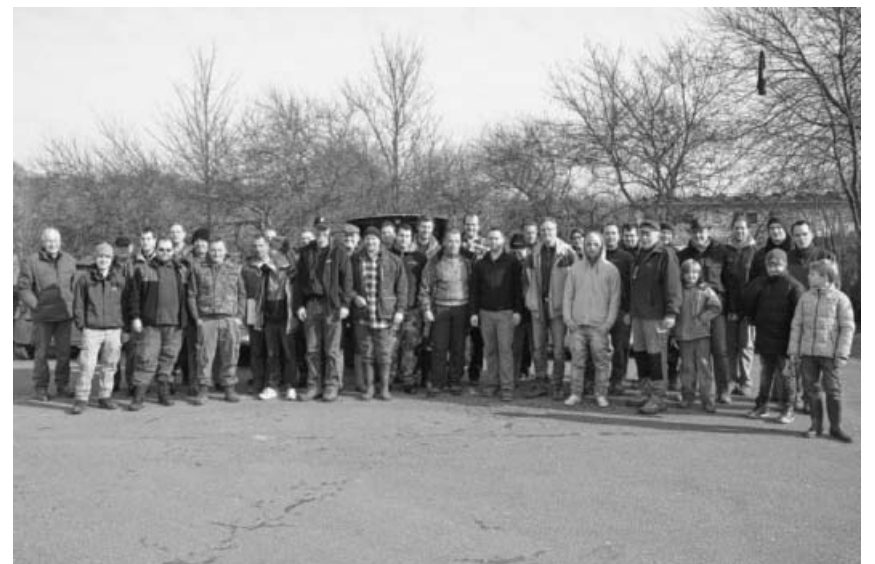
Die Helfer an Enz und Glems. Die Jugendgruppe war da schon am Leudelsbach unterwegs.

Aber nicht nur Müllsammeln gehört zu den Aufgaben, die sich die Angler zur Pflege und Erhalt der Gewässer und deren Ufer auferlegt haben. So werden beispielsweise jedes Jahr die Zuläufe der Seen gereinigt, um einen ausreichenden Frischwasserzulauf zu gewährleisten. Hinzu kommen die Erneuerung der Ufer-