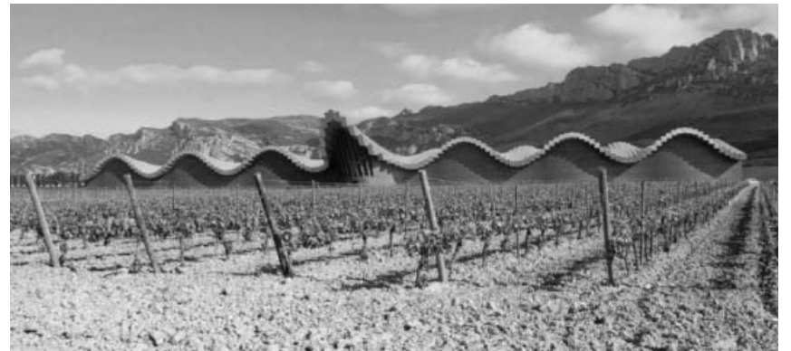
Bodega Ysos des Stararchitekten Calatrava.

Die Vereinsleitung Gerlinde Orth mit Team