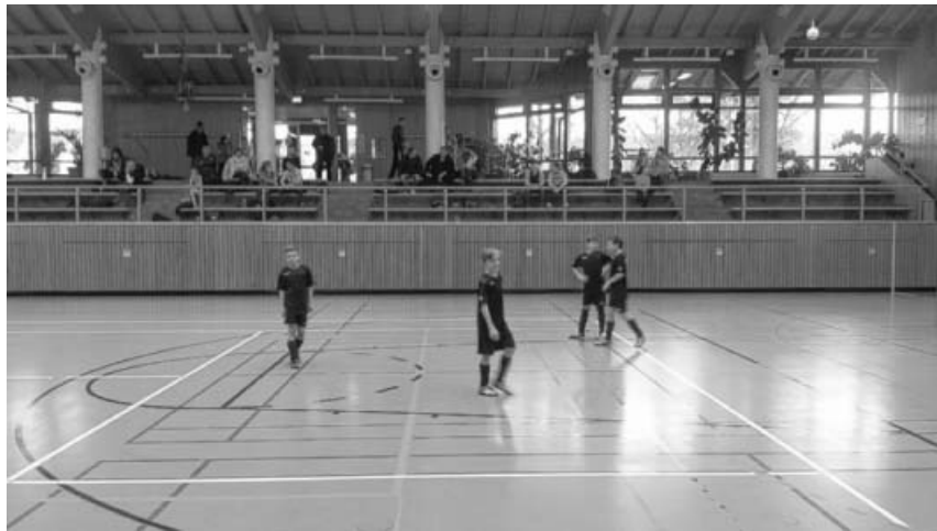
D-Junioren kurz vor Spielbeginn.