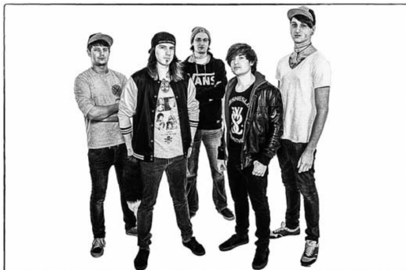
Your Mind is my Puppert.

Die Stadtbücherei beteiligt sich an der Initiative "Drei Meilensteine für das Lesen" des Bundesministeriums für Bildung und Forschung. Das Ziel: Eltern zum Vorlesen und Kinder zum Lesen zu bringen. Deshalb wurden im Kindergarten "Spatzennest" in Großsachsenheim sogenannte "Lesestarter-Sets" verteilt.