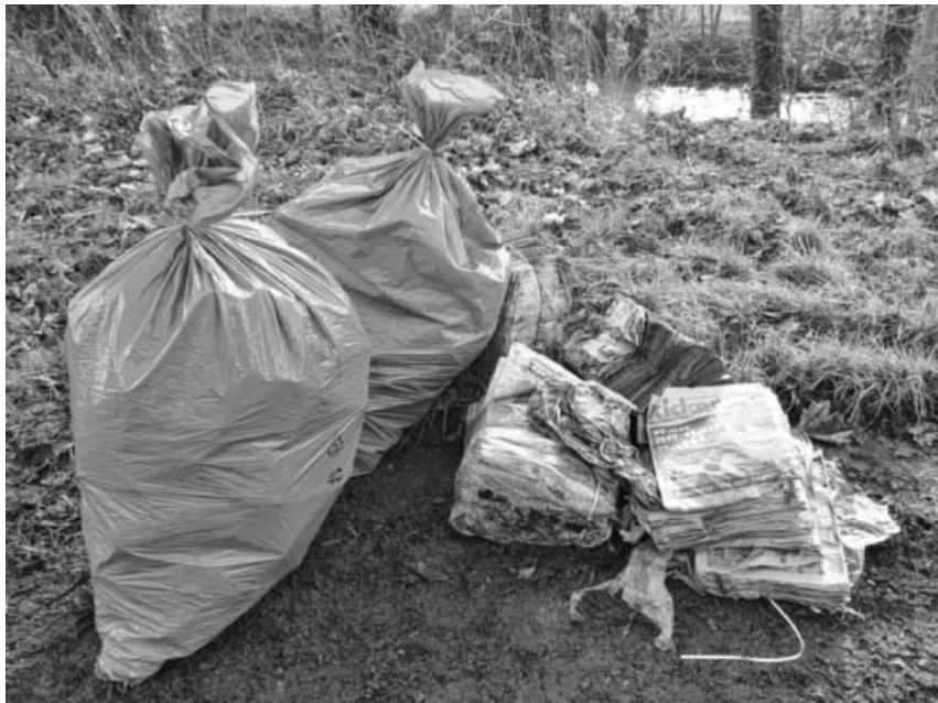
Das Ufer der Enz...als Müllkippe mißbraucht.

befestigung bzw. das Anpflanzen von Weiden zu diesem Zweck sowie Schnitt- und Mäharbeiten. Die Qualität der Gewässer wird durch regelmäßige Gewässerproben und deren Untersuchung kontrolliert. Außerdem werden Besatzmaßnahmen zum Erhalt gefährdeter Fischarten durchgeführt. Aber auch für Regelungen der Naturschutzbehörde, wie z.B. der Kormoranverordnung oder der Verordnung für den Kanubetrieb auf der Enz, setzte sich der Verein bereits in der Vergangenheit ein. Jedes Jahr wenden die Mitglieder so insgesamt mehrere hundert Stunden ehrenamtlich auf!