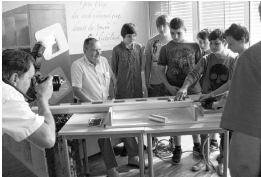
Praktisches Lernen steht im Vordergrund.

Für Mittwoch, 4. März, 17 Uhr , möchten wir alle interessierten Viertklässler/innen und deren El-