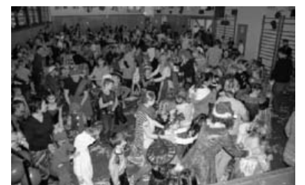
Gute Stimmung in der Mehrzweckhalle in Kleinsachsenheim.