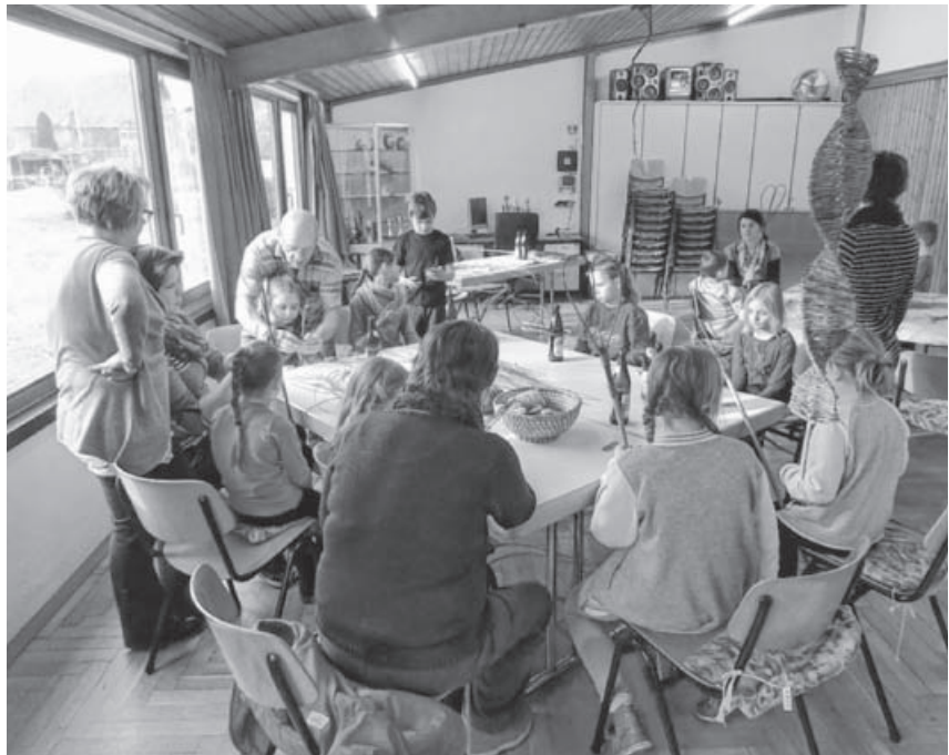
Alle fleißig am Arbeiten.

wertvolle Handwerkskunst kennen zu lernen.