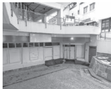
Der ehemalige Bonus-Markt – Raum für Ideen in der Innenstadt.