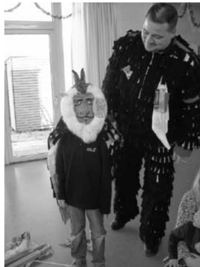
Hurra, hurra die Urzeln waren da!

Mit viel Spannung wurden die Urzeln am 13. Februar von den Kindern erwartet. Herein kamen zwei erwachsene Urzeln und ein kleiner Urzel. Sofort verflog bei allen Kindern die Angst und Begeisterung machte sich breit. Es durften alle Utensilien der Urzeln begutachtet und angefasst werden, die Geschichte der Urzeln wurde erzählt. Zum Schluss gab es für alle Kinder noch eine Runde „Peitschen-Karussell“, das war ein Spaß! Mit viel Begeisterung und tollen Eindrücken verabschiedeten wir die Urzeln mit einem Faschingslied.