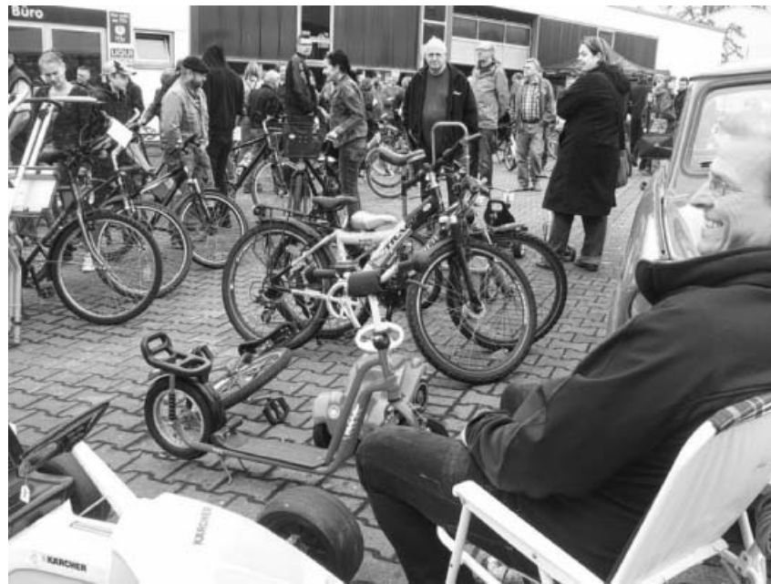
Auf gehts zum Sachsenheimer Drahteselmarkt am Samstag, 28. März 2015.