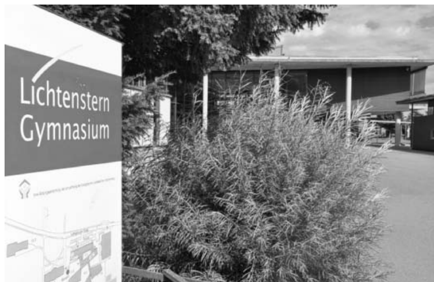
Offene Türen am 28. Februar im Evang. Lichtenstern-Gymnasium.

Das Projekt: Zeitgleich zu unserer Reit-AG soll immer dienstags von 13.00 - 14.30 Uhr an der Kraichertschule eine Garten-AG mit 2 Gruppen von je 4 Schülern stattfinden. Diese 2 Gruppen wechseln sich 14-tä-