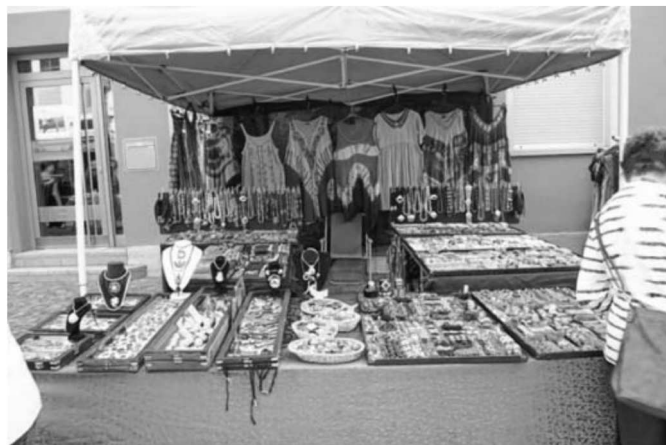
Einer von vielen einladenden Ständen aus dem vergangenen Jahr.

gehrt. Auch für das leibliche Wohl wird wieder bestens gesorgt, unter anderem auch durch örtliche Vereine und Anbieter.