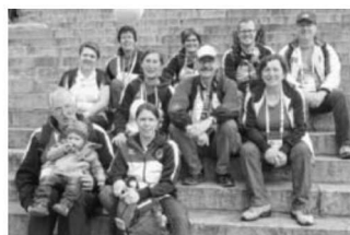
2 TVG-Mitglieder und weitere Teilnehmer des Turngaus waren in Helsinki.

Am Beginn der Gymnaestrada stand der Einmarsch der Nationen ins Olympiastadion. Der Wettergott hatte ein Einsehen, der Regen hatte aufgehört und es herrschte perfektes Turnfest-Wetter mit etwa 20 Grad.