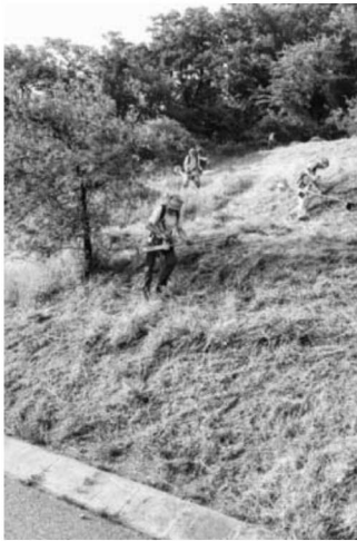
Das Mähen ist keine leichte Aufgabe am Steilhang.

dem Aufruf zur Landschaftspflege am Pfefferberg in Hohenhaslach. Die Landschaftspflege hat die Aufgabe einen möglichst naturnahen Zustand eines Geländes und die Landwirtschaftliche Vielfalt zu erhalten oder neu zu gestalten. Diese Aufgabe wird öfters an die ansässigen Vereine der zuständigen Gemeinde übergeben. So rückten die Mitglieder der Hohenhaslacher Flieger mit Balkenmäher, Motorsensen und Rechen in der Hand, dem hohen Gas und dem wildem Gestrüpp zu Leibe. Es ist gar nicht so einfach in einer Steillage mit Balkenmäher und Motorsensen zu hantieren und diese Anstrengung sah man unsere Männer auch an. Die anderen Helfer hatten es da schon etwas einfacher, denn sie mussten das gemähte Gras nur nach unten mittels Rechen oder einer großen Folie befördern. Bei so vielen helfenden Händen war die Arbeit ruck zuck gemeistert. Und Mann, Frau und Kinder konnten sich danach mit einem leckeren Vesper und Getränken, die vom Verein bereitgestellt wurden, stärken.