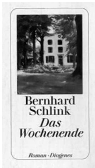
Literatur im Gespräch.

Literatur im Gespräch und zwar am Mittwoch, den 23.9. ab 9.30 Uhr. Wir reden in zwangloser Runde über das Buch "Wochenende" von Bernhard Schlink. Anmeldung ist gewünscht, weil die Plätze begrenzt sind.