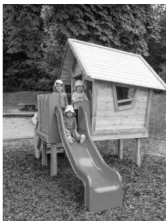
Die Kinder haben das Gerät schnell in Beschlag genommen.