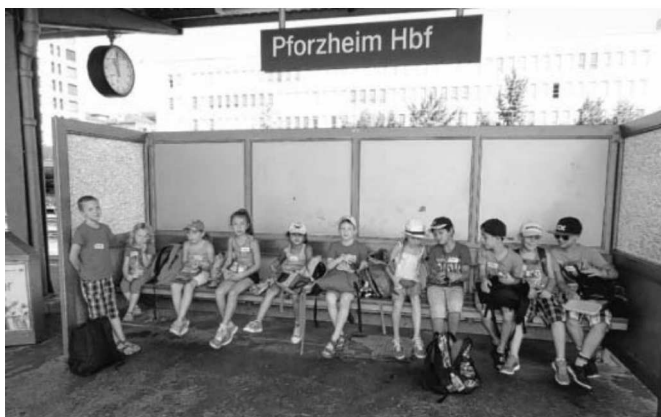
Alle Kinder auf der Wartebank.

Termine 27.08. Dienstabend: Fahrtraining mit dem Einsatzfahrzeug 03.09. Dienstabend: EGB akut 10.09. Dienstabend: Verhalten im Einsatz - Theorie 17.09. Dienstabend: Verhalten im Einsatz - Praxis