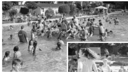
Viel Spaß im Wasser.

Wir bedanken uns ganz herzlich bei allen Beteiligten und Helfern ohne die so eine Veranstaltung nicht stattfinden könnte und wünschen einen schönen Sommer sowie schöne Ferien- und Urlaubstage. Auf ein Wiedersehen in unserem schönen Freibad.