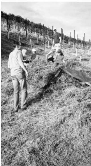
Auch die kleinen hatten ihren Spaß.

dem Aufruf zur Landschaftspflege am Pfefferberg in Hohenhaslach. Die Landschaftspflege hat die Aufgabe einen möglichst naturnahen Zustand eines Geländes und die Landwirtschaftliche Vielfalt zu erhalten oder neu zu gestalten. Diese Aufgabe wird öfters an die ansässigen Vereine der zuständigen Gemeinde übergeben. So rückten die Mitglieder der Hohenhaslacher Flieger mit Balkenmäher, Motorsensen und Rechen in der Hand, dem hohen Gas und dem wildem Gestrüpp zu Leibe. Es ist gar nicht so einfach in einer Steillage mit Balkenmäher und Motorsensen zu hantieren und diese Anstrengung sah man unsere Männer auch an. Die anderen Helfer hatten es da schon etwas einfacher, denn sie mussten das gemähte Gras nur nach unten mittels Rechen oder einer großen Folie befördern. Bei so vielen helfenden Händen war die Arbeit ruck zuck gemeistert. Und Mann, Frau und Kinder konnten sich danach mit einem leckeren Vesper und Getränken, die vom Verein bereitgestellt wurden, stärken.