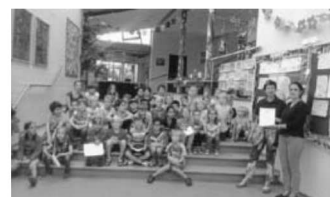
Die Schülerinnen und Schüler der Klassen 2 bei der Übergabe des Zertifikats.