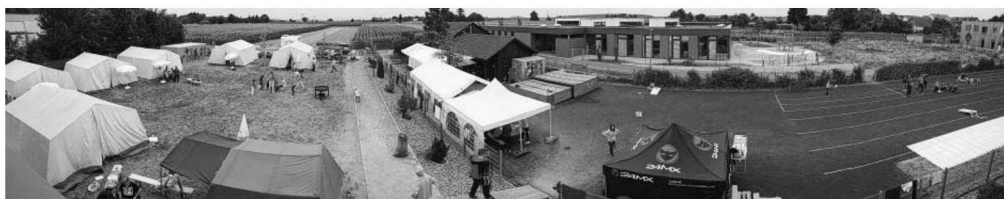
Das TVG-Zeltlager von oben.