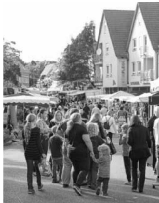
Buntes Markttreiben von 8.00 bis 18.00 Uhr.

Auch in diesem Jahr präsentieren wieder rund 95 Händler im Bereich der Haupt- und der Brunnenstraße sowie im Äußeren Schloßhof ein vielfältiges und bunt gemischtes Warenangebot. In entspannter Umgebung können Sie nach Herzenslust über den Markt bummeln, einkaufen und genießen. Von modischen Accessoires, Kunsthandwerk, Haushalts- und Kurzwaren, Tee, Gewürzen, Spielwaren, Imkereiprodukten, Seifen und Wurstwaren bis hin zu leckeren Süßigkeiten bieten die Marktbesucher alles was das Herz be-