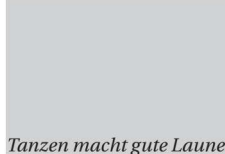
Tanzen macht gute Laune.