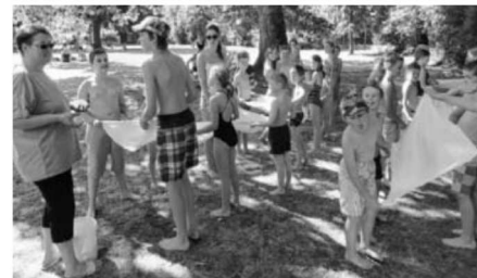
Viel Geschick beim Wasserbombentransport.

Auch die Folienuutsch kam wieder gut bei den Kindern an und das Abspritzen mit dem Wasserschlauch brachte Erfrischung. Ausgelassen wurde dann im großen Schwimmbecken geplantscht, geschwommen und vom Sprungbrett gehüpft. Zwischendurch gab es eine kleine Stärkung mit Butterbrezeln, Äpfeln, Waffeln und viel Getränken. Wir danken allen Teilnehmern für Ihr Kommen und wünschen noch schöne Ferien und weitere tolle Badetage. Auf ein Wiedersehen in unserem schönen Schloss-Freibad.