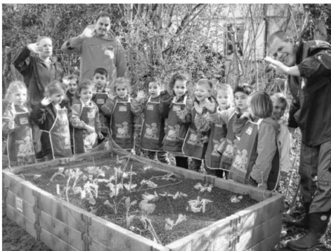
Im Frühling beim Beet einpflanzen.

Bereits seit einigen Jahren läuft das Projekt „Gemüsebeete für Kids“ von der EDEKA-Stiftung. In diesem Jahr übernahm der örtliche EDEKA-Markt Hoffmann und Sieber die Patenschaft für den Evang. Kindergarten Arche Noah in Großsachsenheim. Nachdem die Mitarbeiter das Beet im Kindergarten aufgebaut und mit Erde befüllt hatten, bekamen die Kinder bunten Schürzen und Namensschilder. Gemeinsam wurde nun überlegt, was für Gemüse man in dem Beet einpflanzen oder säen könnte. Bevor mit der Pflanz-Aktion begonnen wurde haben die Kinder Schnüre für die Beeteinteilung gedreht. Nachdem die Felder abge-