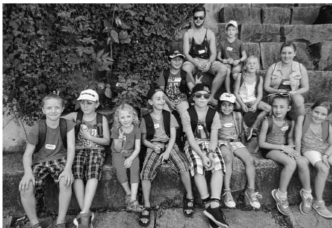
Rast bei den Eisbären.

Dann ging es ans Teigneten, was zu Beginn recht schwierig und kraftraubend war, aber das Ergebnis, nämlich 20 runde Teiglinge in den Backkörben ließ sich sehen. Da die Laibe jetzt gehen mussten, konnte man sich der Herstellung der Pizzen widmen. Aus dem vorbereiteten Teig mussten die Kinder runde Formen auswellen, die dann in die großen Bleche gelegt und nach Belieben mit Tomatensauce, Gemüse, Schinken und Käse belegt wurden. Die kleinen Bäcker zeigten sich bei der Pizza-Gestaltung sehr vielfältig und so entstanden bunte und leckere Backwerke, die sofort ins Backhaus gebracht und dort im inzwischen