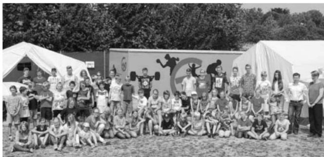
Die Teilnehmer des TVG-Zeltlagers vor dem verschönerten Container.

Weitere Informationen und Bilder gibt es unter www.tv-grosssachsenheim.de .