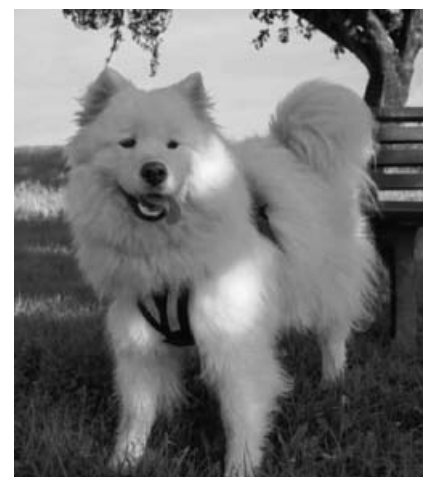
Schlittenhund Tisha ist am 8. November mit dabei!

(Oberriexinger Str. 29, 74343 Sachsenheim) Kostenbeitrag: 3 Euro (plus 1 Euro Materialkosten) Anmeldung im Stadtmuseum Sachsenheim bis zum 5. November erforderlich unter 07147 - 922 394 oder stadtmuseum@sachsenheim.de