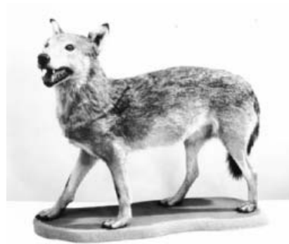
Der Wolf von 1847 - heute im Original im Naturkundemuseum Stuttgart.

Eine separate Märchenerlebniswelt soll in der Ausstellung darüber hinaus vor allem die ganz jungen Besucher ansprechen. Hier geht es beispielsweise darum, mit Rotkäpp