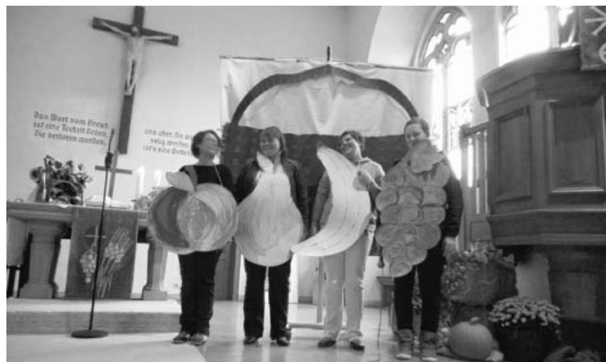
Das Obst unterhält sich.