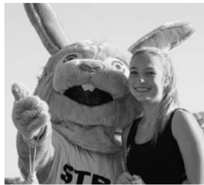
STB Maskottchen "Turni" mit TSV-Turnerin.

gab es einen tollen Luftballonstart mit vielen bunten Luftballons. Für die am weitesten fliegenden Ballons gibt es vom TSV Kleinsachsenheim tolle Preise zu gewinnen.