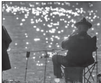
Angler am Hohenhaslacher See.

Tel.: 07041/8188007 · Mobil: 0151 111 95 458 · Email: info@schollenberger.immo