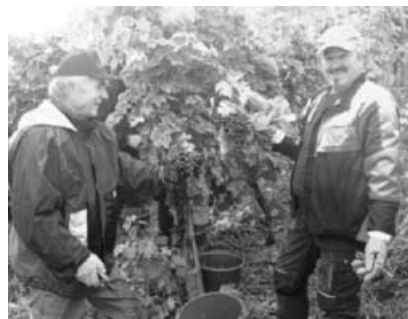
Trotz Nebels und kaltem Wetter waren die Lesehelfer im städtischen Weinberg bester Laune.