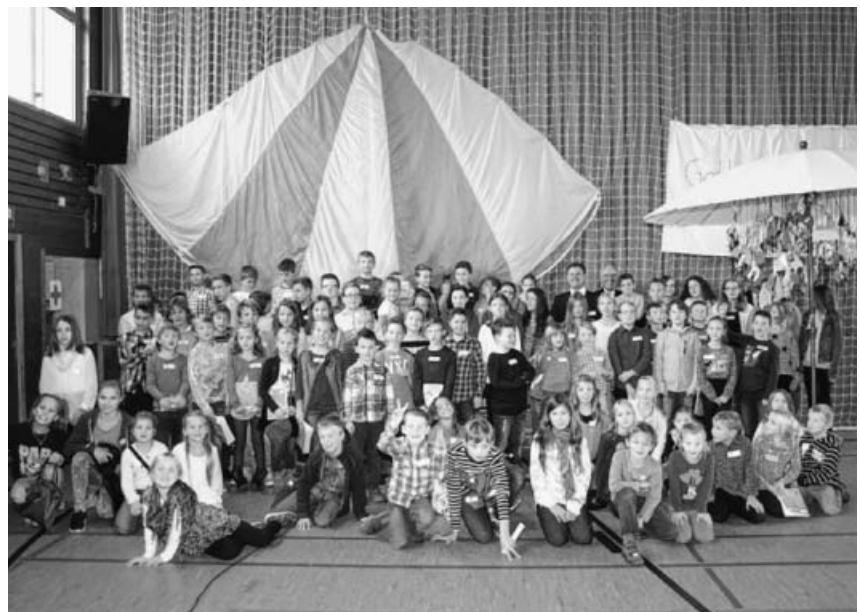
Abschließendes Gruppenfoto beim Kindertag in der Kirbachtalhalle.