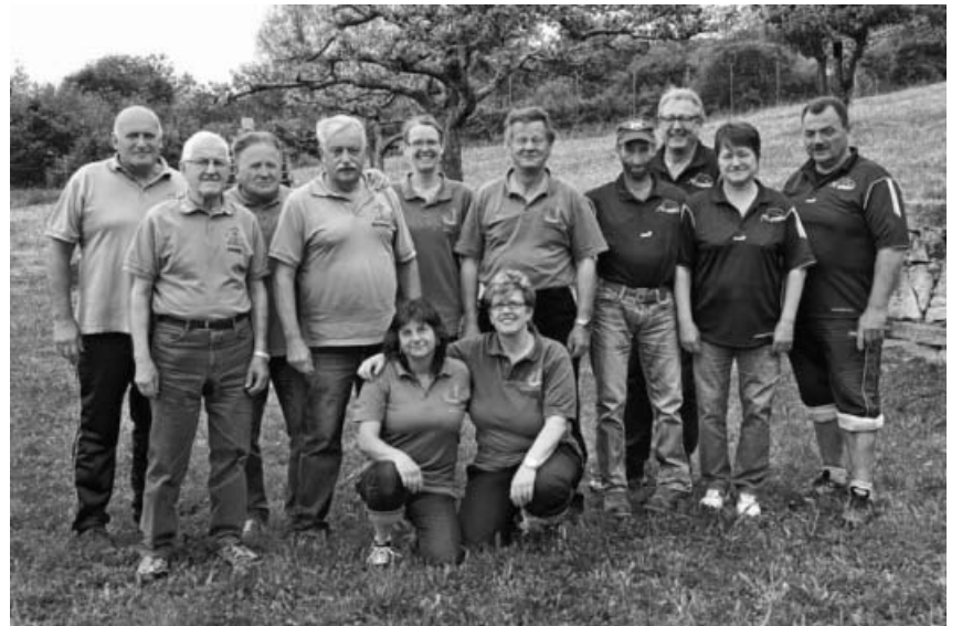
Die drei ersten Mannschaften.

niersieg knapp vor den Teams des 1. SSC Sachsenheim und des TV Ebhausen.