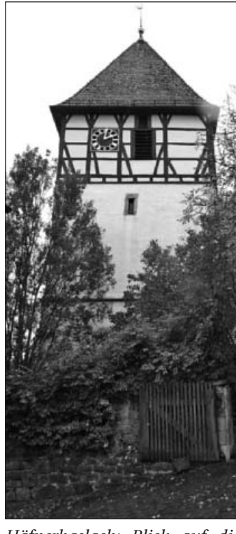
Häfnerhaslach: Blick auf die Kirche.