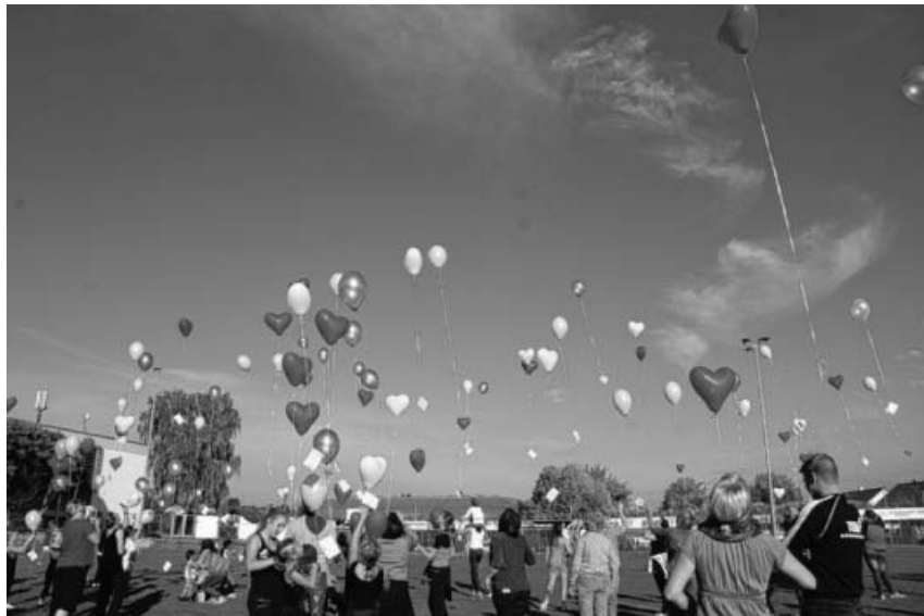
Luftballonstart beim TSV Sporttag.

„Überwinde den inneren Schweinehund“ weiterhin so erfolgreich umgesetzt wird. Für die tolle aktive Unterstützung während der Veranstaltung und Vorbereitungen bedankt sich das Organisationsteam der Turnabteilung bei allen Helfern, Übungsleitern, Akteuren, Anwesenden und Spendern.