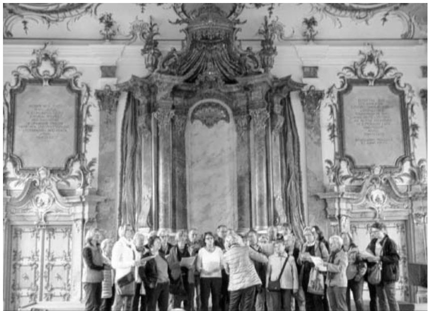
Ständchen im goldenen Saal.

Nachdem die Hotelzimmer bezogen waren stand gleich der Besuch der Augsburger Puppenkiste an. Die