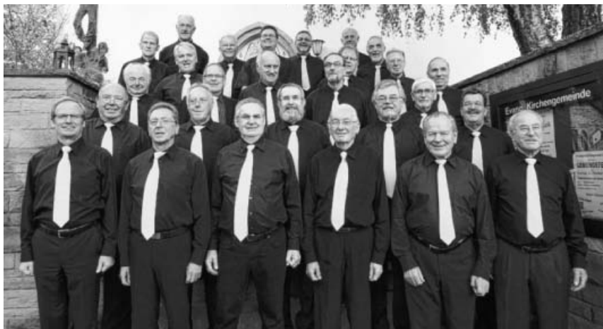
Der Männerchor LS lädt zum Sängerherbst ein.