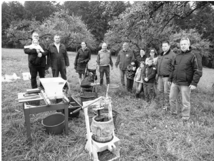
SAV Sachsenheim Apfelsaftaktion.