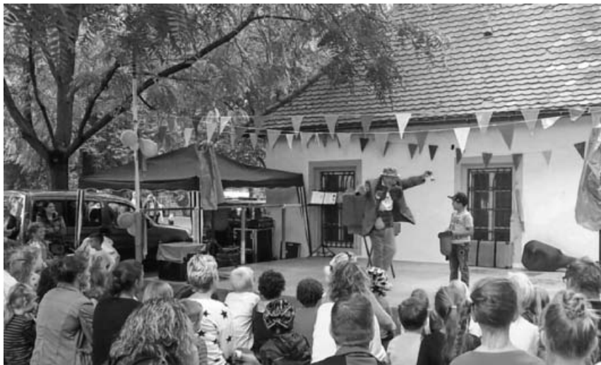
Clownshow beim Klopferlestag.

„Lebenskunst – fit für die Zukunft“ ist schon seit vielen Jahren das Motto der kreisweiten Jugendwoche, bei der circa 200 Veranstaltungen von Jugendhäusern, Jugendtreffs und der Schulsozialarbeit im Landkreis Ludwigsburg durchgeführt werden. Das Leben selbstständig und zukunftsorientiert zu gestalten, setzt vielseitige Fähigkeiten voraus, die gelernt werden müssen. Die Jugendwoche