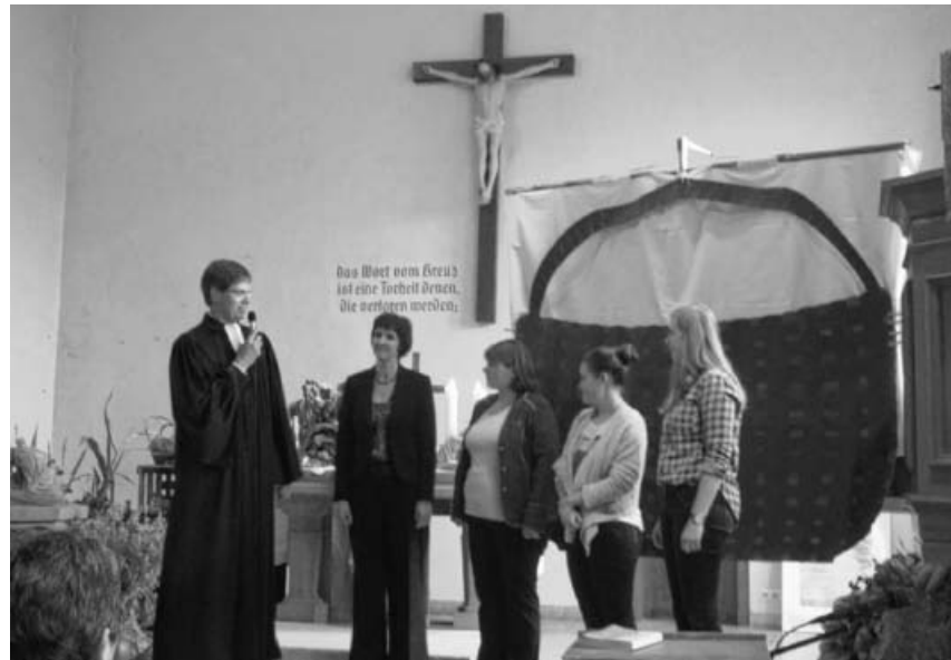
Die neuen Kolleginnen.

Die Kinder und Erzieherinnen zogen mit einem Leiterwagen, auf dem sich die Erntegaben befanden, in den Gottesdienst ein. Dann dankten sie Gott in einem Lied und wurden dabei begleitet von einer Querflöte und