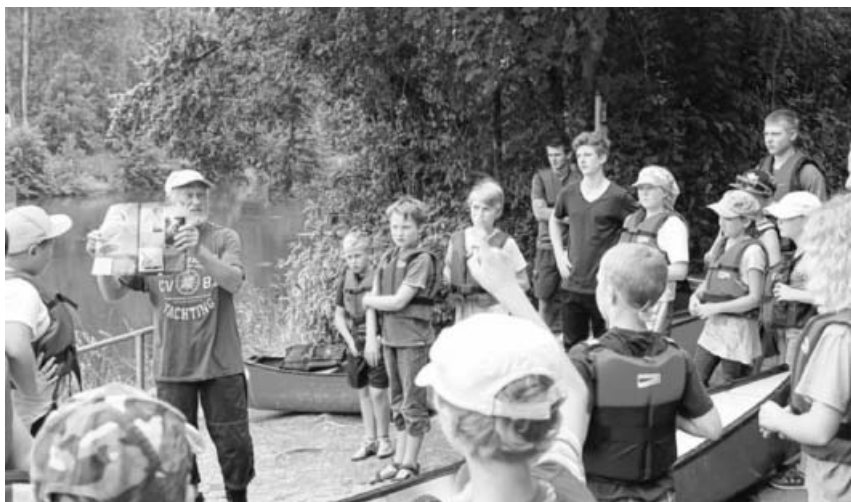
Kanu Ausfahrt im Ferienprogramm.