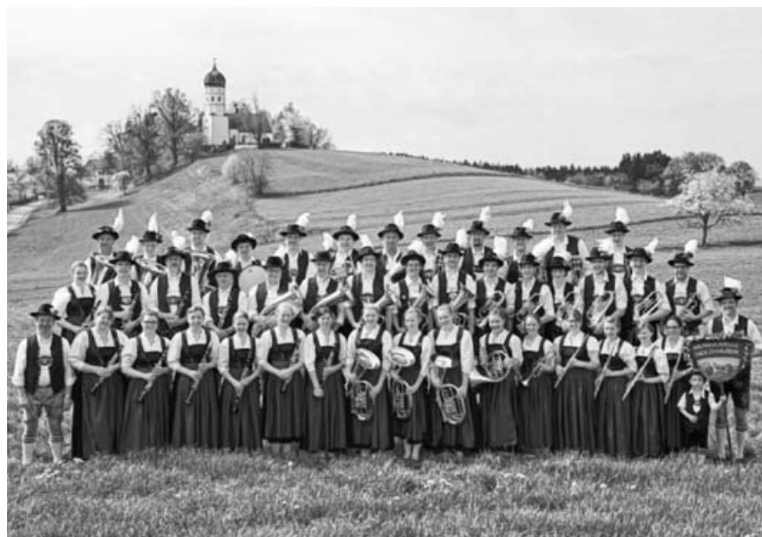
Die Musikkapelle Holzhausen ist zu Gast beim Herbst- und Weinfest des MVO.

Der Musikverein Ochsenbach freut sich auf Ihren Besuch am Festwochenende!