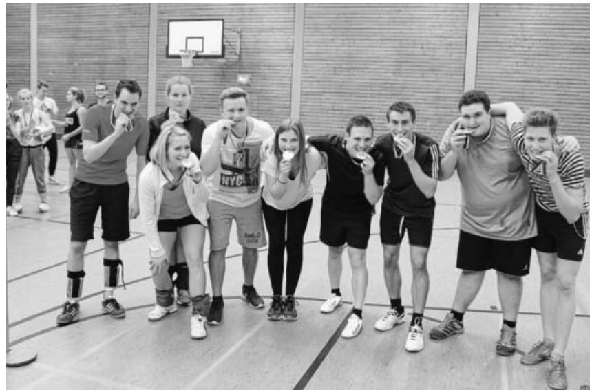
Die Siegermannschaft des Volleyballturniers mit ihren Goldmedaillen.

9.30 Uhr Gottesdienst in Großsachsenheim und Hohenhaslach, Sonntags- und Vorsonntagsschule