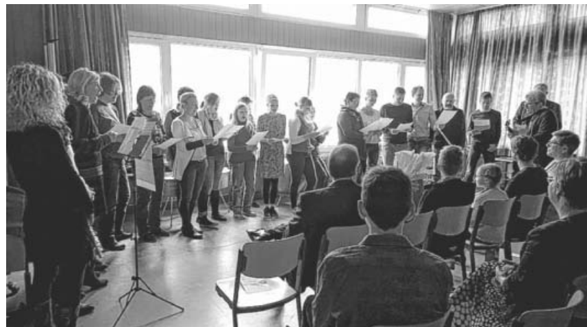
Das Kollegium sang das BL-Lied.