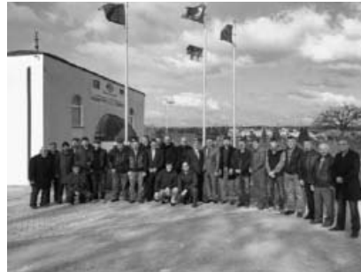
Neugewählter und Vereinsmitglieder.

tenbrechen und die gemeinsamen Gebete danach mit den Flüchtlingen setzten ein Zeichen der Solidarität in einer schwierigen Zeit für alle Beteiligten. Die Teilnahme an dem Ferienprogramm der Stadt Sachsenheim, Kirmes, Weihnachtsmarkt, Krämermarkt, Tag der offenen Moschee, Seniorenfrühstück, Frauenausflug weckte reges Interesse bei den Mitgliedern und bei der Bevölkerung.