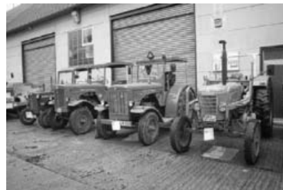
Schlepperparade in Unterixingen.

Unser nächster Stammtisch findet am Freitag den 13. Mai 2016 ab 20.00 Uhr