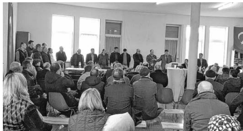
Mitglieder bei der Generalversammlung.

Der neue Vorstand hofft auf eine weitere gute Zusammenarbeit und bedankt sich bei den Mitgliedern für das entgegengebrachte Vertrauen.