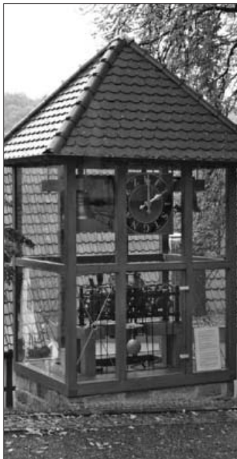
Häfnerhaslach: Blick auf die Turmuhr.