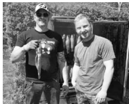
Geräucherte Forellen, die Spezialität des Vereins.

Dort wurden die Gäste bereits morgens mit einem Weißwurstfrühstück verwöhnt. Der absolute Renner waren wieder die frisch geräucherten Forellen. Aber auch die Kuchen und Torten, hausgemacht von den „Anglerfrauen“, fanden regen Absatz.