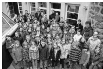
Kinderchorfreizeit auf Burg Rabeneck.

Die Kinderchöre der Kirchenbezirke Bietigheim-Bissingen und Stuttgart/Ludwigsburg bereiteten sich bei einer Freizeit auf Burg Rabeneck bei Pforzheim-Dillweissenstein auf ein Konzert vor, das im Oktober in der Kirche Ludwigsburg stattfinden wird und den Vereinen »Humor hilft heilen« und »Aufwind e.V.« zugute kommen soll. Das Ganze steht unter dem Motto »Wir haben Freude zu verschenken«. Die Kinderchöre möchten anderen Kindern, denen es momentan nicht gut geht, mit ihrem Konzert und dessen Erlös Freude schenken.