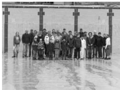
Die vielen fleißigen Helfer.

Liebe Grüße Trägerverein Schloss-Freibad Sachsenheim e.V.