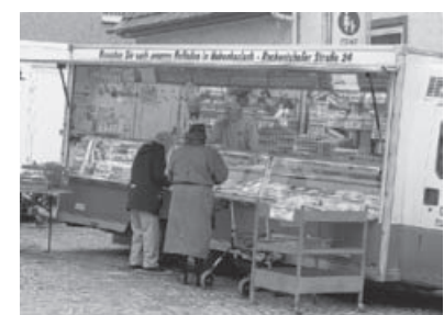
Unser Verkaufswagen auf dem Sachsenheimer Wochenmarkt.

Mehr Informationen zu unserem Hof finden Sie im Internet unter www.kurz-hof.de .