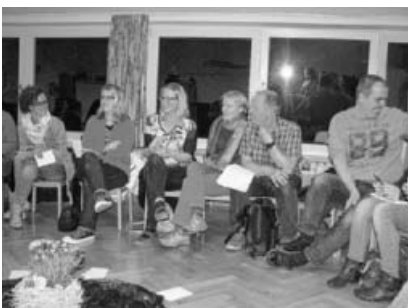
Interessierte Eltern beim Elternabend.

Für Kinder ab dem 6. Geburtstag, Kosten: 65 € pauschal, Dauer: 2 Stunden Buchung und Infos unter: Stadtmuseum Sachsenheim, 07147-922 394 oder stadtmuseum@sachsenheim.de