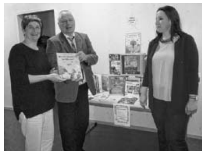
Im Familienzentrum Mobile.

Während der Pfingstferien (13. Mai - 28. Mai) wird wieder die DVD-Rabatt-Aktion durchgeführt. Sie können dann alle Filme 50 % billiger für eine Woche entleihen. Die Entleihaktion beträgt dann nur 1 € die Woche.