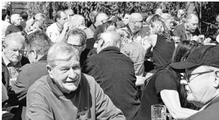
Anglerhocketse auf dem Vereinsgelände des AV Sachsenheim-Unterriexingen e.V.