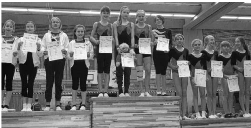
Siegerehrung mit TVG-Turnerinnen auf dem ersten Platz.

Der TVG und die Abteilung Kinder und Jugend freuen sich über die hervorragenden Resultate und danken ganz besonders allen Eltern, die dabei waren und Fahrdienste übernommen haben.