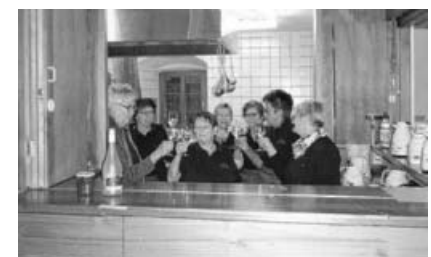
Die Frühstücksausgabe ist geschafft. Ein Grund zum Anstoßen für einen Teil des Helferteams der Hohenhaslacher Landfrauen.