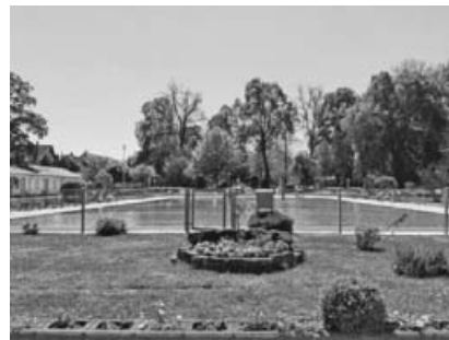
Auf eine schöne Freibadsaison.

Liebe Grüße Trägerverein Schloss-Freibad Sachsenheim e.V.