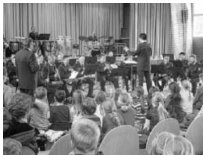
Das Landespolizei Orchester Baden-Württemberg begeisterte das Publikum.