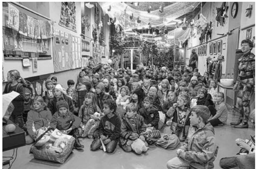
Ein Danke für die Vorleser.