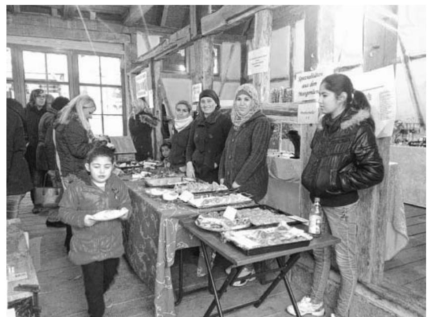
Regel Betrieb beim Stand.