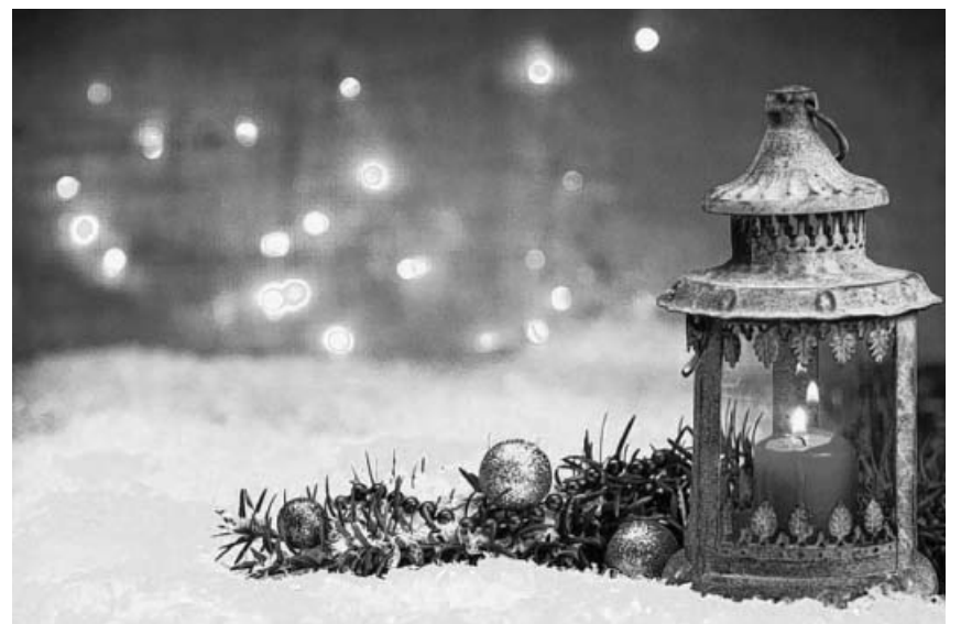
Kammerchor und Kammerorchester Stuttgart der Neuapostolischen Kirche sowie der Männerchor des Kirchenbezirks Bietigheim-Bissingen laden zu ihren Konzerten in die Kirche Bietigheim und Illingen herzlich ein!

Bei dem alle zwei Jahre stattfindenden Wettbewerb sind wieder private Erfinderinnen und Erfinder sowie Schülerinnen und Schüler in verschiedenen Alterskategorien auf-