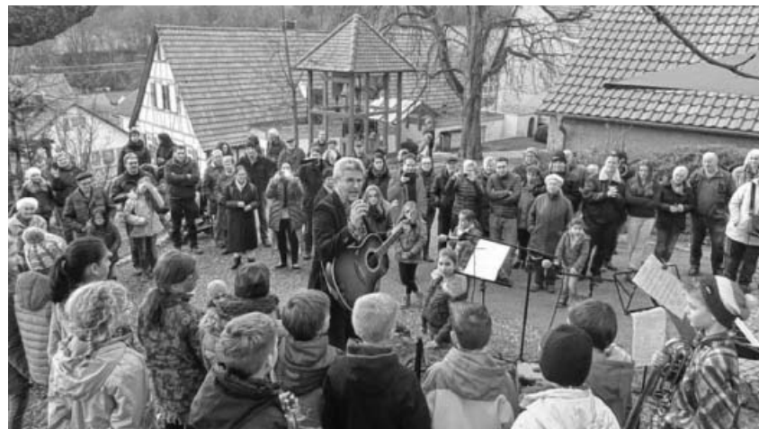
Programm Häfnerhaslacher Adventssamstag.

Freitag, 9. Dezember, 16.30 Uhr, Zaberfeld