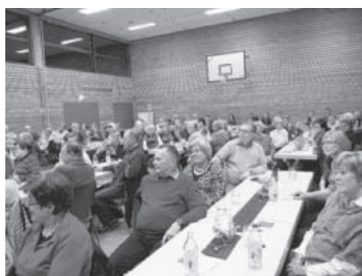
Interessierte Zuschauer in der Häfnerhalle.

„Unser Dorf e.V.“ Freunde Häfnerhaslachs U. Lo.