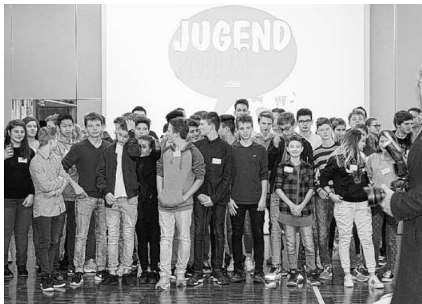
56 Jugendliche haben am Jugendforum teilgenommen.

Hohenhaslach 12.12.2016, 20:00 Uhr, Theoretischer Unterricht