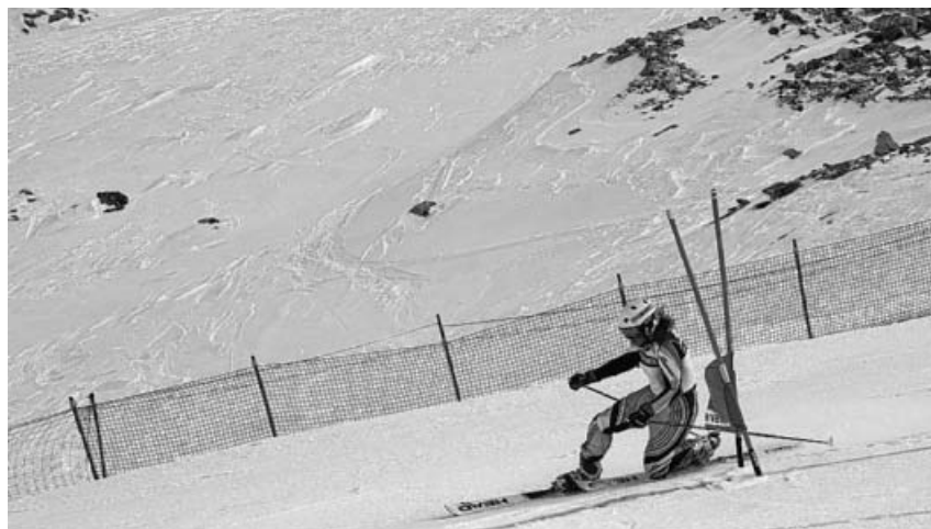
Berit im Vorlauf Sprint.

Highlight war das Rennen am Sonntag, das als Parallelrennen im direk-