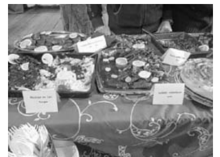
Das kulinarische Angebot.

Die Flüchtlingsfrauen wollen damit ein bisschen von dem zurückgeben, was sie selbst an Unterstützung im Ort erfahren.