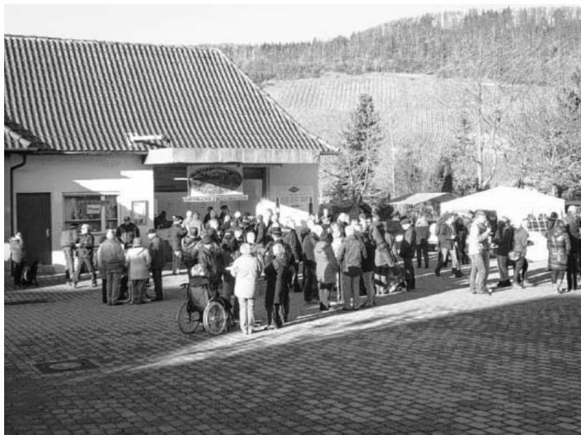
Glühweintreffen Silvester an der Kelter.

Die Mitgliederversammlung findet im Kleintierzüchterheim Großsachsenheim statt. Beginn 19.00 Uhr.