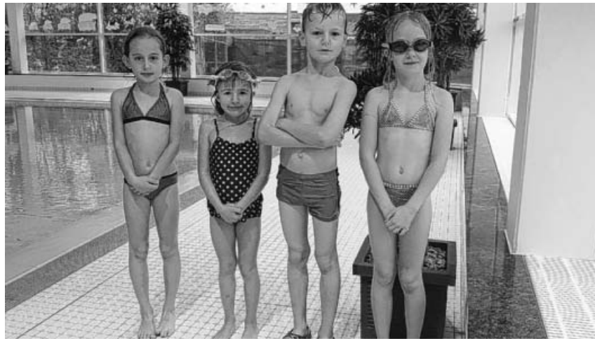
Schwimmkurs Gruppe 2.

TV Großsachsenheim Abteilung Schneesport