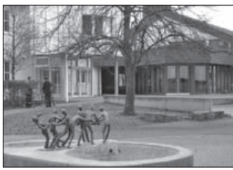
Schulzentrum in Sachsenheim mit der Kulturhalle, im Bild- vordergrund Brunnskulptur „Die sieben Schwaben“.