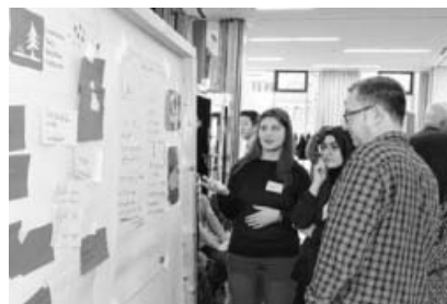
Jugendliche stellen den Gemeinderäten ihre Arbeit vor.

beitsgruppen zu den von Ihnen gewählten Themen. In diesen Gruppen wurde nun das Anliegen präzisiert und auf einem Plakat veranschaulicht. Nach einem gemeinsamen Mittagessen konnten die Ergebnisse nun der Verwaltungsspitze, den Vertretern des Gemeinderates und den Schulleitungen vorgestellt werden. Die Jugendlichen haben nun die Möglichkeit unter fachlicher Anleitung weiter an Ihren Themen zu arbeiten und diese ggf. im Gemeinderat vorzustellen. Zu folgenden Themen haben sich Arbeitsgruppen gebildet: Überdachter Treffpunkt für Jugendliche & Sportgeräte, Internet & freies WLAN, Sport und Indoorsport, Jugend Café, Kultur & Events, Bus & Bahn und Öffnungszeiten des Jugendhauses. Das Jugendforum war die Auftaktveranstaltung des Projektes „Sachsenheim. Deine Stadt, deine Stimme“ mit dem Ziel nachhaltige participationsstrukturen für Jugendliche in Sachsenheim zu schaffen.