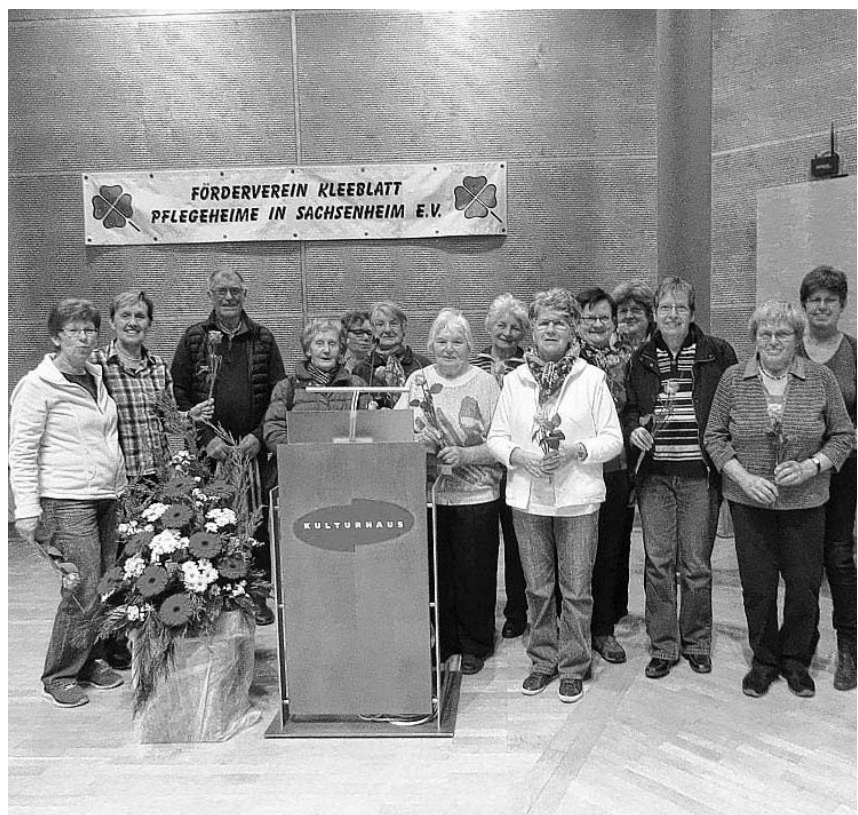
Die Helferinnen bekommen Rosen.

Vom 22.04. bis 27.04. 2017 findet eine 5-tägige Flugreise nach Griechenland statt „ Geheimtipp Chalkidiki – das ländliche Griechenland “ statt. Der Preis liegt, je nach Teilnehmerzahl, zwischen 888,- und 848,- Euro. Anmeldung und alle Informationen ab sofort bei: KreislandFrauenverband Ludwigsburg, Auf dem Wasen 9, 71640 Ludwigsburg, Tel. 07141/459890, Fax 07141/459892, www.kreislandfrauen-ludwigsburg.de