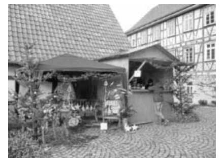
Albvereinsstand beim Häfnerhaslach Adventssamstag.