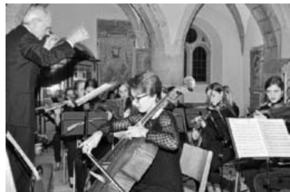
Festliche Stimmung beim Weihnachtskonzert des Lichtenstern-Gymnasiums in der Großsachsenheimer Stadtkirche (Archivbild 2015).

führung. Schülerinnen und Schüler treten als Solistinnen auf und bereichern das stimmungsvolle Konzert instrumental und gesanglich. Der Eintritt ist wie immer frei. Über Spenden freuen wir uns sehr. Sie kommen unseren Partnerprojekten sowie der musikalischen Arbeit am Lichtenstern-Gymnasium zu Gute.