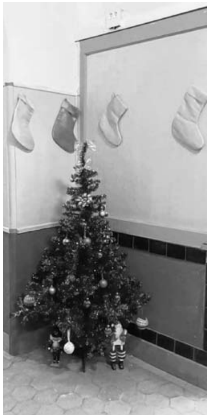
Adventsecke im Bürgerbahnhof.

und 18 Uhr im teilrenovierten, vorweihnachtlich geschmückten Bahnhofgebäude; manche wollten einfach nur in Erinnerungen an die Zeiten schwelgen, in denen sie ihre Bahnfahrkarten am Schalter kaufen konnten, aber viele zeigten großes Interesse daran, was wir, der Verein IBISA e.V., in dem Gebäude machen und anbieten werden. Bei süßen und salzigen Waffeln und heißem Apfelpunsch kamen zahlreiche nette Gespräche zustande; Mitbürger machten Vorschläge und äußerten Wünsche für die künftige Nutzung des Bahnhofs, und natürlich