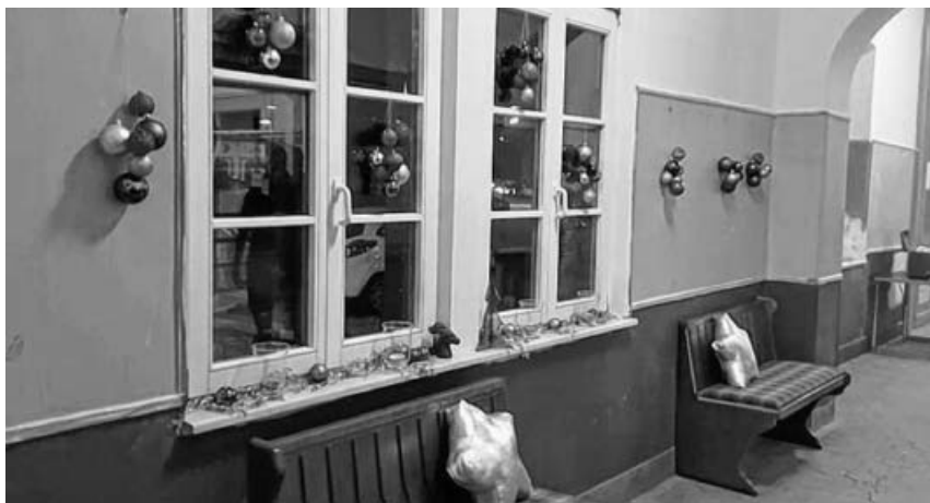
Der künftige Bürgerbahnhof in frischem Adventsschmuck.

fehlte es nicht an Lob dafür, was unser kleiner Verein bis jetzt schon zustande gebracht hat.