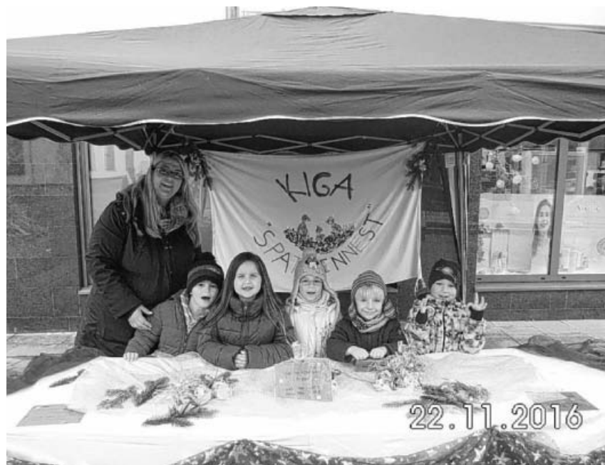
Die fleißigen Verkäuferinnen und Verkäufer aus dem Spatzennest.