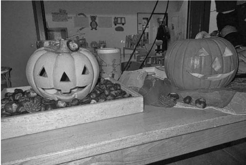
Schöne Lichter leuchten in der Nacht.

Kommt, wir woll'n Laterne laufen, Kind und Frau und Mann. Kommt, wir woll'n Laterne laufen, das ist unsre schönste Zeit. Kommt, wir woll'n Laterne laufen, alle sind bereit.