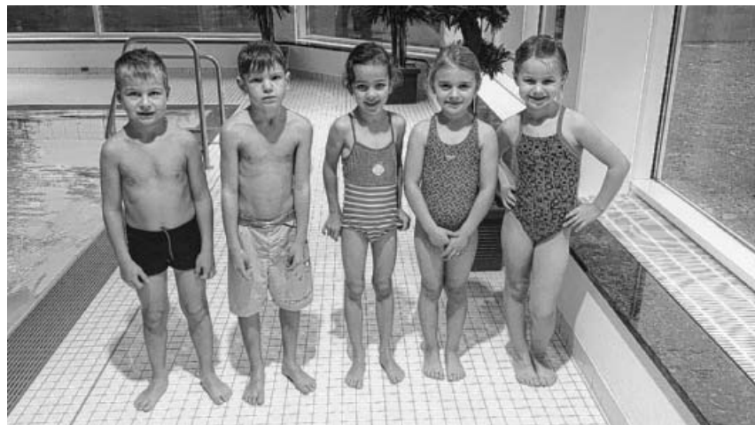
Schwimmkurs Gruppe 1.

In diesem Herbst haben wieder 30 Kinder an unserem Schwimmkurs teilgenommen. Durch spielerische Einführung wie Wassergewöhnung, um die Angst vor dem Wasser zu nehmen, vorsichtige Tauchversuche, die dazu führen auch mal den Kopf unter Wasser zu bringen, und natürlich ausführliche Schwimmübungen, wurden die kleinen Teilnehmer in den letzten Wochen im Hallenbad auf den Abschluss vorbereitet. Insgesamt haben 13 Kinder das Schwimmabzeichen Seepferdchen abgelegt, das heißt: der Sprung vom Beckenrand, 20 Meter ohne Unerbrechung schwimmen und einen Ring aus schultertiefem Wasser holen. Nach bestandener Prüfung konnten die Teilnehmer eine Urkunde und ein Abzeichen mit nach Hause nehmen.