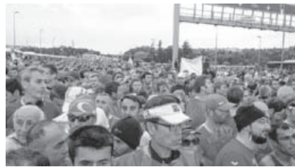
Tausende Läufer warten auf das Startzeichen.

Insgesamt 38.000 Läufer weltweit, unter Anderem auch aus Deutsch-