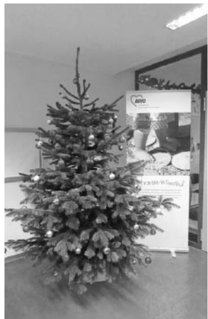
Oh Tannenbaum, oh Tannenbaum...

Am Nachmittag des 27.10.2016 fand im Kindergarten „Arche Noah“ das diesjährige Herbstfest statt. Bei schönstem Wetter versammelten sich die Kinder mit ihren Erzieherinnen, um den Eltern ein liebevoll vorbereitetes Programm mit schönen Liedern und Gedichten zu präsentieren. Dieses wurde natürlich aufmerksam verfolgt und mit einem großen Applaus belohnt. Thematisch hatten sich die Kinder zuvor ausgiebig mit dem Herbst und dem Apfel beschäftigt. Die Erzieherinnen erfreuten die Kinder mit einer Herbstgeschichte, die sie sehr abwechslungsreich mit verschiedenen Handpuppen präsentierten. Im Anschluss gab es ein reichhaltiges Buffet, zu dem viele Eltern beigetragen hatten. Als passendes Getränk durfte ein leckerer Apfelpunsch nicht fehlen. Nach dem Laternenlauf erwartete die Familien eine ganz besondere Überraschung. Der Weg in den Garten war von warm leuchtenden, wunderschönen Windlichtern gesäumt. Diese hatten alle Kinder gestaltet und jedes Kind durfte nach dem gemeinsamen Abschluss am Ende des Festes eines davon als Erinnerung mit nach Hause nehmen. Wenn sich die Kinder demnächst einen Apfel schmecken lassen, werden sie sicher daran denken, was in diesem kleinen Wunder steckt und sich gerne an ihr tolles Fest erinnern.