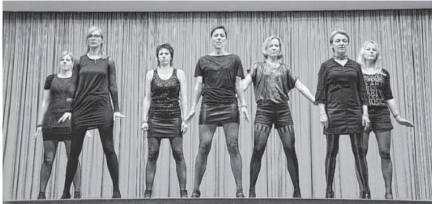
TV Ochsenbach in toller Bewegung.

Musical Chicago begeisterte der TV Ochsenbach beim letzten Seniorentreff.