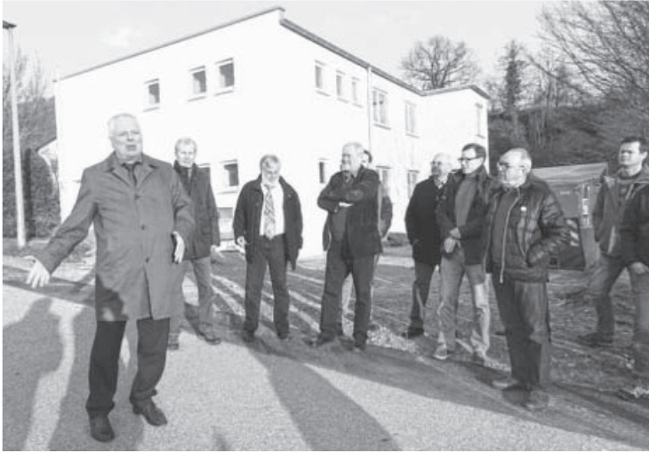
Noch bevor die Asylbewerber dort einzogen, haben die Mitglieder des Technischen Ausschusses und der Ortschaftsrat Hohenhaslach die Asylbewerberunterkunft Steigle besichtigt. 36 Menschen wohnen nun hier.