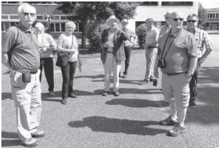
Vom 18. bis 21. Juni 2016 waren Gäste aus Saint-Paul de Joliette (Quebec) zu Gast in Sachsenheim. Im Anschluss reisten sie nach Valréas zum 30. Partnerschaftsjubiläum.