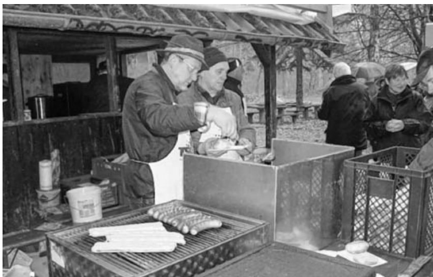
Leckere Grillwürste von den Mäfis.

Die Weihnachtsbesuche des TVG werden durch Spenden vieler TVG-Mitglieder aus zahlreichen Abtei-