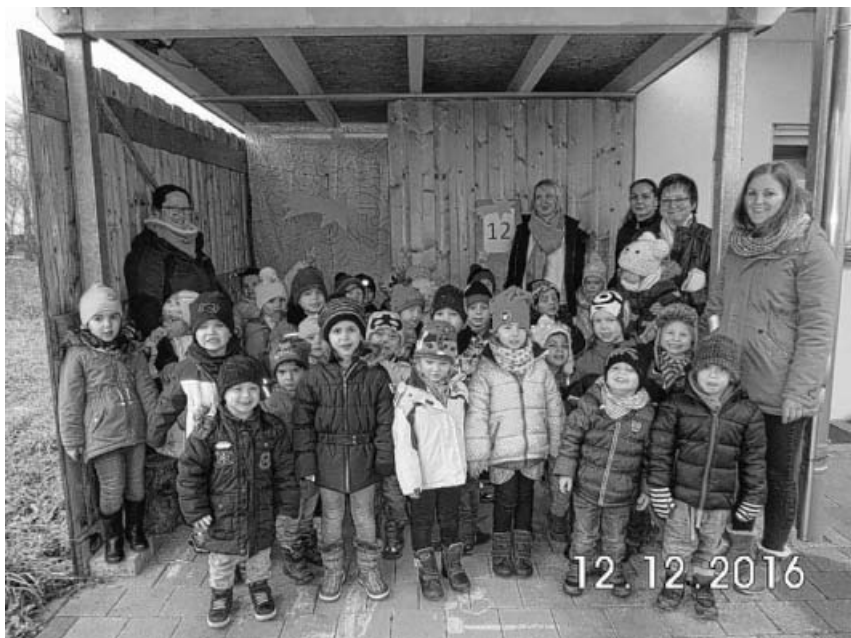
Die Kinder vom Spatzennest vor einer Adventstür.

Bereits Anfang November wurden fleißige Helfer gesucht, und einige Kindergarteneltern erklärten sich bereit, ihre Fenster oder Türen weihnachtlich zu schmücken.