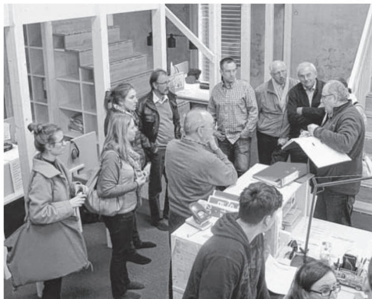
Um sich über die Möglichkeiten der Gemeinschaftsschule zu informieren, war eine Delegation aus Mitgliedern des Gemeinderates und der Schule im März unterwegs. Besucht wurde eine „Musterschule“ in Wutöschingen.