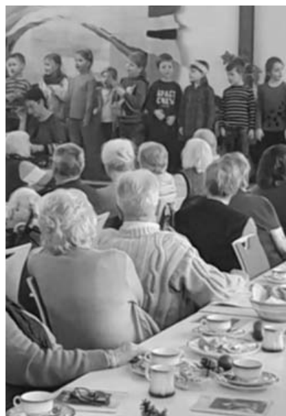
Die Kinder singen Weihnachtslieder für die Senioren.

Als Dankeschön durften sich die Kinder mit ihren Eltern und Erzieherinnen, die sie unterstützt hatten, an einem kleinen Buffet stärken. Die Kinder freuen sich schon darauf, auch im nächsten Jahr mit einem neuen Programm den Senioren wieder Freude zu bringen.