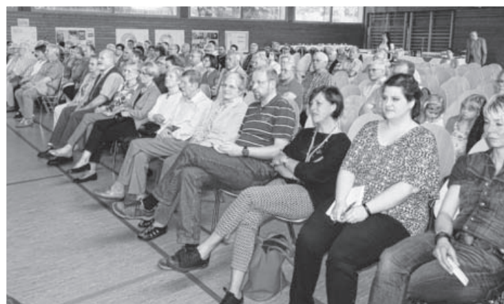
Etliche Sachsenheimerinnen und Sachsenheimer fanden den Weg zur Einwohnerversammlung in Hohenhaslach. Sie wurden über abgeschlossene, aktuelle und künftige Projekte in der Stadt informiert. Schwerpunkt war dieses Mal Hohenhaslach. Im Anschluss war ein gemütliches Beisammensein, bei dem ein reger Austausch stattfand und auch Fragen an die Verwaltungsvertreter gestellt wurden.