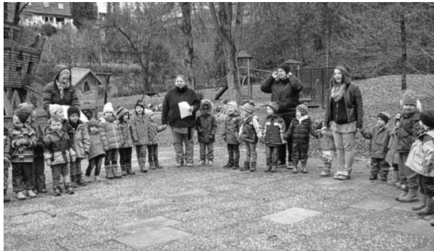
Die Kinder warten ganz gespannt auf das neue Adventsfenster.