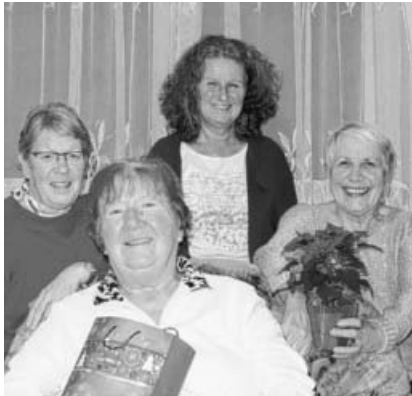
Vergnügliche Stunden beim Weihnachtsbesuch des TVG.

Der Verein bedankt sich bei allen Spendern und vor allem bei allen Mitgliedern, die die Besuche ehrenamtlich durchführen. Natürlich ist beabsichtigt, die Aktion auch im nächsten Jahr fortzusetzen.