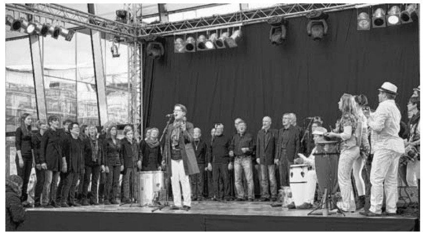
Auf der CMT.

Nutzen Sie die Gelegenheit für einen Spaziergang oder eine Winterwanderung und stärken Sie sich beim TVO.