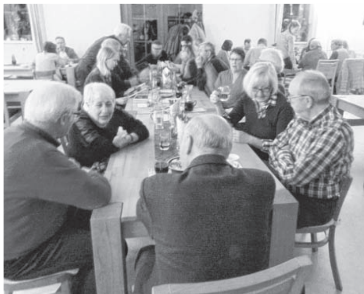
Mit über 20 Gästen war der erste Valréas Stammtisch 2016 im Schülke Besen im März sehr gut besucht. Das Interesse an den gemütlichen Treffen rund ums Thema Valréas ist groß.