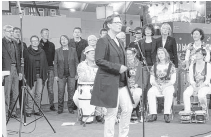
Der Chor notabene präsentierte sein Können auf der SWR Showbühne bei der CMT. Natürlich ließen es sich die Sängerinnen und Sänger nicht nehmen auch noch am Stadtstand ein paar Stücke zu präsentieren. Das Publikum war begeistert.