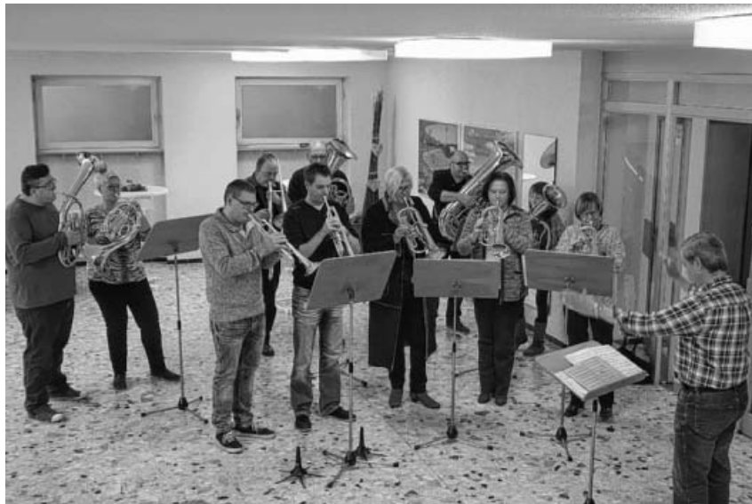
Posaunenchor bei der Weihnachtsfeier.

18.00 Uhr Jahresabschluss-Gottesdienst in Großsachsenheim und Hohenhaslach 18.00 Uhr Jahresabschluss der Sonntagsschule in Sachsenheim