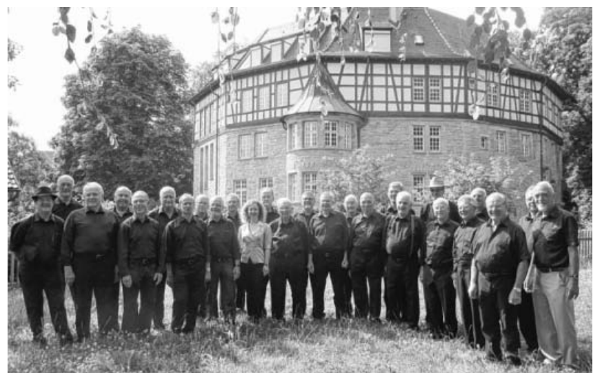
Hier könnten Sie auch stehen und beim Männerchor LS mitsingen.

Wir werden sie an dieser Stelle, in den Tageszeitungen, sowie auf unserer Internetseite auf dem Laufenden halten. Einfach mal reinschauen unter www.eintracht-kleinsachsenheim.de .