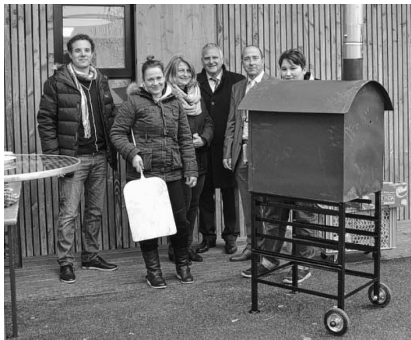
Die Abordnung der Fa. Jungheinrich bei der offiziellen Übergabe.

Zu guter Letzt: Nach einem ereignisreichen Jahr beginnen auch bei uns am 22.12. die Weihnachtsferien. Wir wünschen allen ein gemütliches und besinnliches Weihnachtsfest und einen „guten Rutsch“ ins neue Jahr. Ab dem 10. Januar sind wir dann mit neuer Kraft zu den gewohnten Öffnungszeiten wieder für euch da.