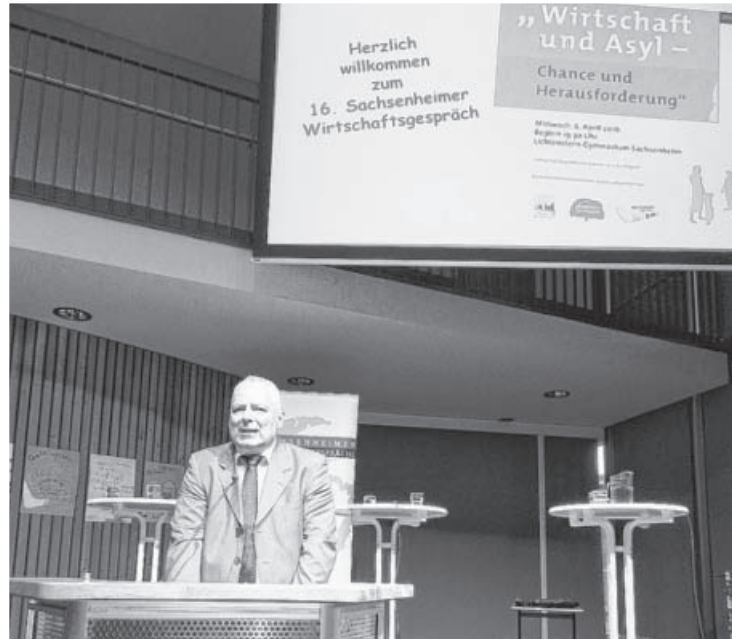
Im April gab es die 16. Wirtschaftsgespräche – eine Kooperation mit dem Lichtenstern Gymnasium und der Sachsenheimer Zeitung. Im gut besuchten Foyer des Lichtenstern-Gymnasiums fand die Podiumsdiskussion zum Thema „Wirtschaft und Asyl – Chance und Herausforderung“ statt.