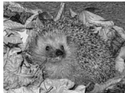
Der Igel erkundet neugierig die unbekannte Umgebung.

Draußen wird es immer kälter und die Tiere haben sich bereits eifrig auf den Winter vorbereitet. Passend zu unseren Projektthemen „Der Herbst ist schön“ und „Tiere“ bekamen diese Kinder Besuch von Frau Scholl und zwei Igel. Diese Igel können nicht wie alle anderen Winterschlaf halten, da sie noch zu klein sind. Die Kinder waren sehr begeistert von den lebhaften kleinen Igel, sodass auch fast alle mutig genug waren, die Igel zu streicheln. Nebenbei erfuhren sie wie genau ein Igel überhaupt aussieht, was er frisst und trinkt, warum sich ein Igel einrollen kann und wie er den kalten Winter übersteht. Für alle Beteiligten war es ein sehr interessanter und aufschlussreicher