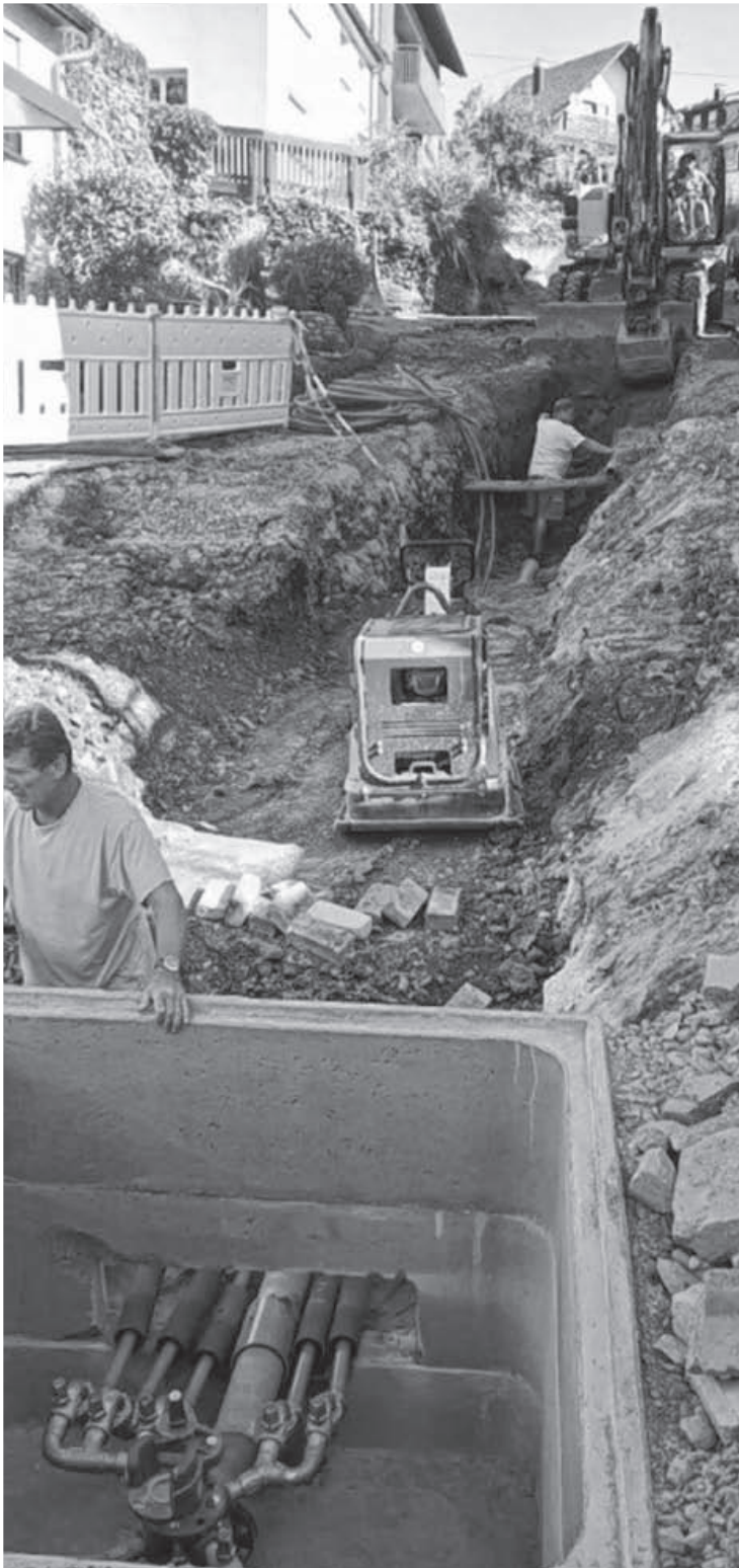
In der Weinerstraße in Hohenhaslach wurden die Wasserleitungen erneuert und auch ein neuer Fahrbahnbelag aufgebracht. Hierfür musste die Straße für elf Wochen teilweise gesperrt werden.