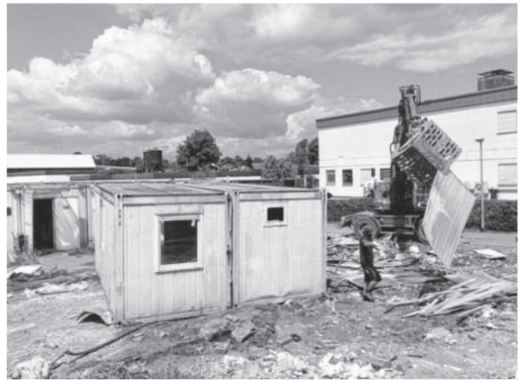
Das Versprechen, das Bürgermeister Horst Fiedler den Anwohnern und Nachbarn im Seepfad gab, wurde im Juli eingelöst: Die Asylunterkunftsanlage im Seepfad 44 wurde abgebaut. 1992 wurde die Anlage für 32 Personen erstellt. Die Container waren vom Landratsamt angemietet, das dort Asylbewerber untergebracht hat.