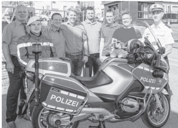
Eine Ehrung der besonderen Art gab es im September für sechs Kleinsachsenheimer. Die Polizeidirektion Ludwigsburg ehrte sie für ihr beherztes Eingreifen mit viel Zivilcourage im Rahmen einer polizeilichen Ermittlung mit einer Urkunde.