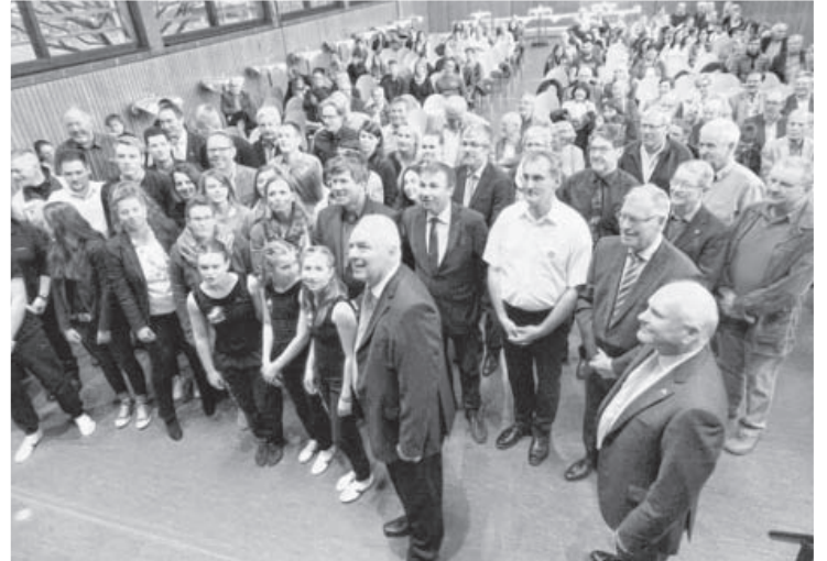
Am 9. April fanden die diesjährigen Ehrungen für erfolgreiche Sportlerinnen und Sportler im Rahmen der Jahresfeier der SKS durch Bürgermeister Horst Fiedler statt. Es konnten 49 sportliche Ehrungen vorgenommen werden. Aber auch vier ehrenamtlich Tätige aus den Vereinen wurden ausgezeichnet. Außerdem durften noch 28 Blutspenderinnen und Spender ausgezeichnet werden.