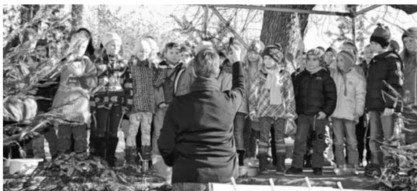
Singende Kirbachschulkinder bringen Freude in die Herzen.

Große Unterstützung und Hilfsbereitschaft durfte die Kirbachschule auch im Jahr 2016 erfahren. Zuletzt beim Eislaufen, wo zahlreiche