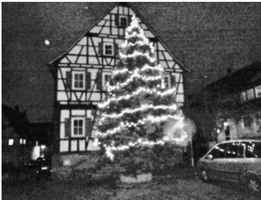
Weihnachtsbaum am Rathaus in Kleinsachsenheim.

09.30 Uhr Gebetstreff im Pfarrbüro 09.45 Uhr „Kommt lasset uns anbeten“, Weihnachten in aller Welt Das Opfer ist für Brot für die Welt. Kinderbetreuung für Kleinkinder.