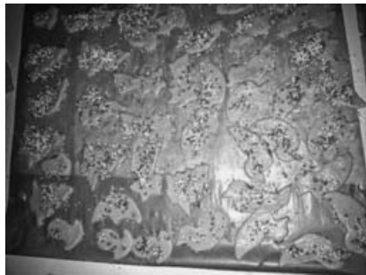
Von deutschen und geflüchteten Kindern selbst gemachte Bredle.

Ein herzliches Dankeschön an die Realschule für die Bereitstellung der Schulküche sowie die engagierten Übungsleiterinnen und alle Helfer für ihren zusätzlichen Einsatz an einem Samstag in der Vorweihnachtszeit.