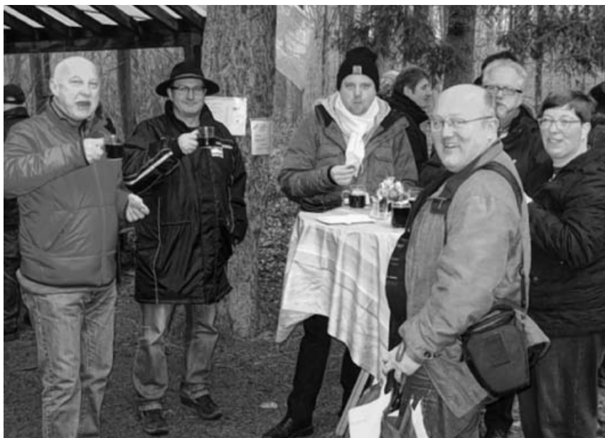
Beim Jahresausklang auf dem Waldspielplatz 2015.