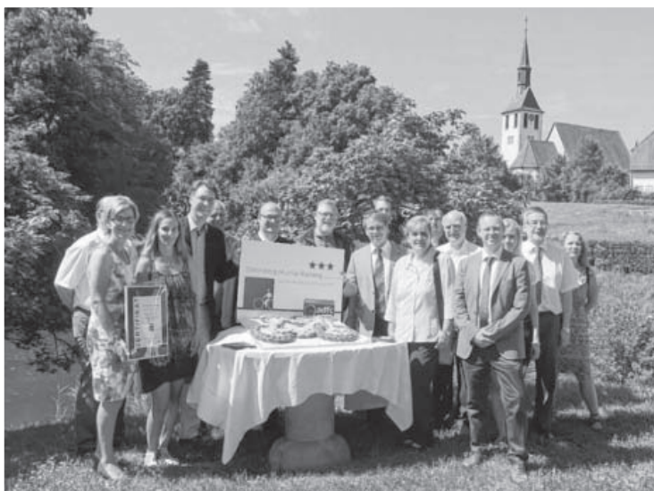
Der Radweg verläuft von Sersheim entlang des Gewerbeparks Eichwald in Richtung Bietigheim und streift somit das Sachsenheimer Stadtgebiet im Süden. Nun ist er offizielle ADFC-Qualitätsroute und mit 3 Sternen ausgezeichnet worden. Auf 152 km von Karlsruhe bis Gaildorf quert der Radfernweg das „Ländle“ von West nach Ost. Entlang des Radwegs besteht durchgehend eine sehr gute Bahnabbindung. Gute Übernachtungsmöglichkeiten bieten die Bett&Bike-Betriebe.