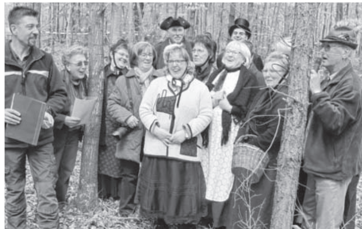
Vor 25 Jahren hatten die Frauen der Weiberzeche ein Waldstück wieder aufgeforstet, das vom Sturm Wiebke zerstört wurde. Am 29. April wurde dieses Jubiläum nun im Wald in Ochsenbach begangen. „Nun ist die Freveltat der Eichbaum-Affäre endgültig gesühnt“, lobte Bürgermeister Fiedler die Weiberzeche. Natürlich gab es auch einen Umtrunk, ganz im klassischen Sinne der Weiberzeche.