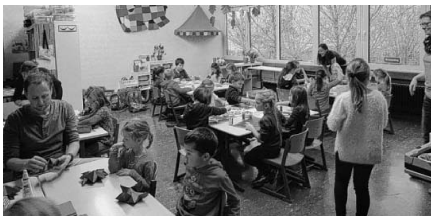
Viele Eltern helfen in der Kirbachschule mit.

Am 22.11.16 war es wieder soweit. Mehrere Busse brachten uns zur Premiere des Märchens „Die goldene Gans“. Der Klassiker von den Gebrüder Grimm handelt davon, dass die Familie des Dummlings ihm nichts zutraut und ihn aufgrund seiner lebhaften Fantasie und seines liebevollen Wesens belächelt. Doch genau wegen dieser Eigenschaften bekommt er eine goldene Gans ge-