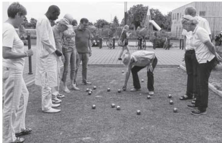
Zwei bis drei Mal pro Jahr können sich alle Valréas Interessierten beim Stammtisch treffen. Im Juli kamen rund 15 Personen zum gemeinsamen Boule Spiel zusammen. Die Städtepartnerschaft mit Valréas ist in der Sachsenheimer Bevölkerung stark verwurzelt. Bei diesen lockeren Treffen tauschen sich die Menschen aus, informieren sich über Aktuelles und haben einfach Spaß.