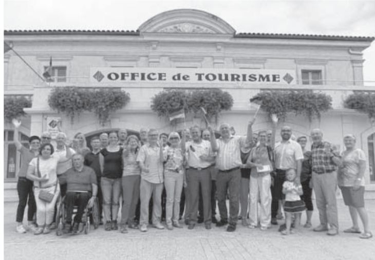
Die Gruppe wurde am Tourismusbüro Valréas sehr herzlich empfangen. Es wurde aber nicht nur gefeiert. Das Kennenlernen stand im Mittelpunkt und im Rathaus fand auch ein informatives und freundschaftliches Treffen statt.