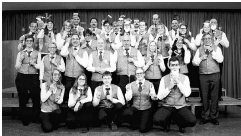
Frohe Weihnachten vom MVS!