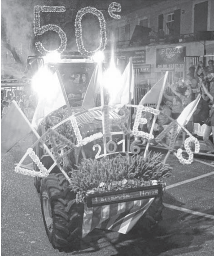
Anlass für eine Informationsfahrt des Gemeinderates war der 50. Lavendelcorso in Valréas. Für alle, die den Umzug jemals gesehen haben, ist er ein bleibendes Erlebnis: bunt, laut, abwechslungsreich und mit jeder Menge Konfetti und Lavendelwasser.