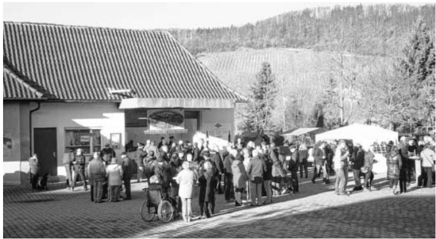
Glühweintreffen Hohenhaslach Silvester Kelterplatz.