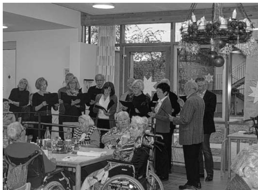
Gesangsensemble tonART09 bringt Weihnachtslieder ins Haus.

Wir wünschen Ihnen allen ein besinnliches, fröhliches Weihnachtsfest und für das Jahr 2017 alles Liebe und Gute.