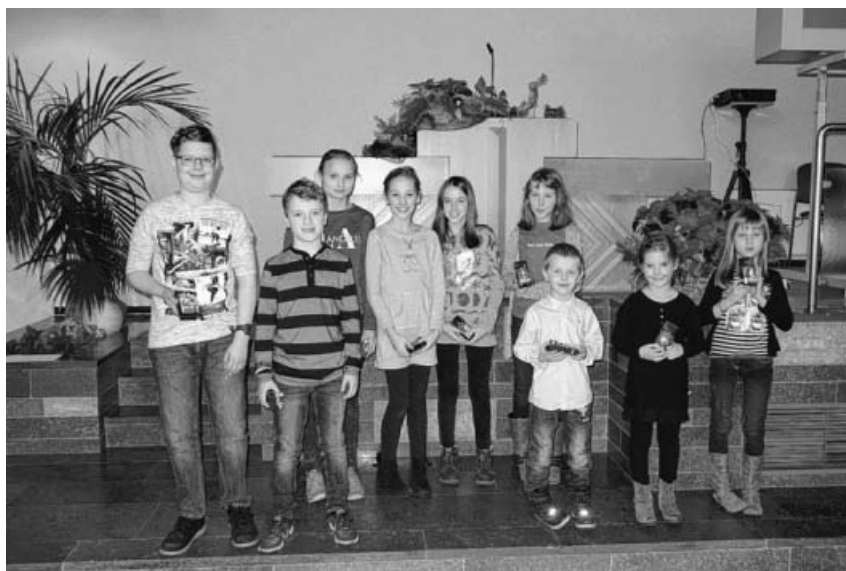
Geschenke für die Kinder durften bei der Weihnachtsfeier natürlich nicht fehlen.

Sonntag, 1. Januar 2017, Neujahr 11.00 Uhr Gottesdienst zum Jahresbeginn in Großsachsenheim und Hohenhaslach