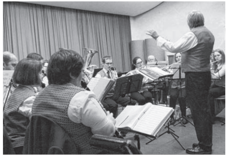
Mit schmissiger Musik umrahmte die Stadtkapelle den Ehrungsabend in der Mehrzweckhalle. Außerdem begeisterten die Nachwuchsturnerinnen und -turner des TSV Kleinsachsenheim das Publikum.