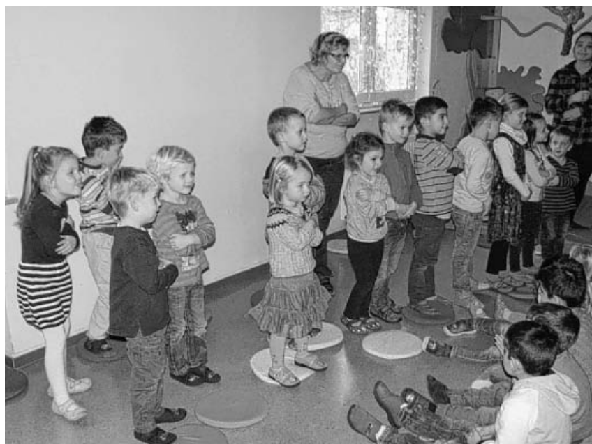
Die Hasenkinder führen das Lied „In der Weihnachtsbäckerei“ vor.