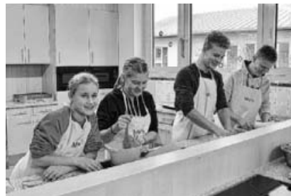
MVS Jugend beim Plätzle backen.

Der Musikverein Stadtkapelle Sachsenheim e.V. wünscht Ihnen schon jetzt 'Frohe Weihnachten' und einen glückliches neues Jahr 2016!