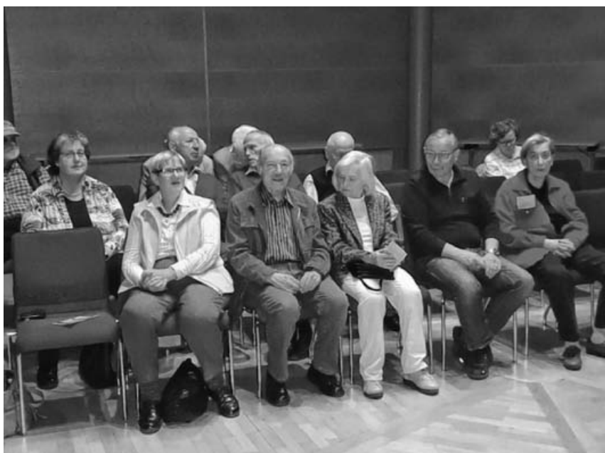
Die interessierten Zuhörer.

Jeden Dienstag treffen sich Übungswillige von 8.45 bis 9.45 Uhr im Evangelischen Gemeindehaus in Großsachsenheim und von 10.00 - 11.00 Uhr im Gemeindehaus in Kleinsachsenheim. Nähere Informationen erhalten Sie unter Tel. 07147-921017