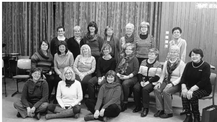
Erste Probe des Frauenprojektchors.

Am Sonntag, 14. Mai, 18.00 Uhr (Einlass 17.30 Uhr) lädt der Frauenprojektchor des Vokalensemble Stromberg zu einer Stunde der Kirchenmusik in die Georgskirche Hohenhaslach ein. Im Mittelpunkt des Konzerts steht die romantische Messe in A-Dur op.