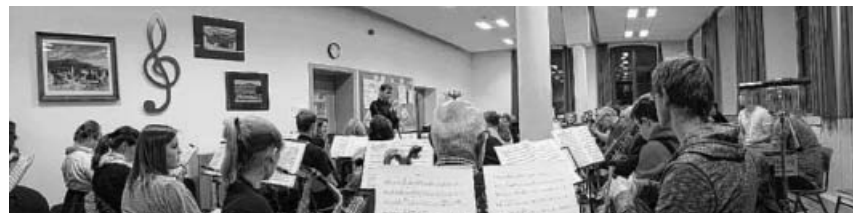
Die erste Probe des Projektorchesters 1717.

An folgenden Termine wird von 19 - 21 Uhr geprobt: Donnerstag, 4. Mai, Donnerstag, 1. Juni, Donnerstag, 6. Juli. Wir wollen Stimme und Sprache mit internationalem, vor allem aber auch mit deutschen Liedgut weiter schulen und trainieren. Und das im bekannt fröhlichen und herzlichen Miteinander. Einander begegnen und voneinander lernen ist das Ziel, die einzigen Voraussetzungen sind Neugierde und die Lust auf Menschen und Musik. Eingeladen sind alle, die gerne singen, unabhängig von Alter, Vorerfahrung und Nationalität.