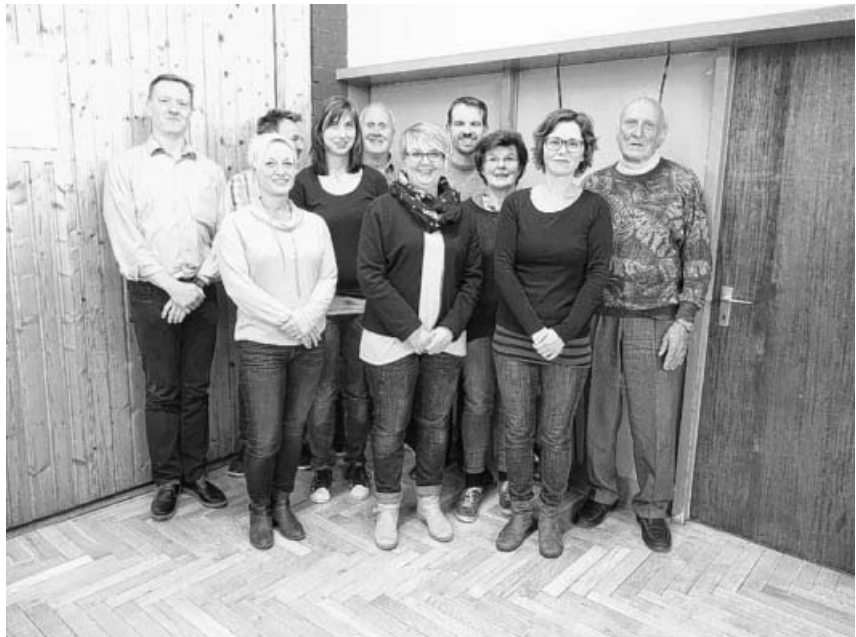
Alter und neuer Vorstand vom Albverein.

Mit dem Albvereinslied wurde die Generalversammlung eröffnet. Der Vorsitzende Holger Springer hieß die Mitglieder willkommen. Bei der Totenehrung wurde an die verstorbene