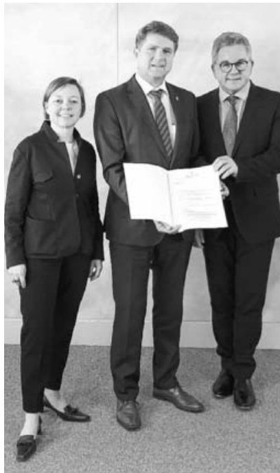
Übergabe des Förderbescheides durch Minister Guido Wolf an den KST.

Im gesamten Kraichgau-Stromberg sollen touristisch attraktive thematische Rundwanderwege im Halbtages- und Tagesformat entstehen, die neben der attraktiven Wanderstrecke auch die Gastronomie und den ÖPNV einbeziehen, und nach Qualitätskriterien umgesetzt werden sollen. Die Attraktivität und das Thema des Weges sind hier besonders wichtig, um mit zielgerichtetem Themenmarketing Besuchsansätze für die Region zu schaffen. Im Besonderen stellen die Rundwanderwege für Tagesausflügler und Touristen das attraktivste Wanderangebot dar, da