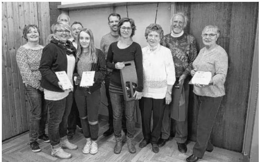
Ehrungen für 10, 25 und 40 Jahre Mitgliedschaft sowie die am meisten gewanderten Mitglieder.