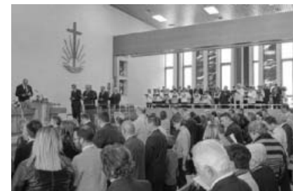
Konfirmationsgottesdienst in Sachsenheim.

Weitere Infos unter www.nak-sachsenheim.de