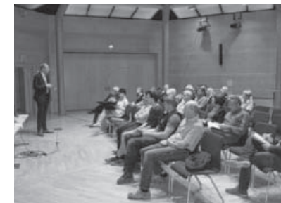
Rund 25 Besucher folgten den Vorträgen mit großem Interesse.