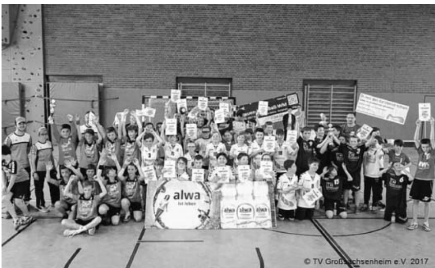
Abschlussfoto beim diesjährigen ALWA-Cup.

durchführte, konnten die Zuschauer in den unterschiedlichen Altersklassen wieder jede Menge spannende und gute Handballspiele betrachten. Da auch das Rahmenprogramm passte, erhielt der Veranstalter viel Lob von Trainern und Spielern der teilnehmenden Vereine, von denen einige bereits jetzt ihr Kommen im nächsten Jahr angekündigt haben. An den drei Turniertagen nahmen insgesamt 28 Teams aus 14 Vereinen teil, wobei die Mannschaften des