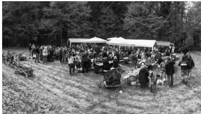
Waldfest des MVS.

Der Mai ist...noch nicht ganz da – doch trotzdem dürfen wir Sie gerne schon zu unserem Waldfest auf dem Waldspielplatz Großsachsenheim am 01. Mai 2017 einladen und würden uns freuen, Sie dort willkommen zu heißen! Ob Wanderer oder Radfahrer – Idyllisch auf einer Waldlichtung gelegen, genießen Sie ab 11.00 Uhr bei (hoffentlich) frühlingshaften Temperaturen einen schönen Tag mit Herzhaftem vom Grill oder dem ein oder anderen kühlen Getränk. Sollten Sie etwas länger bleiben oder erst später: Unser Team erwartet Sie bereits mit einem Stück Kuchen und/oder einer Tasse Kaffee. Zusätzlich wird Ihnen von 12.00 - 13.30 Uhr unsere Jugendkapelle und ab 14.00 Uhr das Große Blasorchester aus musikalischer Sicht ein buntes und unterhaltsames Programm bieten, so dass auch Freunde der Blasmusik voll auf ihre Kosten kommen werden. Auf Ihr Kommen freut sich Ihr Musikverein Stadtkapelle Sachsenheim e.V.