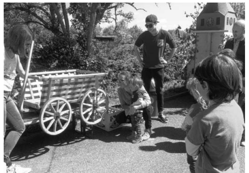
Beim Glücksrad drehen.