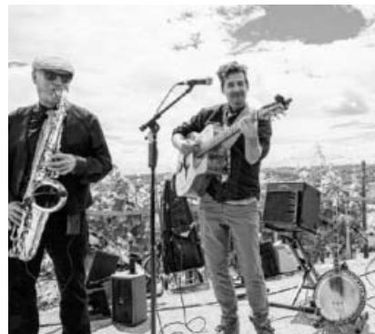
Acoustic Swing Duo.

Schülke's Hof Bromberghöfe 1, 74343 Sachsenheim-Ochsenbach Tel.: 07147/276181, info@schuelkehof.de