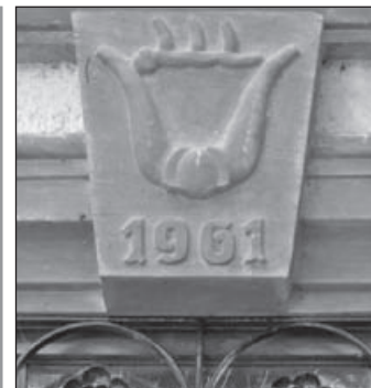
Steinwappen am Türsturz.