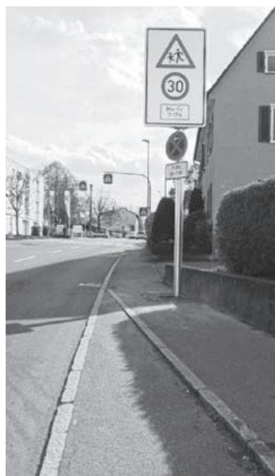
Tempo 30 in der Oberriexinger Straße.

Darüber hinaus prüft das Landratsamt noch, ob der reduzierte Geschwindigkeitsbereich bis auf Höhe des Kinderhauses Mobile ausgedehnt werden kann. Die Stadtverwaltung bittet alle Verkehrsteilnehmer um Beachtung.