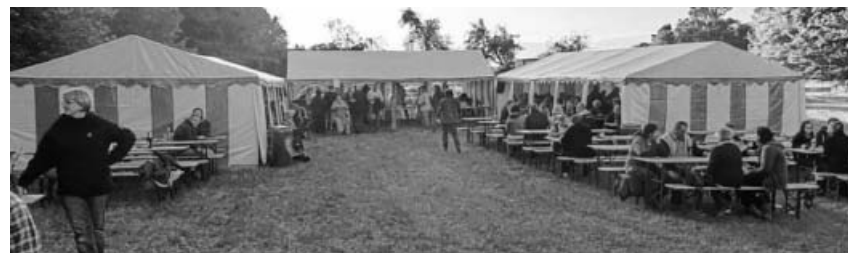
Sonnwendfeierplatz in Häfnerhaslach.

15. August 2017 – Teilnahme am Ferienprogramm der Stadt Sachsenheim (FitKom)