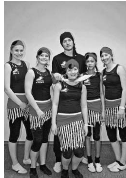
Die TSV Turngruppe als Piraten von "Fluch der Kaibik".

bereitet und nun noch einmal gezeigt. Ein besonderer Dank geht an die Sportler vom TSV Kleinsachsenheim, da diese mit viel Ehrgeiz und regelmäßiger Teilnahme am Training für den Erfolg dieser Auftritte gesorgt haben.