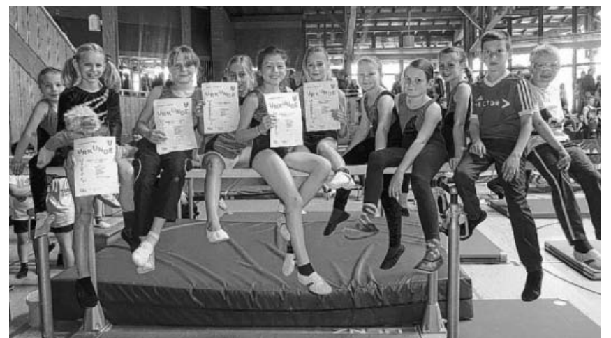
Viel Spaß und viele Urkunden gab es beim Turngau-Wettkampftag.

Weitere Informationen erhalten Sie direkt vor Ort im SportPark oder telefonisch unter 07147-900226.