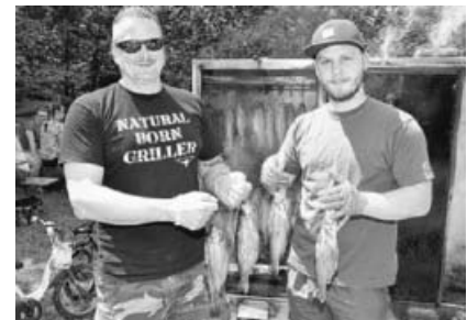
Eine Spezialität des Vereins: frisch geräucherte Forellen.

Bei strahlendem Sonnenschein strömten zahlreicher Besucher, viele davon mit dem Fahrrad, zu Fuß oder gar mit dem Kanu, auf das Vereinsgelände an der Enz in Unterriexingen. Dort wurden die Gäste bereits morgens mit einem Weißwurstfrühstück verwöhnt. Der absolute Renner waren natürlich die Fischgerichte, insbesondere die frisch geräucherten Forellen. Aber auch die Kuchen und Torten, hausgemacht von den „Anglerfrauen“, fanden regen Absatz.