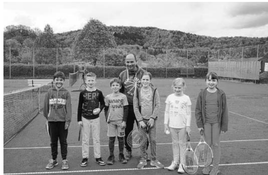
Gruppe 1 vor dem ersten Training.

Zur Information: Anträge auf Ergänzungen der Tagesordnung müssen bis eine Woche vor der Versamm-