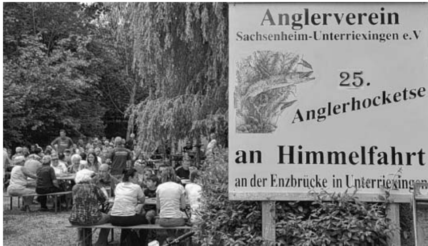
Bereits ein Vierteljahrhundert Anglerhocketse.