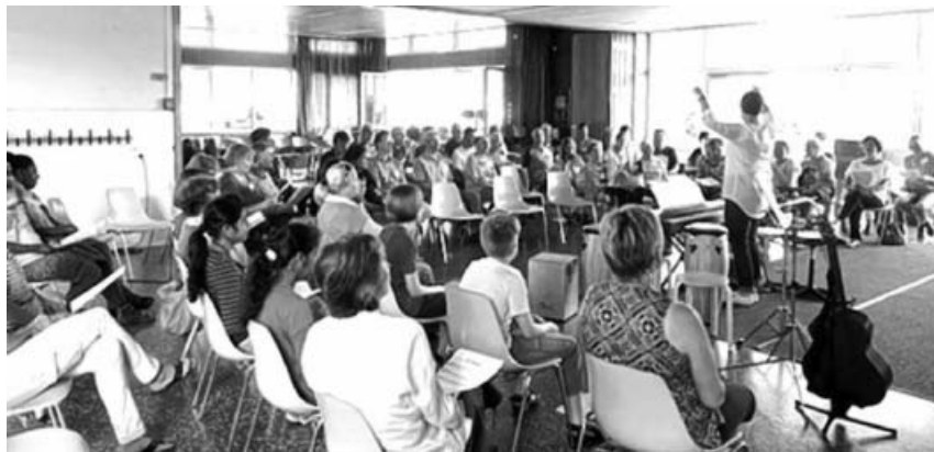
Einfach Singen drinnen...

Nach den Sommerferien geht es weiter – und darüber freuen wir uns alle sehr! Weiterhin 1mal monatlich werden wir uns donnerstags ab 19 Uhr in der Kirbachschule Hohenhaslach zum Singen und Musizieren treffen. Hier schon mal die Termine: 21. September, 12. Oktober, 9. November, 7. Dezember.