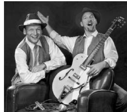
Mojo Oil am 17. Juni im Tender.

Fr. 30. Juni 3. Sachsenheimer Abendspaziergang Weitere Informationen in der nächsten Ausgabe sowie unter www.ibisa-sachsenheim.de