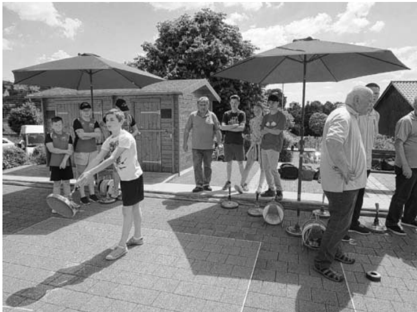
Erstes Turnier unserer Jugendlichen.