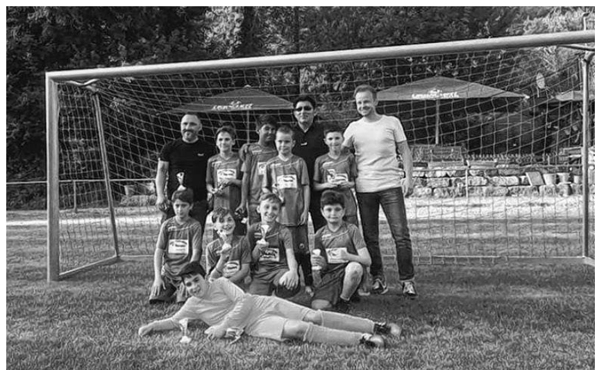
E-Junioren werden Dritter in Markgröningen.