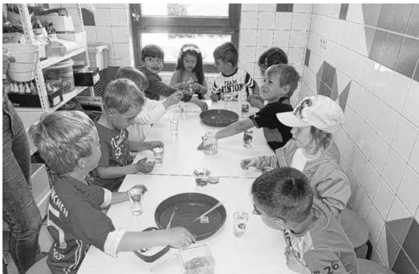
Die Kinder beim experimentieren im "Forscherstüble".