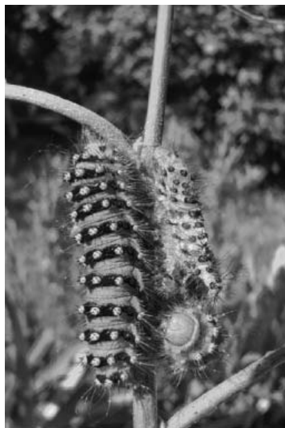
Raupe des Kleinen Nachtpfauenauges.