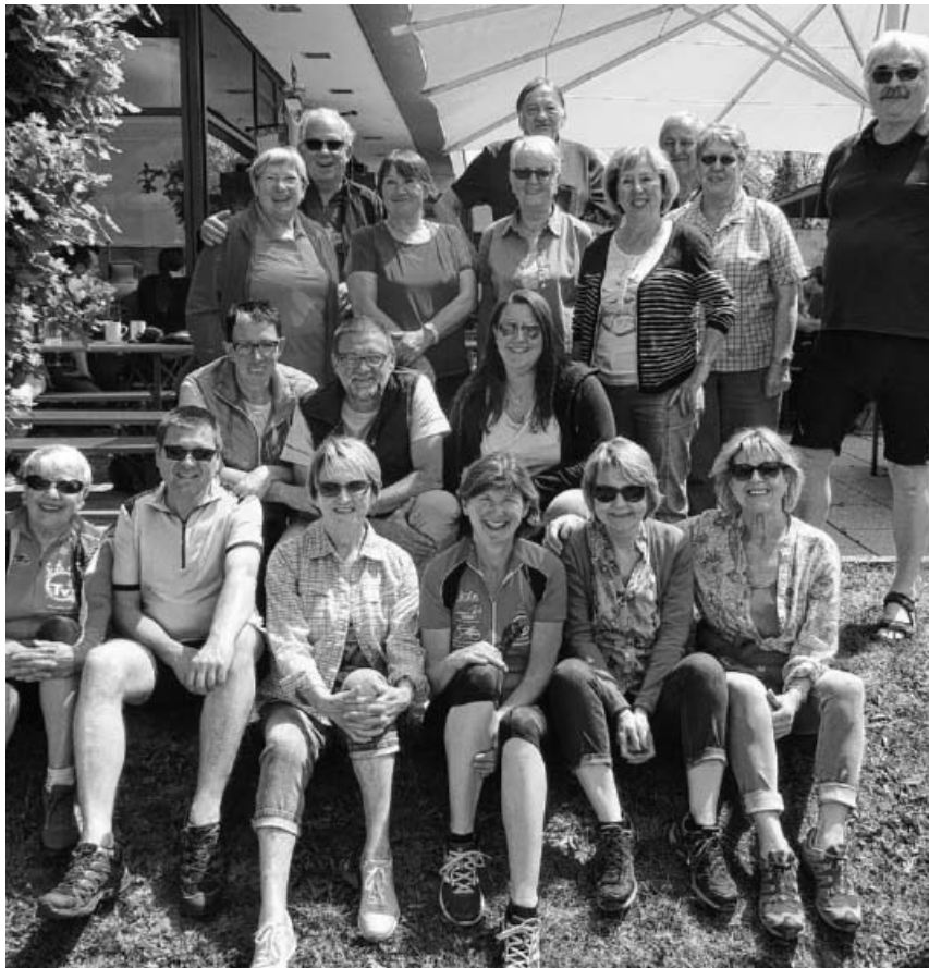
TVG-Wander- und Radgruppe beim Gauwandertag in Tamm.