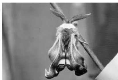
Männliches Kleines Nachtpfauenaugenauge.

Wer sich schon vorher über Nachfalter und ihre „Verwandten“ informieren möchte, kann die aktuelle Aus-