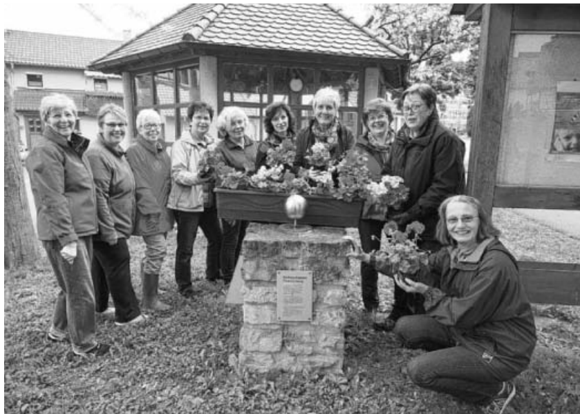
Bei der Pflanzaktion am Dorfplatz.

Nun gelang es dem TSV Kleinsachsenheim einen starken Partner zu gewinnen um dieses Turnier noch attraktiver zu gestalten. Die Firma Elbo Gebäudetechnik unterstützt mit ihrem Engagement im Besonderen die Jugendarbeit der Fußballabteilung und somit freuen sich die beiden Vertragspartner über den ab dieses Jahr neu stattfindenden „Elbo-Cup“!