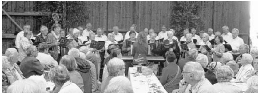
Männerchor LS und Kirchenchor bei ihrem Auftritt.

Vorschau: Am Sonntag, dem 18. Juni trifft sich der Männerchor LS um 9.30 in Löchgau im dortigen ev. Gemeindehaus zur Vorbereitung eines Auftritts. Kleidung dem Anlass entsprechend in schwarz mit grüner Krawatte.