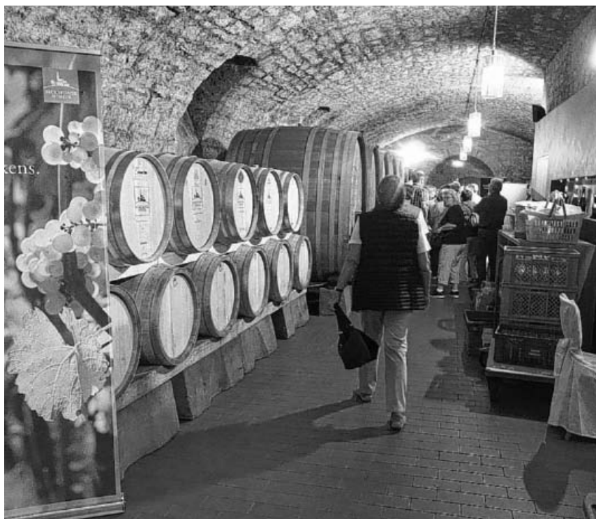
Im Schaukeller der Genossenschaftskellerei in Beckstein.