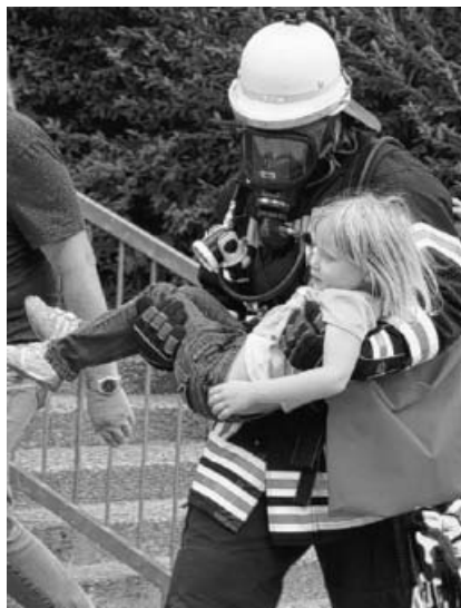
Wohlbehütet, in sicheren Händen, wurden die Kinder aus dem brennenden Kindergarten getragen.