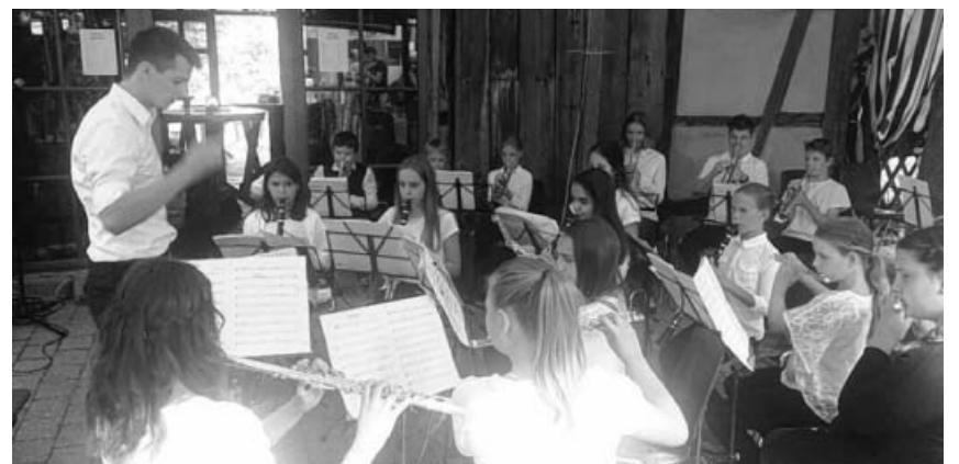
Die Jugendkapelle des MVO.