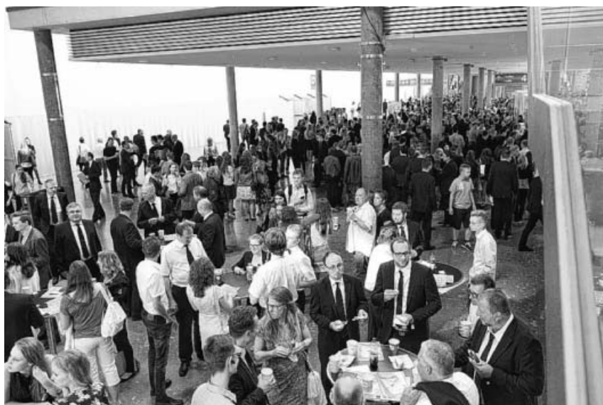
Jugendtag in der Messe Stuttgart.