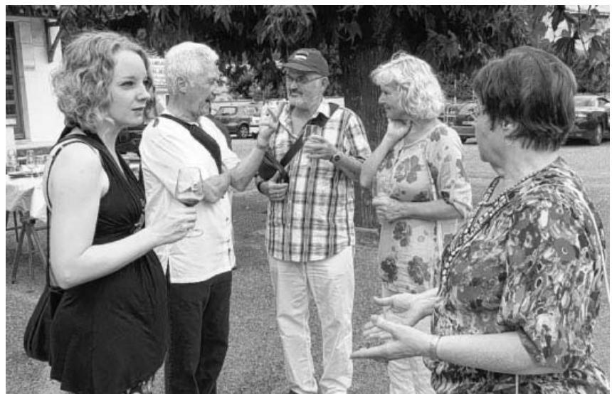
Mit einem Glas Côte du Rhône in der Hand kamen gute Gespräche zustande.

Wir freuen uns auf das Treffen mit Ihnen!