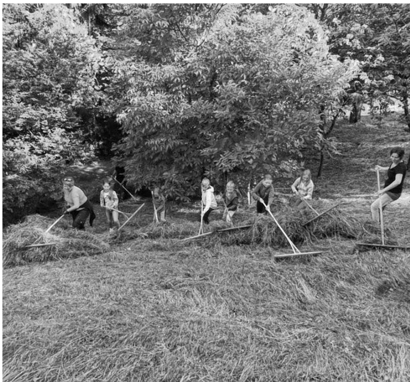
Fleißige Helfer bei der Häfnerhaslacher Pflegemaßnahme.

Schwäb. Albverein e. V. Ortsgruppe Häfnerhaslach