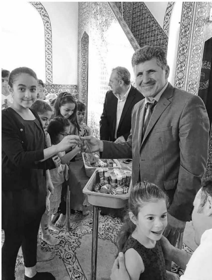
Bei der Geschenkübergabe für die Kinder.

Das Fasten ist die Dritte von fünf Säulen im Islam. Das eigentliche Ziel des Fastens ist, Gottes Anerkennung zu erlangen. Ramadan ist die Zeit der Barmherzigkeit, Besinnung und Vergebung. Am 27. Tag des Ramadans, in der sogenannten Kadr-Nacht, wurden die ersten Koranverse unserem Propheten herabgesandt. Die täglichen gemeinsamen Koranrezitationen und das abendliche Tarâwih-Gebet während der Ramadanzeit bereiten unsere Seelen und unseren Geist auf die bevorstehende unendliche Reise, die Rückkehr zu Ihm, vor.