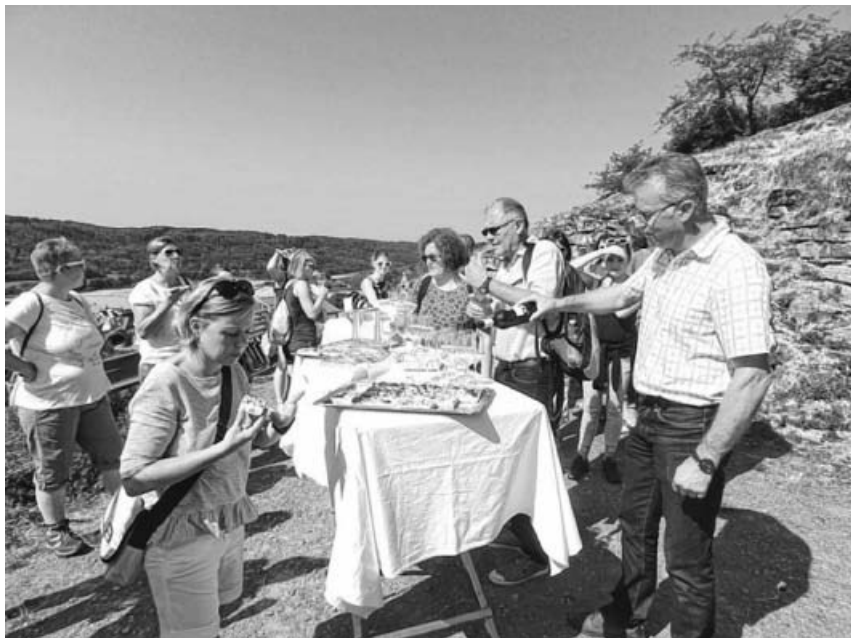
Die Teilnehmer genießen bei einer Weinprobe die imposante Aussicht am Geigersberg.

Hinweis: Das Haus der Senioren ist während der Sommerferien geschlossen!