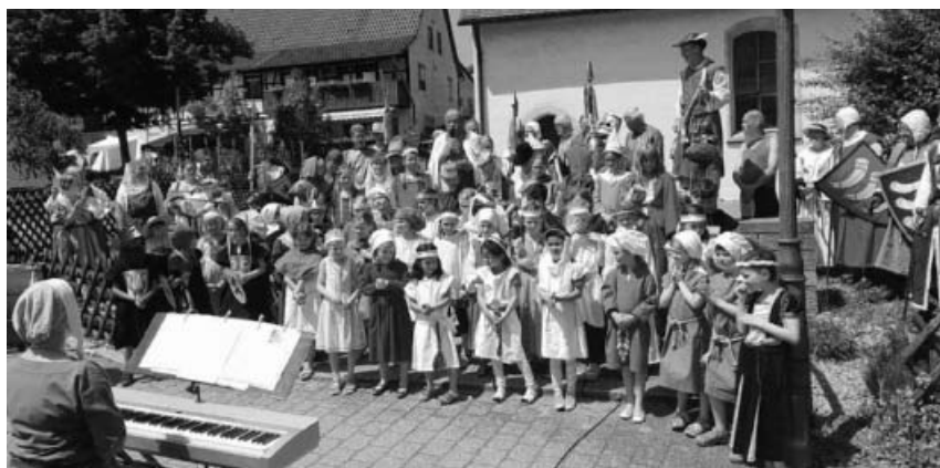
Dorfplatzfest des Liederkranzes Ochsenbach "Die Ritter aus dem Kirbachtal".

Der MVO bedankt sich bei allen Helfern, Gästen und Fans, die zum Erfolg des Dorffests beigetragen haben!