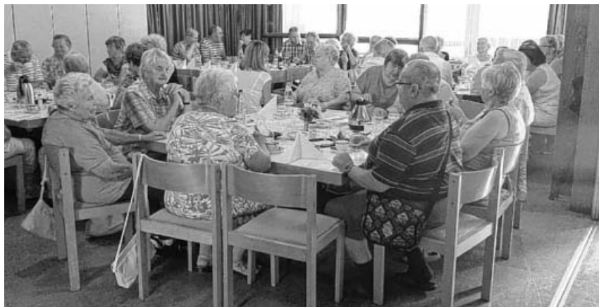
Zahlreiche Gäste beim Sommerfest im Haus der Senioren.

Das Sachsenheimer Hallenbad und die Sauna gehen von Montag 31 Juli