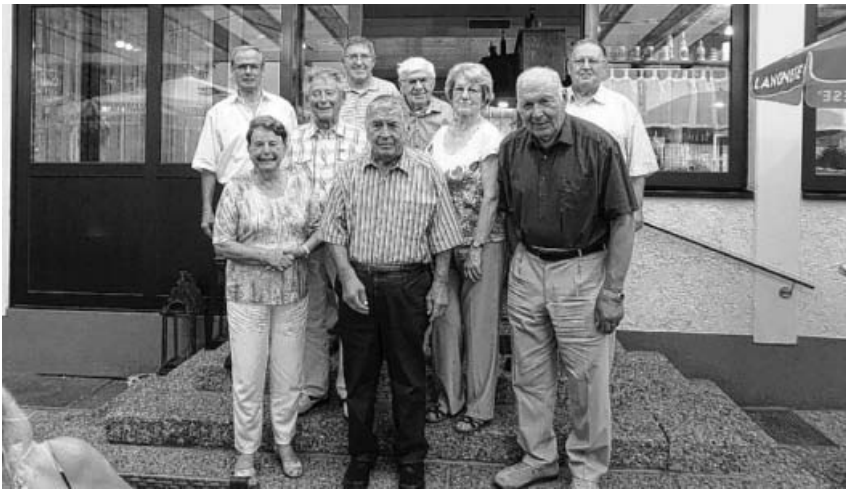
Die anwesenden Geehrten auf der Freitreppe.

teln ab Bönningheim Burgplatz (Bus 554) um 9.27 Uhr, bzw ab Großsachsenheim (Bus 551) um 9.31 Uhr. Weiter dann mit S5 ab Bietigheim und U-Bahn ab Hbf. Siehe auch Nachrichtenblatt 15 vom 21.7.2017. Erste Singstunde nach den Ferien am Freitag, 8. September um 19.45 Uhr in Löchgau.