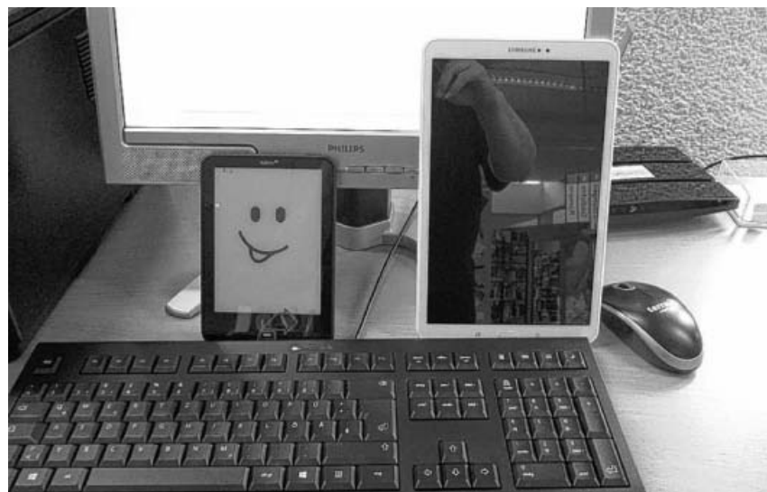
Mögliche Endgeräte für die Onleihe.

ONLEIHE AB HERBST IN SACHSENHEIM MÖGLICH: Die "Onleihe" kommt nach Sachsenheim. Ab dem 10. Oktober können Sie bei uns online entleihen. Sie brauchen lediglich einen gültigen Lese-