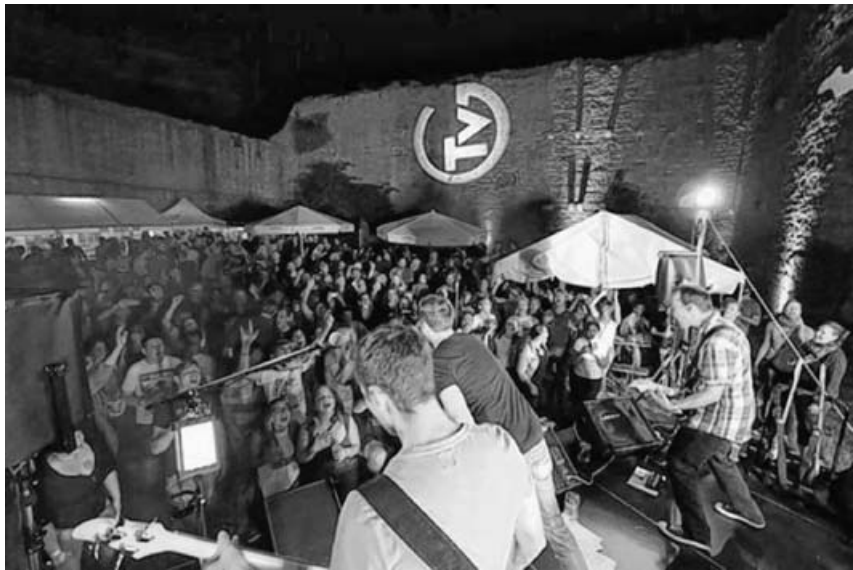
Für ausgezeichnete Stimmung sorgte die Band "rabbit-food".