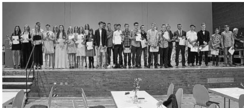
33 Schüler aus den Klassen 9 und 10 verließen in diesem Jahr die Kirbachschule, davon 24 mit einem Mittleren Bildungsabschluss.