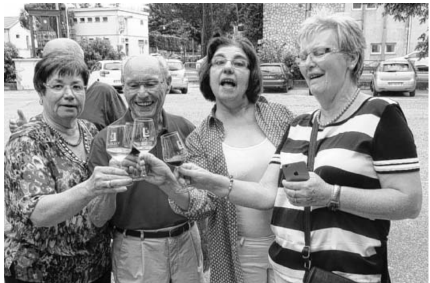
Bei der Weinprobe gab es edle Tropfen und viel Spaß.

Die Bürgerfahrt von Sachsenheim nach Valréas bietet allen immer sehr viel Spaß, nach tollen Begegnungen, Essen und viel Wein fährt man nur sehr ungern wieder heim.