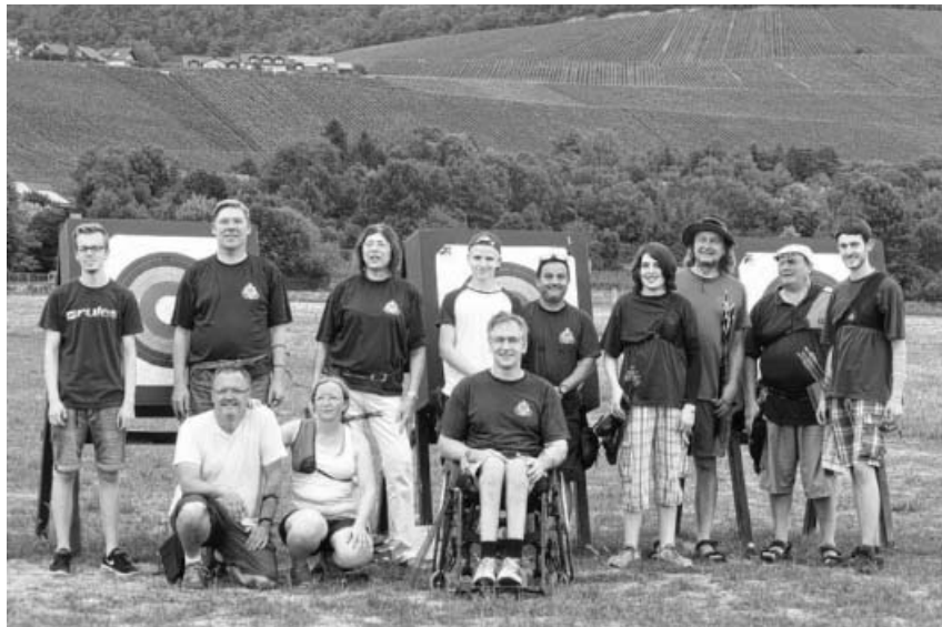
Alle Teilnehmer des Turniers.

Am Sonntag, 6. August bleibt das Schützenhaus geschlossen. Wir treffen uns zum Frühschoppen bei der Freiwilligen Feuerwehr. Der Oberschützenmeister