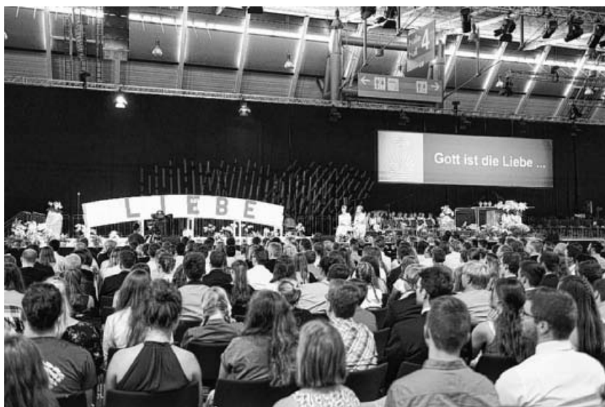
Der Jugendtag stand unter dem Motto „Gott ist die Liebe“.

Motto des Jugendtags – für die jungen Christen ein Highlight im Kirchenjahr – war: „Gott ist die Liebe“. Dazu passte das Bibelwort, das für die Predigt im Gottesdienst Grundlage war: „Lasst uns aber wahrhaftig sein in der Liebe und wachsen in allen Stücken zu dem hin, der das Haupt ist, Christus“. Gefeierte wurde der Festgottesdienst in Halle 4; auf einem Podium stand der festlich