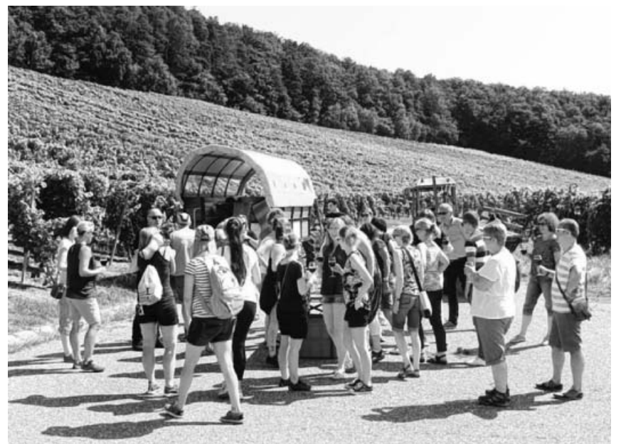
Gemütliche Planwagenfahrt durch die Weinberge in Ochsenbach und Spielberg.