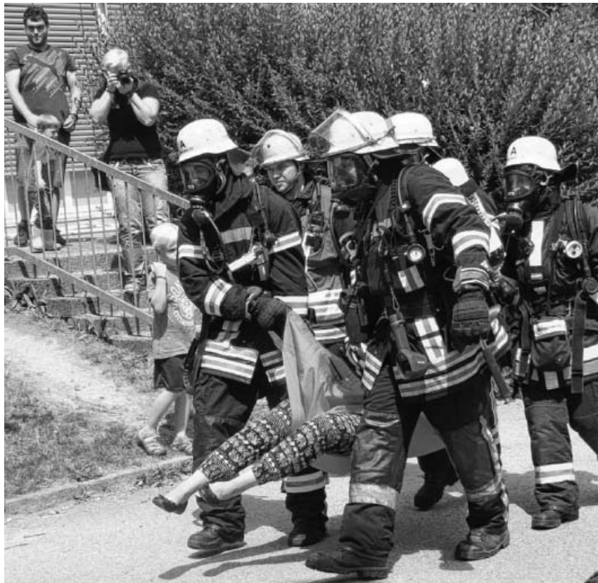
Rettung der bewusstlosen Erzieherin.

Vermissten, Löscharbeiten über das Dach und vieles mehr) nach. Natürlich durften auch die ersten Schaulustigen (allzu neugierige Kinder, die noch näher ans Geschehen wollten) und die Presse nicht fehlen. Nachdem alle „Opfer“ gerettet und medizinisch versorgt waren und die Feuerwehrleute mit einem herzlichen Applaus ein Dankeschön erhielten durfte am Feuerwehrhaus noch ein gemütlicher Ausklang stattfinden. Die Kinder durften spritzen, mit der Seilrutsche fahren, malen, hüpfen, Feuerwehrautos von ganz nahe betrachten und vieles mehr. Mit leuchtenden Kinderaugen und um eine tolle Erfahrung reicher ging dieses Ereignis zu Ende.