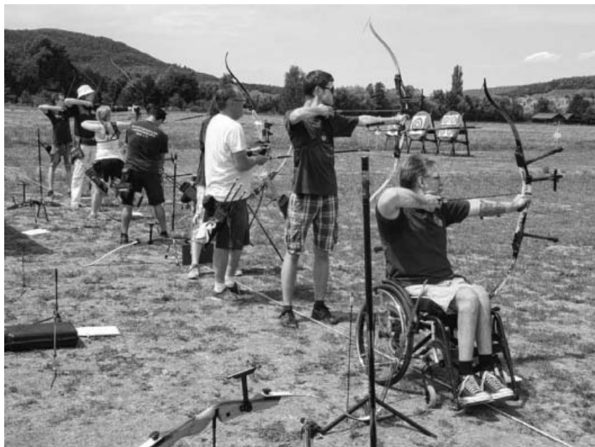
Mitten im Wettkampf.