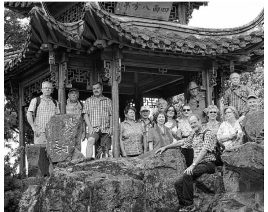
Bei der Stäffelestour 2017.