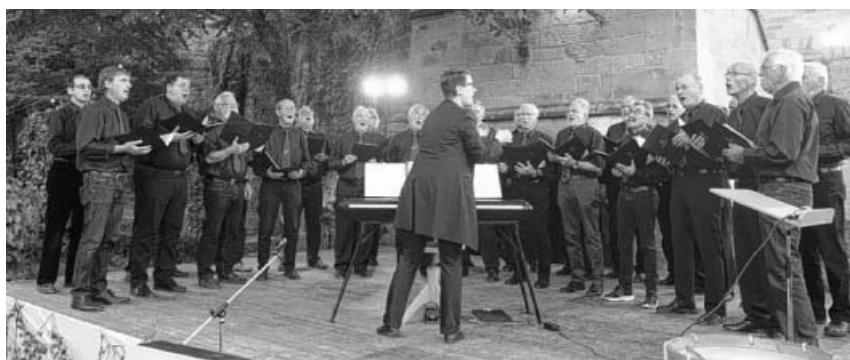
Konzert auf der Burg Neipperg.