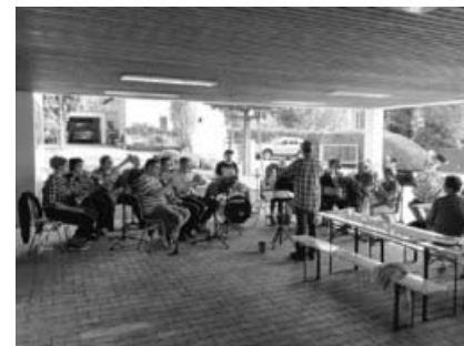
Gemeindefest in Großsachsenheim.