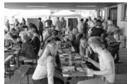
Gemeindefest in Großsachsenheim.

Bei schönstem Spätsommerwetter konnte die Gemeinde Sachsenheim am Sonntag, 24. September, ihr Jahresfest auf dem Kirchengelände an der Goethestraße feiern! Nach dem Gottesdienst am Vormittag, der vom Gemeindechor musikalisch mitgestaltet wurde, gab es ein vielfältiges Essensangebot. Der Posaunenchor