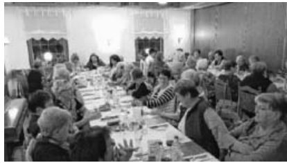
Die Hohenhaslacher Landfrauen beim geselligen Miteinander im Landgasthaus "Rose".

Zum Eröffnungsabend im Gasthaus „Rose“ waren fast 50 Landfrauen gekommen. Das Bedürfnis sich nach der Sommerpause zu unterhalten und auszutauschen war groß, wie die Geräuschkulisse zeigte.