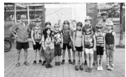
Unsere Radgruppe beim Kinderferienprogramm 2017.

Einen Kommentar dazu verkneifen wir uns lieber.