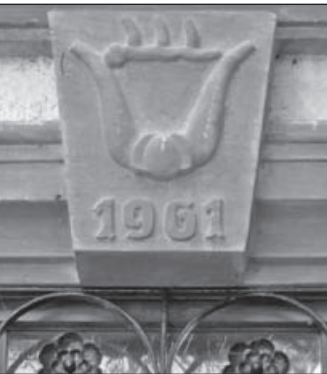
Steinwappen am Türsturz.