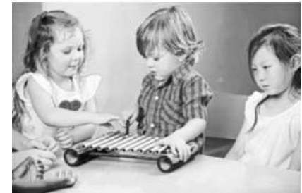
Das Xylophonspielen gehört zur Frühförderung dazu.

Die Schnupperstunde und die weiteren Kurstermine finden jeweils dienstags von 16.30 Uhr bis 17.15 Uhr im Kulturhaus Sachsenheim an der Oberriexinger Straße statt. Wir freuen uns auf Sie und Euch!