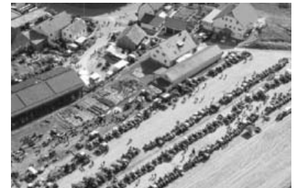
Schleppertreffen in Hohenhaslach.

Vorführung: Historische Geräte, Dreschen wie damals. Sonderschau: Motorsägen in allen Variationen. Für Ihr leibliches Wohl wird bestens gesorgt.