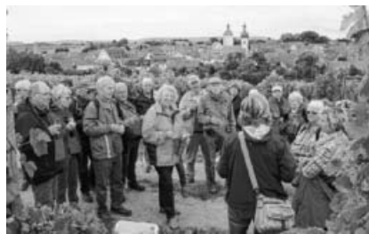
SAV Sachsenheim in Prichsenstadt bei der Weinprobe.

Main, Wein und Geschichte in Franken erlebt. Fast 40 Personen kamen mit zur Ausfahrt. Über die Autobahn ging's mit dem Bus nach Volkach. Dort wartete bereits die „MS Undine“ auf die Sachsenheimer. Rund anderthalb Stunden dauerte die Rundfahrt auf der bekannten Mainschleife. Leichter Regen machte die Landschaft etwas grau, was der Freude aber keinen Abbruch leistete. Nächster Programmpunkt war die Besichtigung der Altstadt von Volkach und das Mittagessen beim dortigen Weinlesefest.