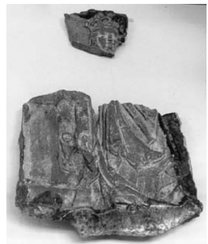
Ofenkachel der Hl. Barbara - ehem. Kloster Baiselsberg.

bens erfahrungen – Schätze des Alters“. Beginn um 14.00 Uhr im ev. Gemeindehaus. Gäste sind uns herzlich willkommen.