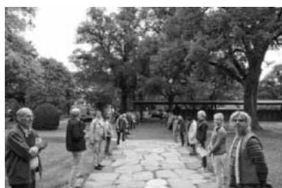
Spalier vor St. Peter.