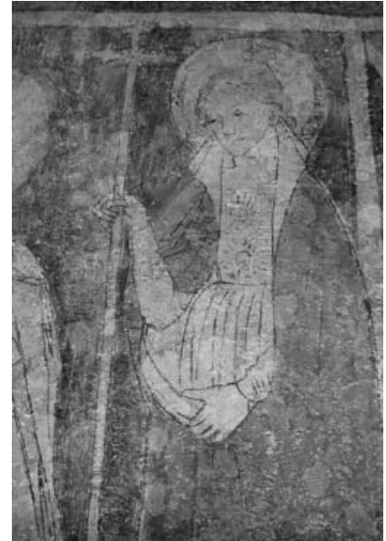
Vorreformatorische Heiligenfresken in der Kirche Ochsenbach.

Gruppeneinlass und -führungen (auch für kleinere Gruppen) sind im Stadtmuseum nach vorheriger Terminabsprache jederzeit möglich.