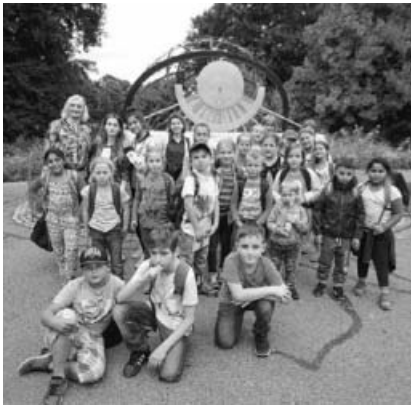
Die Sachsenheimer Zoobesucher.

Insbesondere der schwache Frauenanteil im Gemeinderat macht ihnen Kummer. Noch immer ist Kommunalpolitik Männersache. Obwohl die Frauenquote der Bundesbürger bei rund 51 Prozent liegt, sind die Frauen im Sachsenheimer Rat nur mit 13 Prozent vertreten und liegen damit im Kreisvergleich am Ende der Skala. Das muss sich ändern, meint die Fraktionsvorsitzende. Denn von Frauen sagt man, sie pflegen einen unaufgeregten Politikstil. Fast überall, wo es um Entscheidungen für die eigene Kommune geht, sind Frauen deutlich in der Minderheit. Von 12 Mitgliedern im Technischen Ausschuss ist in Sachsenheim keine Frau. Mit 21 Prozent Frauenanteil können Bietigheim-Bissingen, Löchgau und Sersheim auch nicht glänzen. Mit je vier Rätinnen von 18 Mitgliedern bringen es Besigheim und Bönnigheim auf 22 Prozent.