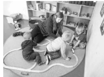
FSJlerin im Alltag mit den Kindern.

Dein Interesse wurde geweckt, mehr Details unter: https://www.sachsenheim.de/website/de/buergerservice-verwaltung/stellenangebote