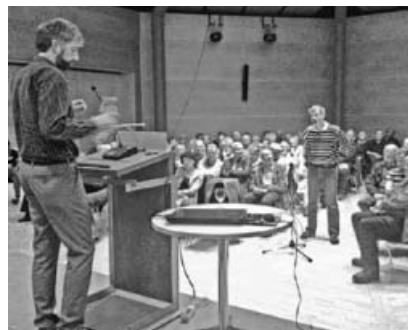
Boris Palmer am 13. September 2017 in Sachsenheim.

wurde nicht veröffentlicht, wohl aber die Ankündigung, dass Catherine Kern, Bundestagskandidatin der Grünen im Wahlkreis Neckar-Zaber, am Freitag, vor der Bundestagswahl unseren Infotisch in der Von-Koenig-Straße besuchen würde.