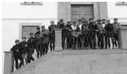
18 TVG-Jedermänner in Rottenburg startbereit für Tag 2 der Radtour.

Die in Rottweil gebliebenen Jedermänner hatten in der Zwischenzeit eine Stadtführung absolviert und viel Interessantes und Wissenswertes erfahren. Nach einer kurzen Stärkung auf dem bunten Rottweiler Wochenmarkt ging es gemeinsam mit dem Rad weiter. Das obere Neckartal mit einem noch schmalen Fluss ist landschaftlich sehr schön. In gleichmäßigem Radeltempo ging es größtenteils am Neckar entlang, aber es gab auch immer wieder Anstiege, so dass etliche Höhenmeter zu bewältigen waren. Nach etwa 25 Kilometern erfolgte in Oberndorf eine Pause. Am frühen Nachmittag wurde dann Horb erreicht. Pünktlich zur geplanten Rast auf dem Gelände der Gartenschau setzte ein Regenschauer ein. Pause und Regenschauer waren vorbei und die letzte Tagesetappe konnte wieder ohne Regen geradelt werden. Am frühen Abend wurden nach 75 bzw. 95 Radelkilometern Rottenburg erreicht, wo übernachtet wurde.