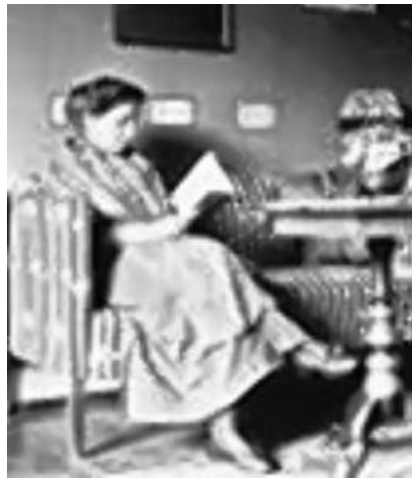
Ellie-Heuss-Knapp – Vortrag bei den Hohenhaslachener Landfrauen.