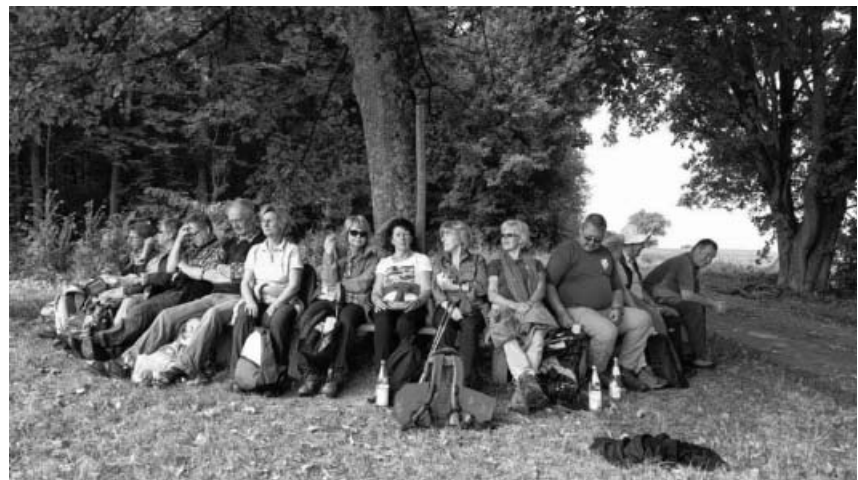
SAV Sachsenheim auf dem Eppinger Linienweg.

Donnerstag, 31.5. bis Sonntag, 3.6.: Wanderfreizeit im Altmühltal bei Beilngries mit Stadtführung, Erlebnis-Treidelfahrt, Schifffahrt und schönen Wanderungen. Ausschreibung folgt. Leitung Familie Teifl-Veigel und Schröter.