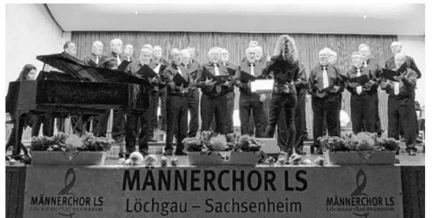
Hier ein Bild von 2016.

Man wollte die früher schon so bekannte Hohenhaslacher Kirbe wieder aufleben lassen. Nachdem die Hohenhaslacher Kirbe jeweils am 3. Sonntag vom Oktober stattfindet, entschloss man sich damals, am Kirbe-Samstag einen Kirbe-Tanz in der damals neuen Hohenhaslacher Kir-