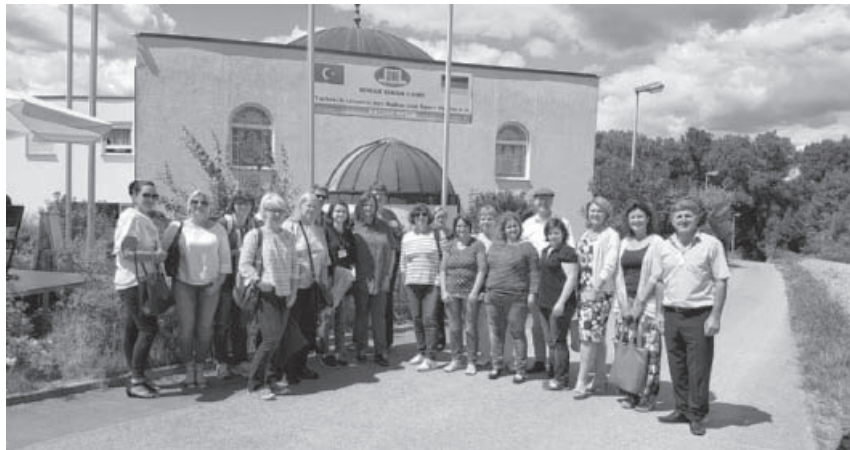
Ausbildungsgruppe vor der Kulturzentrum.