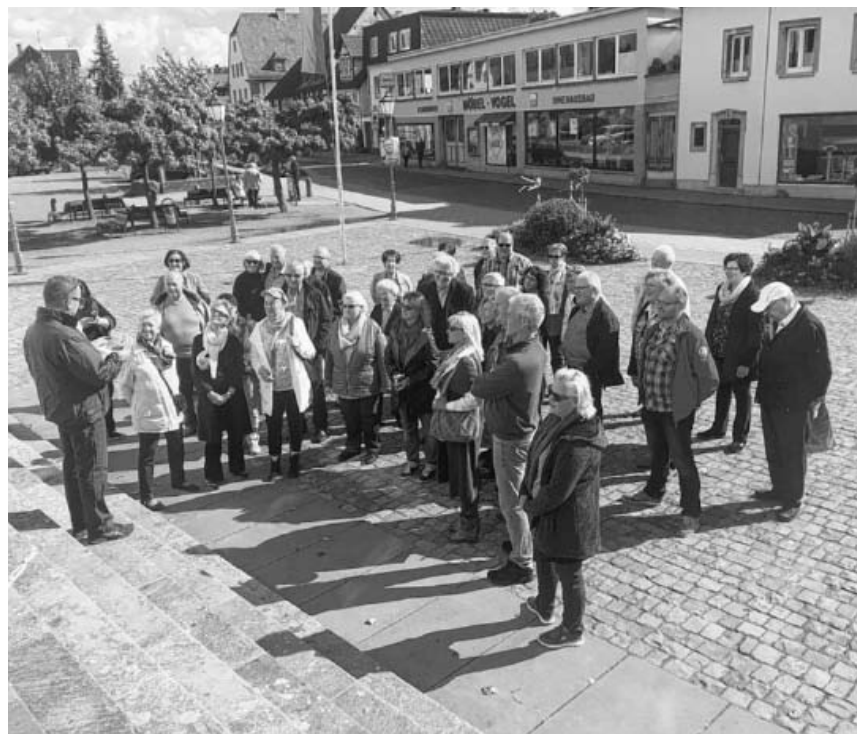
Die Reisegruppe vor dem Schloss in Bad Bergzabern.

Vortragsreihe der Kinderchirurgie für Eltern und Interessierte jeweils am Mittwoch von 17 bis 18 Uhr im Hörsaal (1 UG Kinderklinik) Klinikum Ludwigsburg