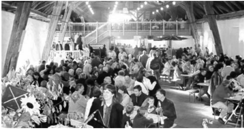
Kirbe in der Hohenhaslacher Kelter.

bachtalhalle zu veranstalten. Diese Veranstaltung war von Beginn an ein voller Erfolg.