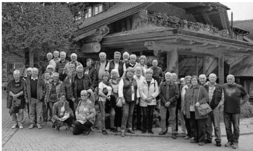
Gruppenbild der Teilnehmer.

bahnparkplatz. Anschließend wurde die Fahrt nach Rust Taubergießen fortgesetzt, wo wir bei schönstem Wetter mit 4 Fischerkähnen eine ca. 2Std. Fahrt in dem Naturschutzgebiet Taubergießen erleben konnten. Die Weiterfahrt ging nun nach Seelbach im Schwarzwald wo wir im Restaurant Schwarzwälderhof das Mittagessen genießen konnten. Nun sollte die Fahrt auf die Burgruine Hohengeroldseck weiter gehen, jedoch wurde diese kleine Wanderung auf Grund des schlechtesten Wetters ausgelassen und wir fuhren über den Schönberg nach Zell am Harmersbach zur Zeller Keramik, wo uns eine etriebsbesichtigung mit äußerst fachkundigem Personal und eine spannende Demonstration der Herstellung von Keramik vermittelt wurde. Danach traten wir die Rückreise nach Kleinsachsenheim an, wo im TSV Heim mit einem Abendessen der Stockschützen-Ausflug beendet wurde.