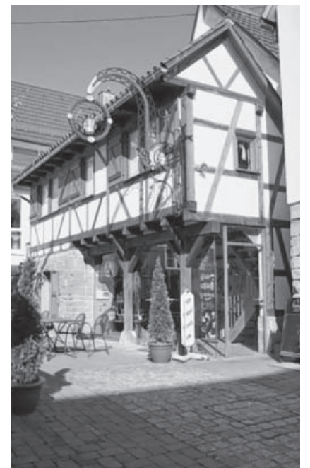
Das Museum „Arzeneyküche“.

Der Eintritt ist frei. Spenden für den Verein für Heimatgeschichte Sachsenheim e.V. sind willkommen.