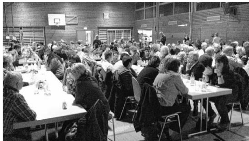
Eine gut gefüllte Kirbachtalhalle.

Sieg erreichten die Großsachsenheimer Jungs gegen den TSV Münchingen mit 1:0. Das anschließende 0:0 gegen die TuS Freiberg reichte, um sich für das Viertelfinale zu qualifizieren. Dort traf man auf die andere Freiburger Mannschaft, den SGV Freiberg. Und gegen den Favoriten konnte man über die ganze Spielzeit gut gegenhalten und musste sich nur knapp durch ein Freistoßtor mit 0:1 geschlagen geben. Insgesamt ist dieser 5. Platz für die D-Junioren ein großer Erfolg!