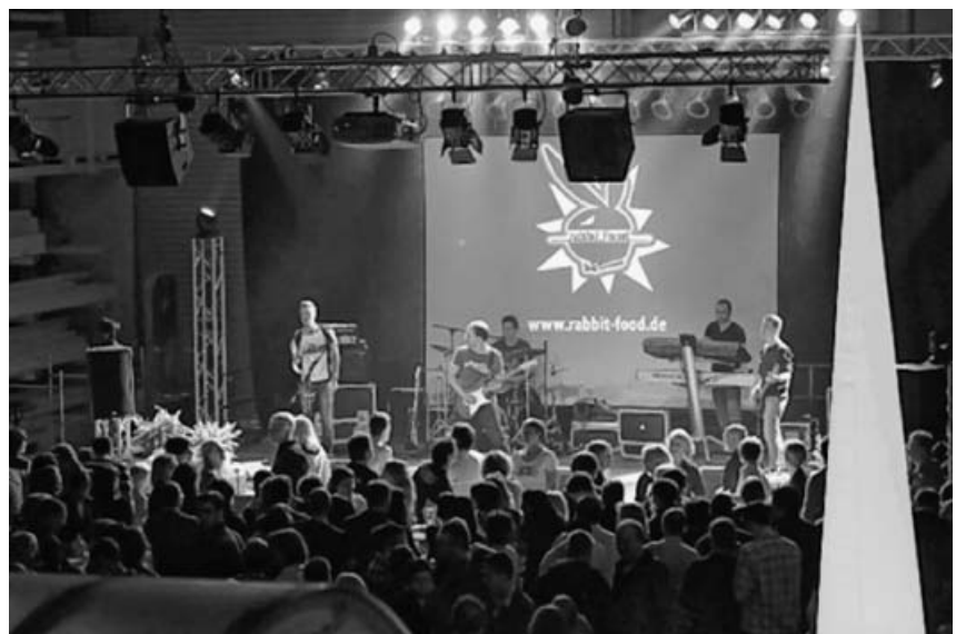
TSV Rocknight 2016.

Für das leibliche Wohl wird bestens gesorgt!