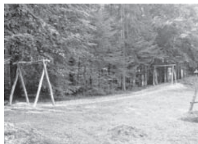
Mit der „Seilbahn“ über die Wiese sausen, steht bei Kindern hoch im Kurs.

dauerhaftem Robinienholz, das keinerlei Imprägnierung benötigt. Mit der neuen Seilbahn können Groß und Klein wieder Geschwindigkeit hautnah erleben. Es macht großen Spaß aufzusitzen, den Fahrtwind zu spüren und gleichzeitig ein gutes Gefühl für das Gleichgewicht zu erhalten.