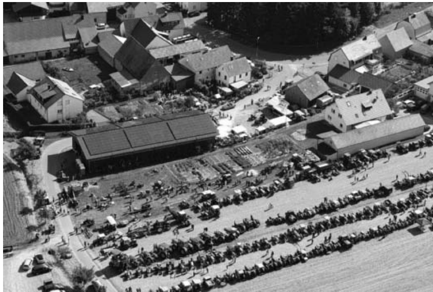
12. Schleppertreffen in Hohenhaslach.

Besonderen Dank auch an unsere Helferinnen und Helfer die alles organisiert, zusammengetragen, restauriert, aufgebaut, zum laufen gebracht, und danach alles wieder abgebaut und aufgeräumt haben.