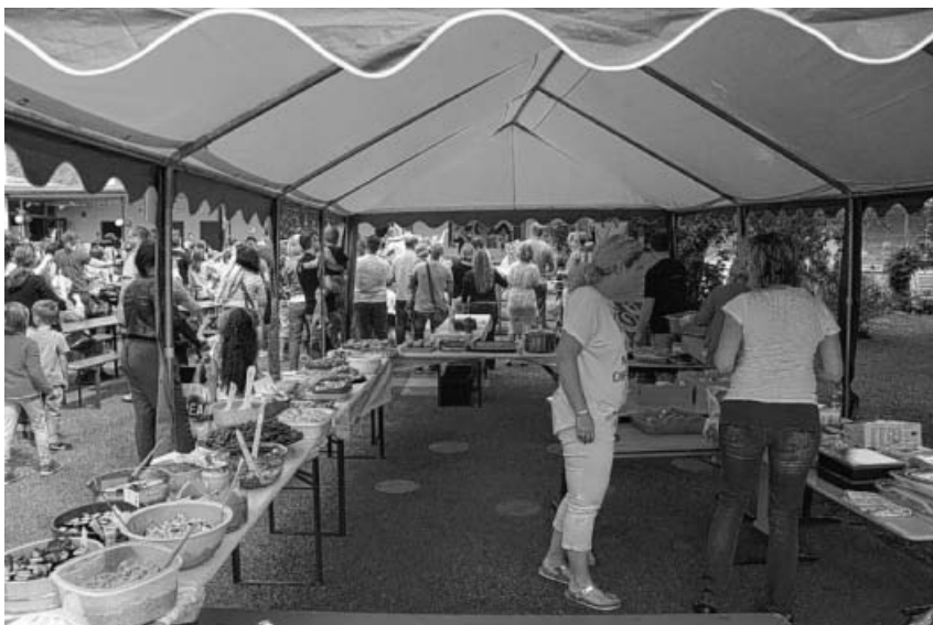
Das internationale Buffet.