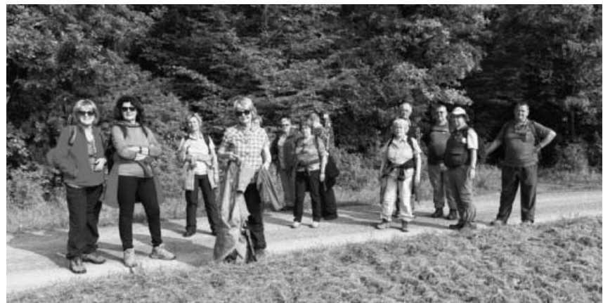
SAV Sachsenheim auf dem Eppinger Linienweg.

Rückblick: Bei herrlichem Herbstwetter fand im September unsere Wanderung von Sternenfels nach Maulbronn statt. Der Wanderweg führte entlang dem Eppinger Linienweg und bot viele interessante Einblicke.