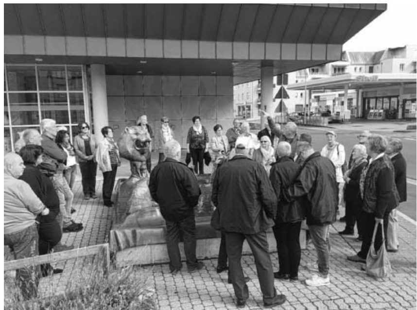
Erklärungen zum Weinbrunnen von Gernot Rumpf.