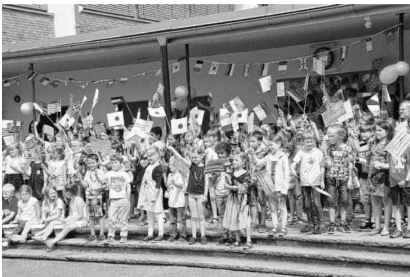
Die Fahnen wehen.

Am 30.09.17 wurden der diesjährige Tagesausflug des 1.SSV Sachsenheim, mit einer kleinen Rundreise und Start in Kleinsachsenheim über Baden Baden, Taubergießen, Hohengeroldseck und Zell am Harmersbach durchgeführt. In Baden-Baden hatten wir traditionsgemäß eine Frühstückspause auf dem Auto-