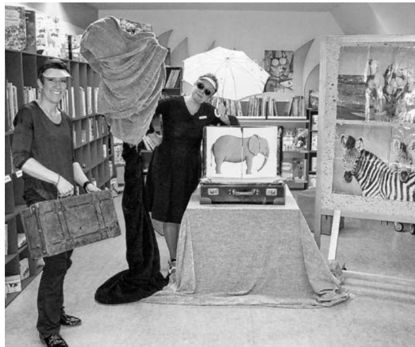
Huhh ist das heiß in Afrika.

Mädchen hüpfen fröhlich mit wippenden, abstehenden Zöpfen durch den Kindergarten, Kinder fangen an falsch zu rechnen und andere Kin-