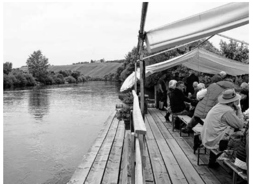
Floßfahrt auf dem Altmain.

Unser Floßführer erklärt uns mit launigen, humorvollen Worten die Besonderheiten der Ortschaften, an denen wir vorbei fahren, Eschendorf, Nordheim, Köhler, Sommerach. Die Namen erinnern uns an bekannte Weinlagen, wie den „Eschendorfer Lump“, das „Nordheimer Vögelein“, den „Sommeracher Katzenkopf“ und einige mehr.