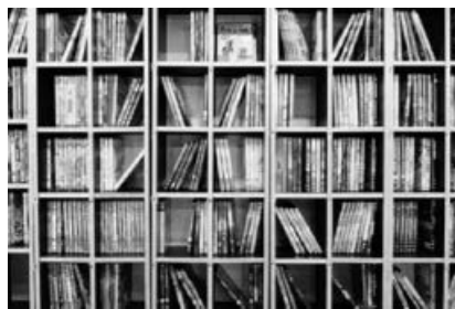
Wir haben 2.800 Filme.

Die Bücherei hat ihr neues bibliothekspädagogisches Angebot der Vorbereitungsklasse Gemeinschaftsschule Sachsenheim vorgestellt. Wir waren in Afrika und ha-