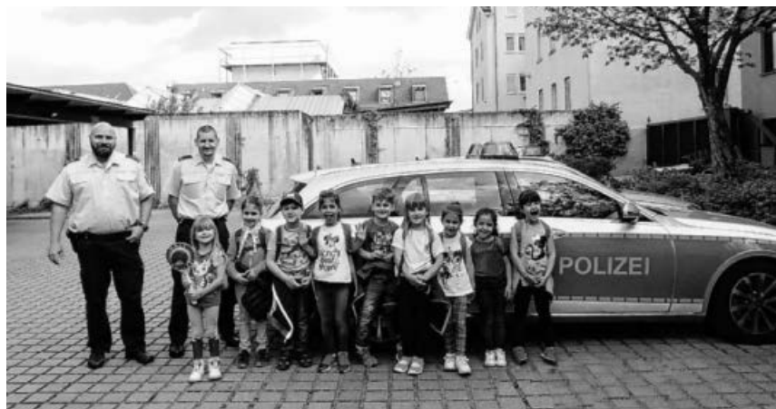
Im Hof der Polizeiwache...im Polizeiauto gibt er viel zu entdecken.