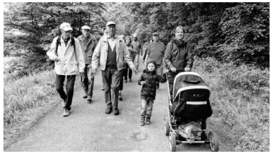
SAV Sachsenheim Wanderung Wachtkopf.

Ausgebucht. Gerne nehmen wir weitere Interessenten in unsere Warteliste auf. Anmeldung bei Fam. Breitweg, Tel. 07147/7960. Abfahrt 8.00 Uhr Bahnhof Großsachsenheim und Neuweilerstr. Kleinsachsenheim. Fahrt nach Durlach zum Turmberg . Dort dann gibt es Brezeln und Kaffee. Schöner Blick vom 28 m hohen Turm und der Terrasse über Karlsruhe, ins Rheintal bis zum Pfälzer Wald und sogar zum Odenwald. (Fernglas mitnehmen). Anschließend Fahrt zum Karlsruher Schloss . Wir umwandern das Schloss in einem kurzen Spaziergang. Am gut bewachten