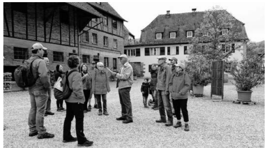
SAV Sachsenheim auf dem Steinbachhof.