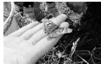
Das Freilassen der Schmetterlinge.