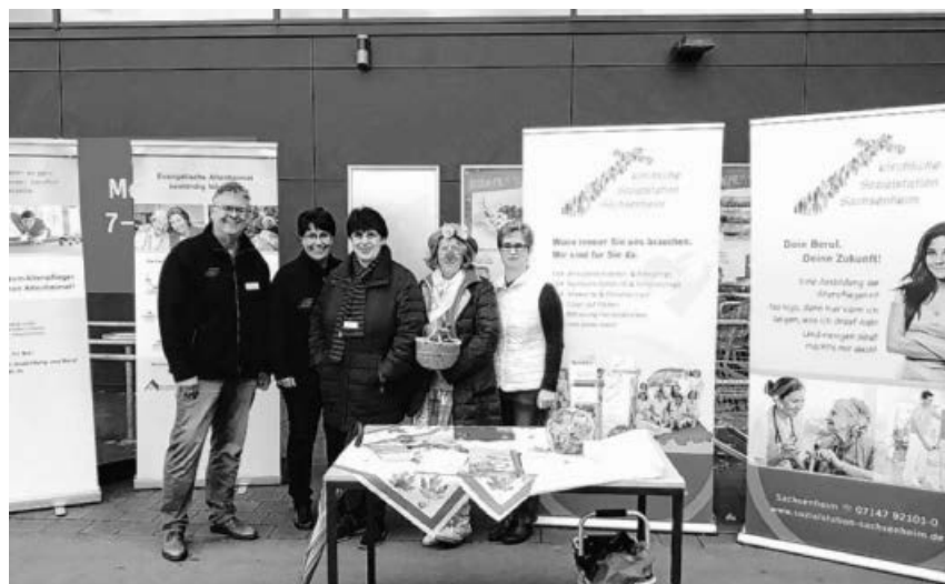
Infostand 2017 der diakonischen Partner vor dem Rewe-Markt.

Haben Sie Fragen zur ambulanten Versorgung in den Seniorenwohnungen oder zu den Leistungen im Pflegeheim? Möchten Sie die Einrichtungsleitungen und einzelne