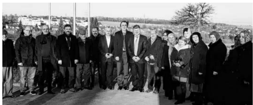
Die neu gewählten Vorstandsmitglieder.