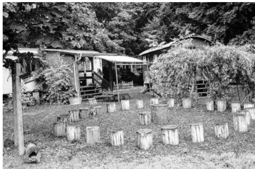
So, in unzerstörtem Zustand, sollten die Kinder ihren Sitzkreis eigentlich vorfinden!

Schauen Sie doch einfach mal herein, der Sachsenheimer Bürgertreff freut sich über Ihr Kommen!