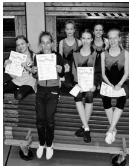
Eine weitere TVG-Mannschaft freut sich über ihren Erfolg.

Die Abteilung Kinder und Jugend des TVG dankt allen Helfern, Kampfrichtern und Eltern, die dabei waren und unterstützten.