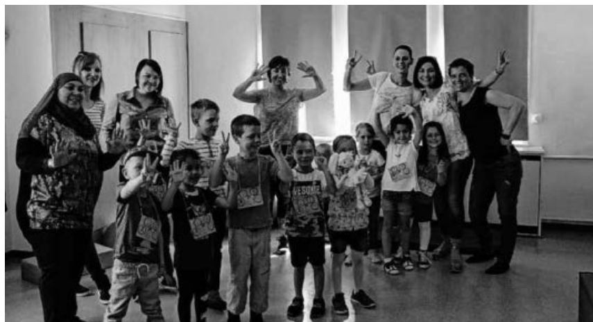
Die Kinder und Eltern hatten viel Spass am Sprachnachmittag.