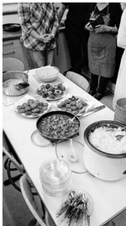
Exotische tamilische Gerichte bei den Hohenhaslacher Landfrauen .

Tamilische Gerichte aus Südindien und Sri Lanka standen kürzlich auf dem Bildungsprogramm der Landfrauen. Gemeinsam mit zwei tamilischen Frauen wurden Hühnchen- und Linsen-Curry, Rasam (Gewürzwasser), Fischbällchen, Linsenvadai und Pajasam zubereitet. Im Anschluss wurden die exotischen Gerichte gemeinsam verkostet. Ein gelungener Abend.