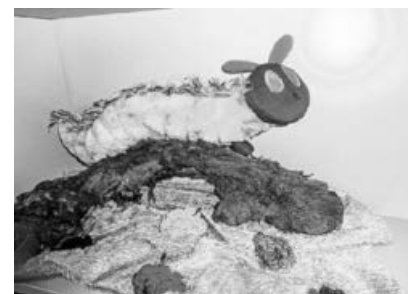
Unsere Raupe „Rudi“.

zu diesem Thema mit den Kindern durch. Dabei besucht uns jeden Tag „Rudi“, die Raupe, in Form eines Kuscheltiers und erzählt uns seine Geschichte: vom Schlüpfen aus dem Ei, seinem großen Hunger und der Verwandlung vom Kokon zum Schmetterling. Durch einen Schmetterlingsgarten haben die Kinder die Möglichkeit die Verwandlung bei echten Raupen mitzuverfolgen und täglich zu beobachten. Darüber hinaus werden verschiedene Aktivitäten mit den Kindern durchgeführt,