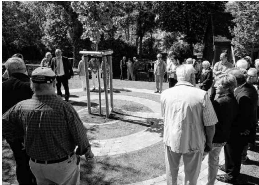
Am neuen Urnengrabfeld.

Die ev. Kirchengemeinde Häfnerhaslach lud zum Gottesdienst mit Dekan Leins i. R. zur Feier des „Tag des Baumes“ auf dem Friedhof in die Aussegnungshalle ein. Musikalisch unterstützt wurde der gut besuchte, festliche Gottesdienst von der Bläsergruppe der Posaunenchoräle aus umliegenden Posaunen und von Albvereinsmitgliedern. Anschließend erfolgte die Pflanzung einer Winter-Linde, am neuen Urnengrabfeld Ortsvorsteher und Albvereins-