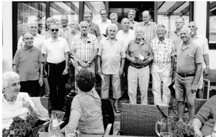
Sie sind herzlich eingeladen, bei diesen fröhlichen Sangesmännern mitzumachen.

Es grüßt sie herzlich der Männerchor LS .