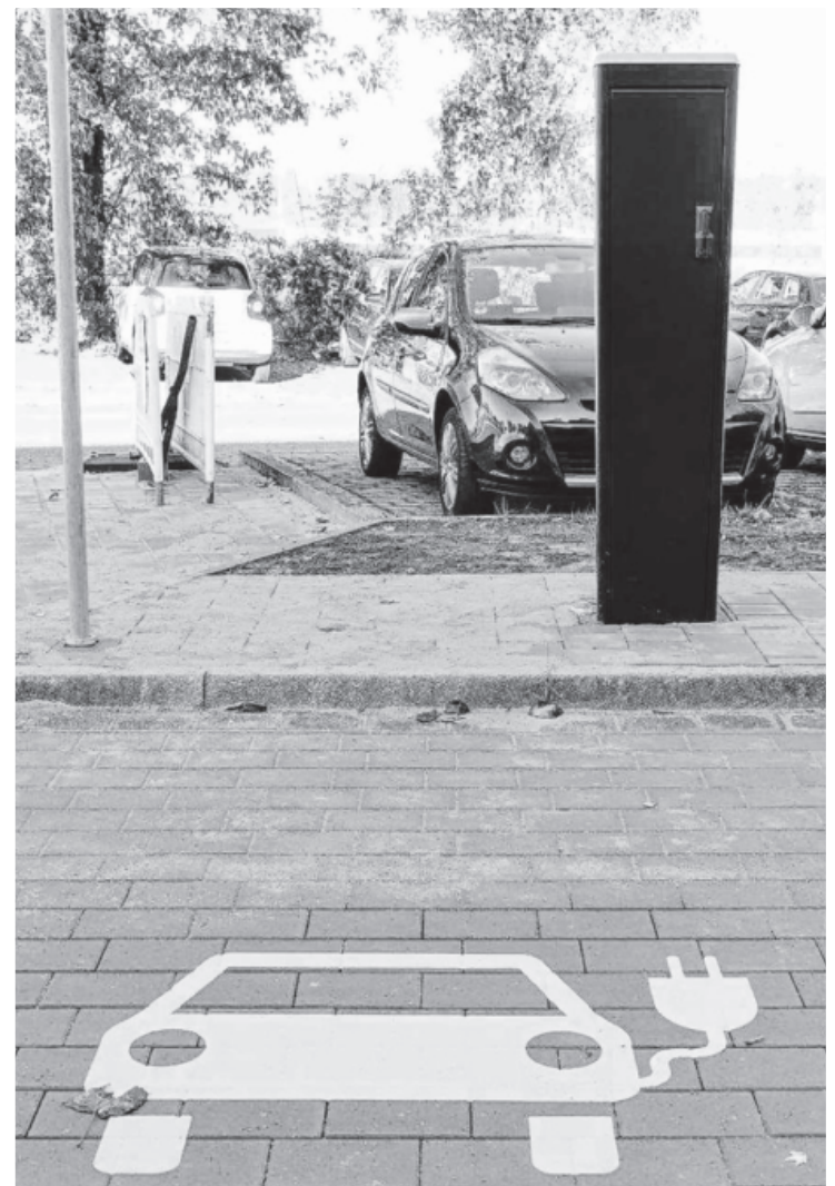
Zwei Elektrotankstellen sind am P&R Parkplatz am Bahnhof für e-Autos eingerichtet worden. Der Betrieb der Ladesäule erfolgt über ein Cloudsystem, die Abrechnung nach Stromverbrauch und Standzeit. Die Stadt möchte Anreize setzen, damit alternative Mobilitätsformen in Sachsenheim genutzt werden können. Die Stromversorgung der Ladesäule erfolgt ausschließlich aus regenerativen Energiequellen und somit 100% Ökostrom. Im kommenden Jahr wird das Angebot um ein e-Carsharing Modell erweitert.