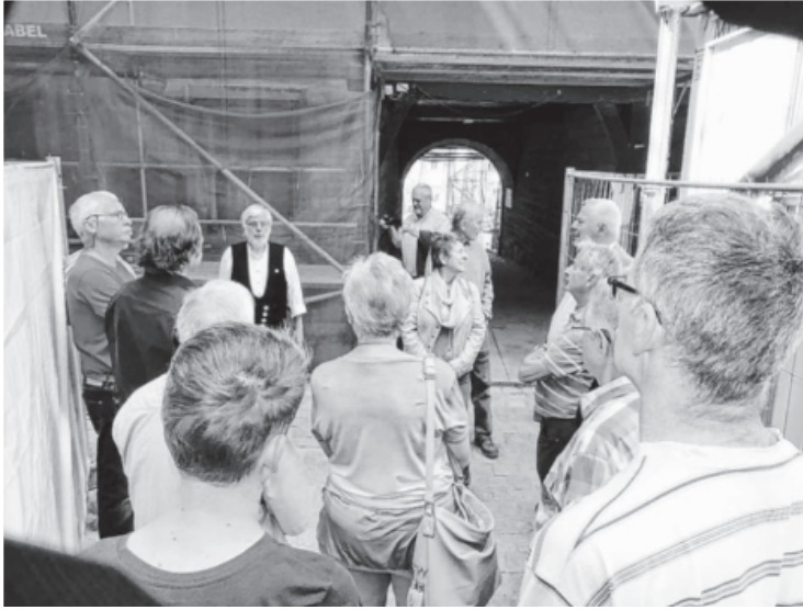
Beim Tag der Städtebauförderung am 5. Mai wurde das Wasser- schloss für die Bevölkerung geöffnet. So konnte sich jeder ein Bild vom Fortgang der aufwändigen Sanierung des Sachsenheimer Wahrzeichens machen.