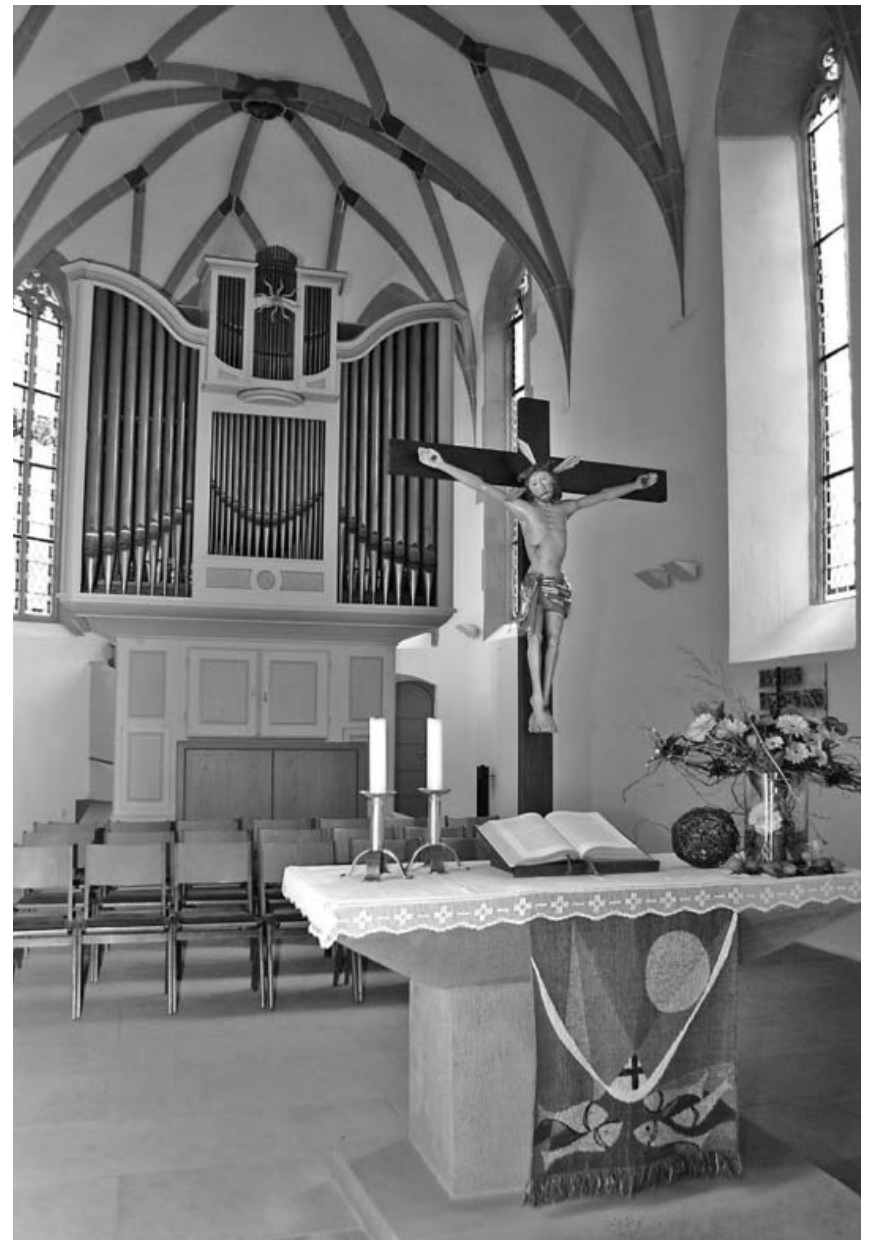
Innenaufnahme der St. Fabiankirche in Sachsenheim.

Weitere Infos unter www.nak-sachsenheim.de