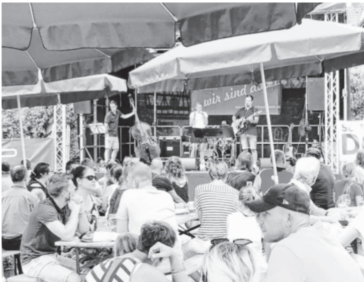
Sachsenheim shoppte und rockte im Juli beim „Sommer am Schloss“. Der Besuch war sehr gut und das abwechslungsreiche Programm begeisterte. Bands spielten, Oldtimer wurden ausgestellt und viele Läden hatten geöffnet.