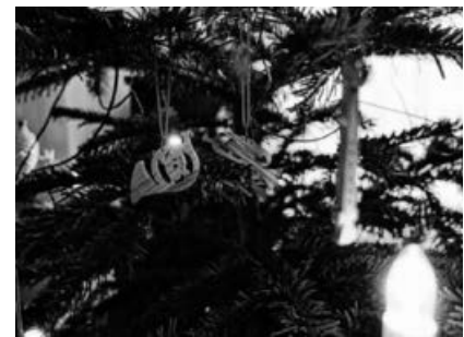
Frohe Weihnachten wünscht der MVS.

Wir freuen uns auf ein neues, musikalisches Jahr 2019 gemeinsam mit Ihnen, Ihr Musikverein Stadtkapelle Sachsenheim e.V.