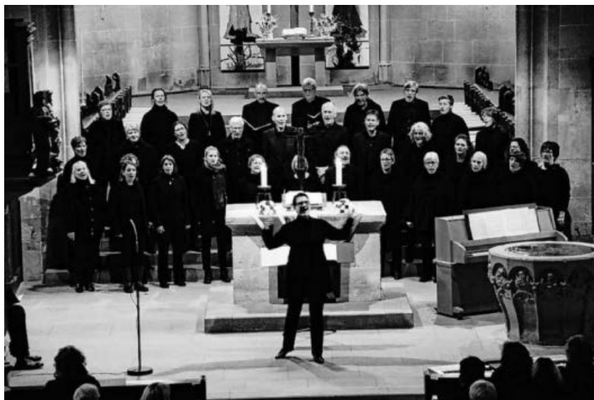
SeelenLicht-Konzert III in Markgröningen.