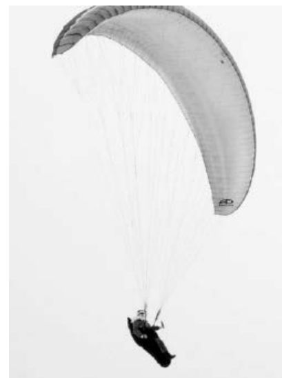
Der Nikolaus im Anflug.

Der Verein der 1. Hohenhaslachener Flieger wünscht allen ein fröhliches und stressfreies Weihnachtsfest.