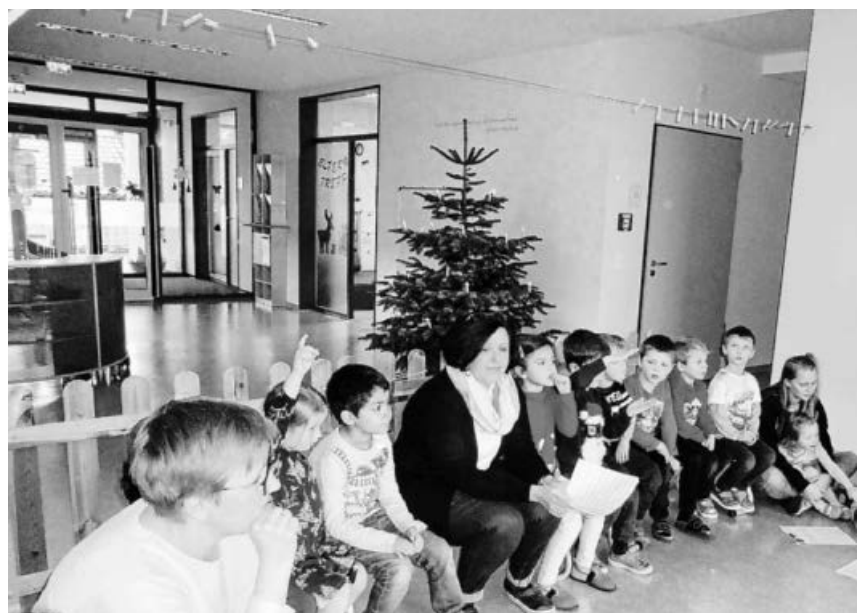
Die Kinder warten gespannt auf den Nikolaus.