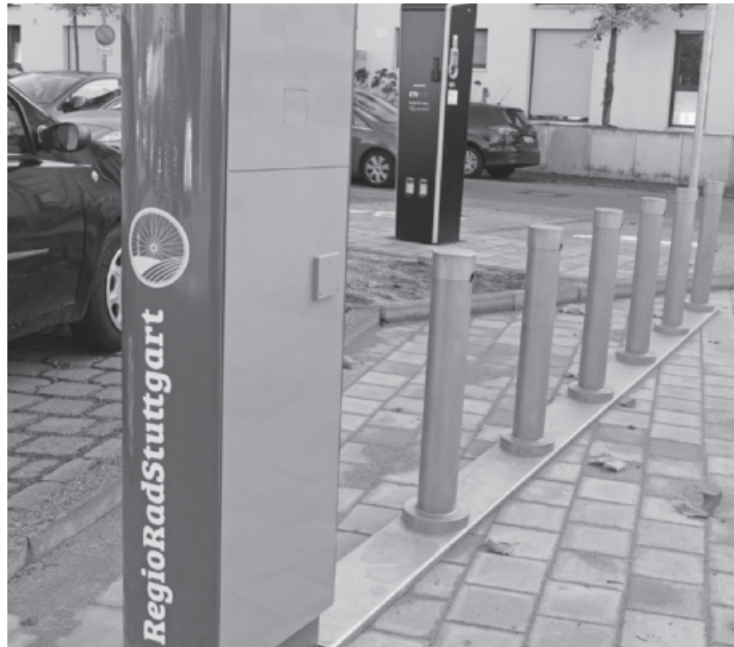
Das Pedelec Verleihsystem RegioRadStuttgart wird es auch in Sachsenheim geben. Direkt bei der e-Tankstelle am Bahnhof werden drei Pedelecs und zwei „normale“ Fahrräder dauerhaft zur Verfügung gestellt. Jeder kann sich ein e-Rad gegen eine geringe Gebühr ausleihen und dieses an vielen Stellen, auch in anderen Orten, wieder abgeben.