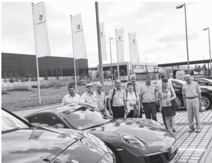
Industrielle aus Valréas besuchten Sachsenheim. Die Firmen Porsche und Zimmerei Pfeiffer boten Einblicke und Informationen in ihr Firmen. Diese Bandbreite beeindruckte die Gäste aus Frankreich.