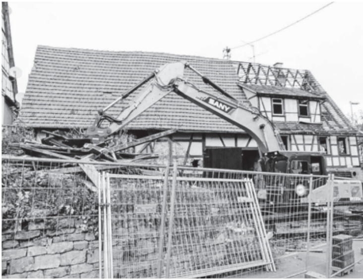
Im Bereich Seepfad/Oberriexinger Straße werden alte Gebäude abgebrochen. Hier entstehen Wohnungen, die zu einem günstigen Preise gemietet werden können. So versucht die Stadt dem Wohnungsnotstand und den überhöhten Preisen entgegen zu wirken. Sicher ist das erst der Anfang dieser Bemühungen.