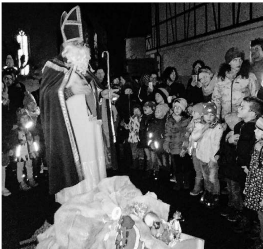
Besuch vom Bischof Nikolaus.

Sei begrüßt lieber Nikolaus, heute warst du im Kinderhaus Pffiffikus!