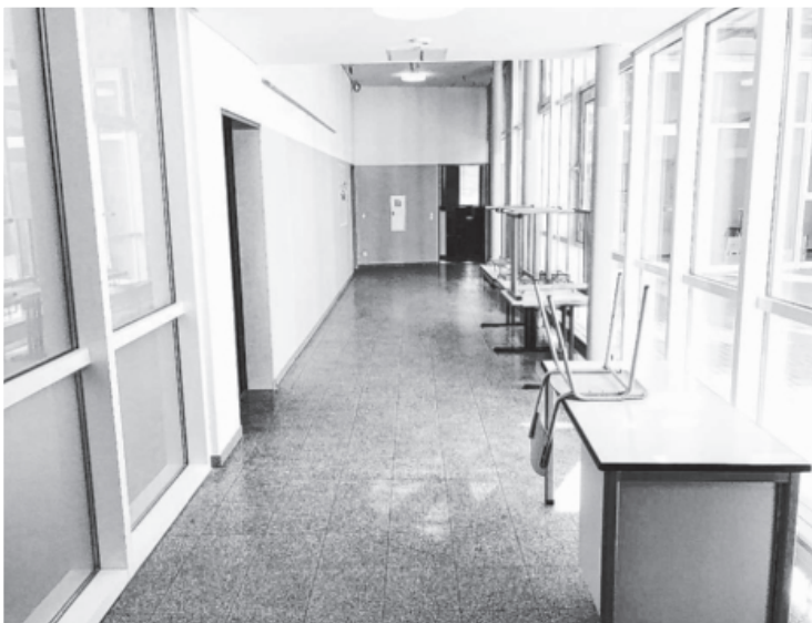
Die aufwändige Sanierung der Gemeinschaftsschule schreitet planmäßig voran. Zu den Sommerferien wurde der erste Bauabschnitt „rund um den Innenhof“ in Bau A fertiggestellt. Jetzt laufen weitere Arbeiten in Bau A, wie der Anbau der Fluchttreppe mit Aufzug und die Sanierung der WC-Anlage. Nach den Faschingsferien beginnen die Sanierungsarbeiten in Bau B.