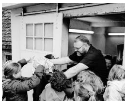
Stolz nehmen die Kinder ihr selbstgebackenes Brot entgegen.

Deshalb war beim Backhausverein Kleinsachsenheim in den vergangenen Wochen auch wieder einiges los. So veranstaltete der BHV zusammen mit dem Förderverein