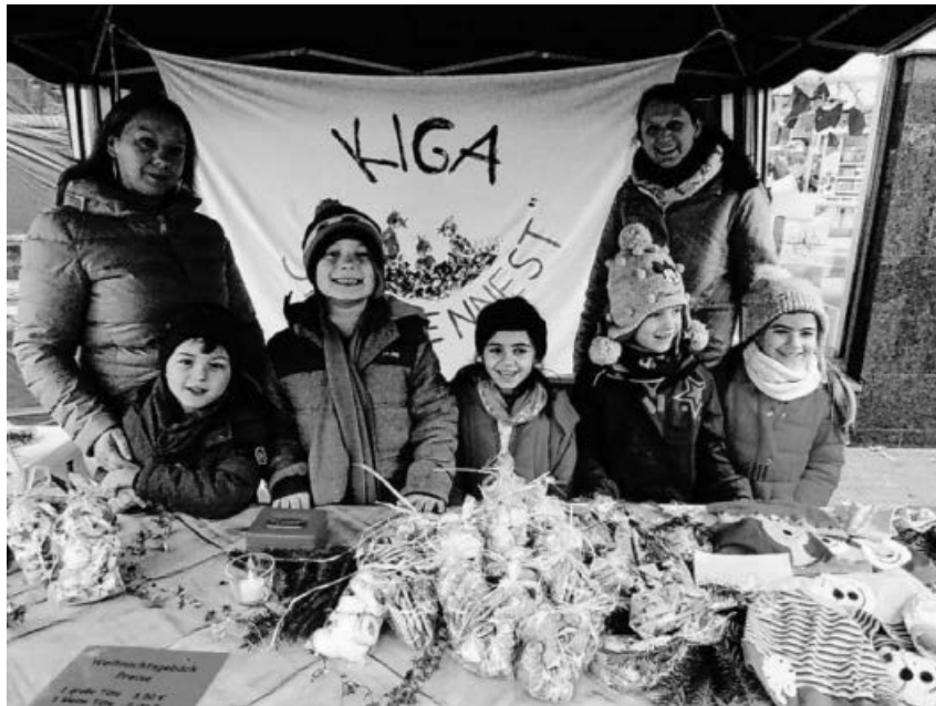
Die Spätzchen verkaufen fleißig.

Am Nikolaustag, den 06. Dezember haben die Erzieherinnen und Kinder des Evangelischen Kindergarten Arche Noah zum Familiengottesdienststabs um 16.30 Uhr in die evangelische Stadtkirche Großsachsenheim eingeladen. Mit stimmungsvollen Liedern zur Adventszeit und dem Lied von dem Mann aus einem fernen Land, erzählten die Kinder was sie alles über den Bischof Nikolaus gelernt hatten. Sie schmückten einen Wandbehang auf dem eine große Mitra abgebildet war mit Schmucksteinen und alle Gottesdienstbesucher bekamen erklärt und gezeigt dass der Bischof Nikolaus für die Menschen da war, er ihre Ängste und Sorgen verstand, sie beschützte und ihnen half und so wie ein Hirte auf seine Schafe aufpasst, er auf die Menschen aufpasste. Bei der Geschichte vom Kornwunder die von Eltern vorgelesen wurde und mit Bildern betrachtet werden konnte erfuhren alle auch noch einmal, dass der Nikolaus die Menschen liebte und dass wird deshalb auch heute noch an ihn denken und ihn ehren als Gabenbringer für die Kinder und Botschafter der frohen Nachricht Gottes. Im Anschluss auf dem Hof des Evangelischen Gemeindehauses bei Punsch und Leckereien die die Eltern zum Büfett mitgebracht hatten konnten sich alle Gottesdienstbesucher und die später dazugekommenen Gäste stärken und auf den Besuch des „echten“ Nikolaus war-