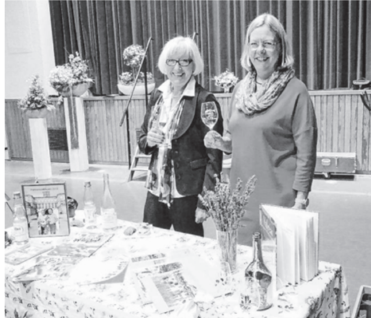
Bei der SKS Jahresfeier präsentierte sich das Partnerschaftskomitee wieder mit einem Informationstisch. Natürlich gab es auch ein Gläschen Valréaser Wein für die Besucher.