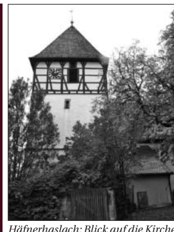
Häfnerhaslach: Blick auf die Kirche.