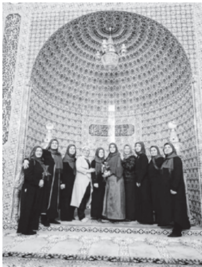
Die Frauengruppe in der Gebetsnische.

Das Programm wurde mit einem Gebet und den leckeren Speise, die zur Verfügung gestellt wurden, beendet.