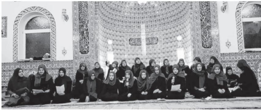
Bei den himmlische Klängen.

pheten wurden durch die Kinder, sowohl auf türkisch als auch auf arabisch, vorgetragen. Im Anschluss dazu wurden Lieder im Chor gesungen, die über das Leben des Propheten gedichtet wurden.