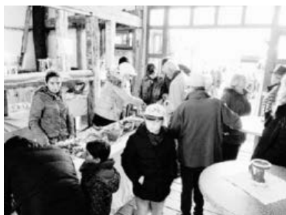
Rege Nachfrage beim Spezialitätenstand.

Leckere Gerichte aus ihren Heimatländern Syrien, Türkei, Kurdistan und Afghanistan boten die in Ochsenbach und Spielberg wohnenden Flüchtlingsfamilien am vergangenen Samstag auf dem Ochsenbacher Weihnachtsmarkt an. Die gesamten Einnahmen in Höhe von 304 Euro spenden die Familien dem Trägerverein Dorfmitte Ochsenbach.