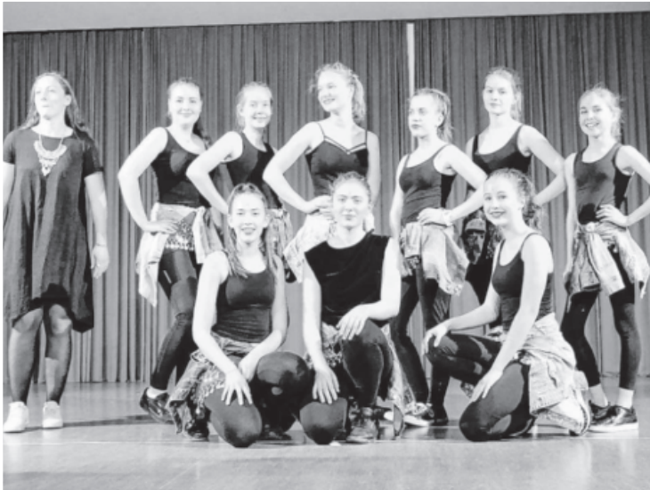
Wie immer gab es ein tolles Rahmenprogramm bei der SKS Jahresfeier. Die Mädels der Hip Hop Gruppe des TV Ochsenbach begeisterten das Publikum mit jugendlich-frischem Elan. Auch die anderen Programmpunkte kamen sehr gut an und wurden beklatscht.