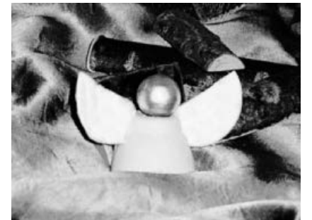
Ein Engel konnte aus Eierschachteln, Wattepads und Glitzer gebastelt werden.

Seit fünf Jahren kam Frau Milde jede Woche zu uns in den Kindergarten und bot ehrenamtlich ein Bastelangebot für die Kinder im Freispiel an. Mit viel Freude und Begeisterung wurde das Angebot immer gerne angenommen. Jede Woche brachte sie eine neue Idee mit in den Kindergarten, auf die die Kinder gespannt waren. Egal ob Fußballspieler, Vögel, Clownsmasken, Blumen, Engel oder Märchen zu denen gebastelt wurde, die Kinder waren immer voll dabei. Auch nachdem Frau Milde ihr Angebot beendet hatte, bastelten einige Kinder selbständig im Freispiel weiter. In einem außerplanmäßigen Überraschungsmorgenkreis verabschiedeten wir Frau Milde und bedankten uns für das jahrelange Engagement. Für die Zukunft wünschen wir Ihr alles Gute.