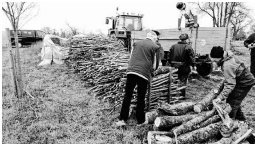
Fleißige Helfer beim Holzstapeln.

Vielen Dank an alle Helfer, die das ganze Jahr unermüdlich Einsatz zeigten sowie an alle fleißigen Bäckerinnen und Bäcker, die den Verein mit Leben erfüllen. Wir wünschen allen ein frohes Weihnachtsfest und einen guten Start ins Neue Jahr!