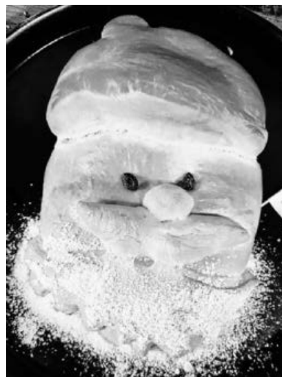
Nikolaus, Nikolaus, siehst so lecker aus!

Vielen Dank an alle Helfer, die das ganze Jahr unermüdlich Einsatz zeigten sowie an alle fleißigen Bäckerinnen und Bäcker, die den Verein mit Leben erfüllen. Wir wünschen allen ein frohes Weihnachtsfest und einen guten Start ins Neue Jahr!