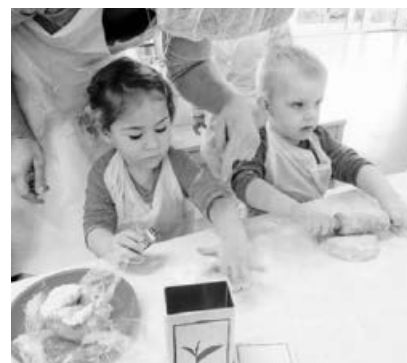
Im Lummerland wird fleißig gebacken.

Innerhalb von zwei Tagen verwandelten jeweils die Krippen- und die Kindergartenkinder, mit fleißigem Einsatz einiger Eltern, das Lummerland in eine duftende Weihnachtsbäckerei. Es wurde fleißig geknetet, Teig ausgerollt und Plätzchen ausgestochen. Das Ergebnis kann sich sehen lassen: Dosen voller Leckereien, welche die Kinder die Vorfriede auf Weihnachten versüßen.