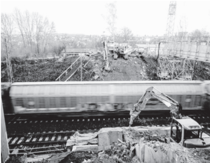
Spektakulär waren der Abbau und Abtransport der alten Eisen- bahnbrücke. Um den Bahnverkehr möglichst wenig zu beeinträch- tigen, wurde die Maßnahme nachts durchgeführt.