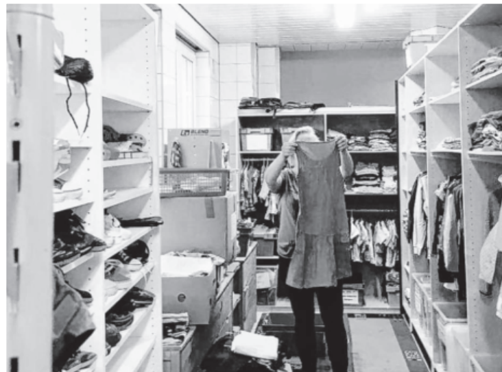
Am 10. April konnte die neue Kleiderkammer in der Grabenstraße 4 bezogen werden. Die Stadt hat die Räumlichkeit für den Asylkreis angemietet. Hier gibt es für Flüchtlinge ein umfangreiches Warenangebot, das von der Bevölkerung gespendet wird.