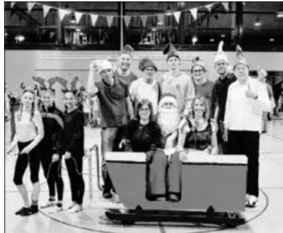
Schneewittchen und seine Helfer.

Wir wünschen Allen schöne, friedliche Feiertage und einen gesunden Rutsch ins neue Jahr und freuen uns auf ein Wiedersehen bei den Übungsstunden des TVG im Jahr 2019.