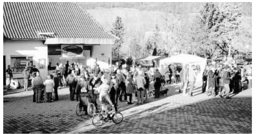
Glühweintreffen Hohenhaslach Kelterplatz.

Die Schlepperfreunde Hohenhaslach laden zum 8. Glühweintreffen am 31.12.2018 von 12.00 – 18.00 Uhr Auf den Kelterplatz in Hohenhaslach ein.