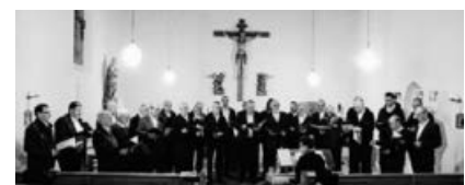
Stellprobe in der katholischen Kirche Ochsenbach.

Mit herzlichen Grüßen und Wünschen, Euer Männerchor Ochsenbach