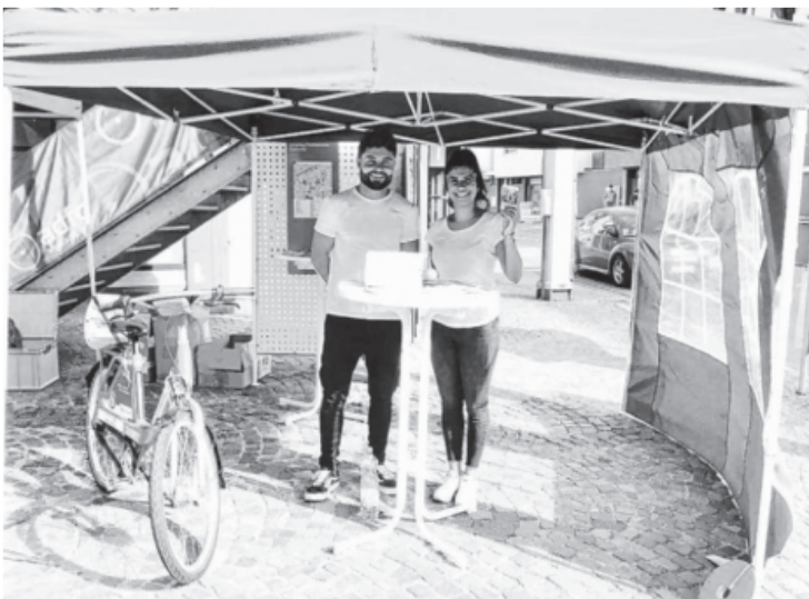
Im Rahmen des Summer Specials bewarb die Deutsche Bahn die Pedelec- und Fahrradstation am Sachsenheimer Bahnhof. Viele Interessierte nutzen die Möglichkeit sich über das neue Angebot in der Stadt zu informieren. Es gab Broschüren und Werbegeschenke für alle Besucher.