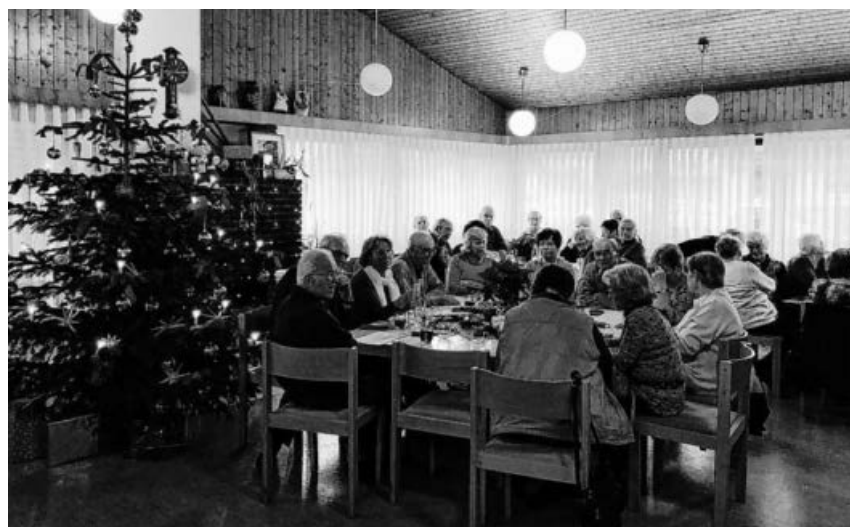
Gut besucht war die Adventsfeier im Haus der Senioren.