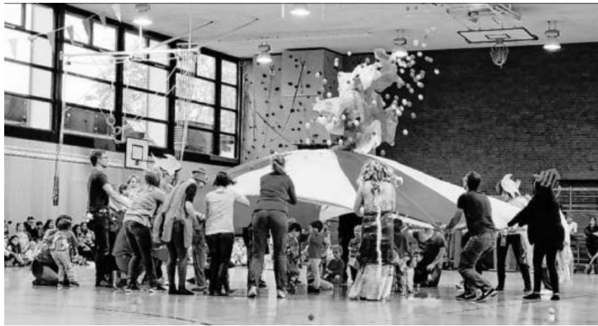
Kleine Turner, große Turner - alle Hand in Hand.

ist keine Selbstverständlichkeit. Die ehrenamtlichen Helfer sind es, die dies möglich machen und an diesem Nachmittag für leuchtende Kinderaugen sorgen.