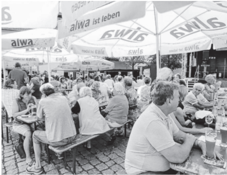
Auf dem Straßenfest herrschte eine sehr heitere und friedliche Stimmung. Das optimale Wetter, das tolle Angebot an Speisen und Getränken, die Unterhaltung sowie die gute Organisation durch die SKS und die Vereine taten ihr Übriges hierzu.