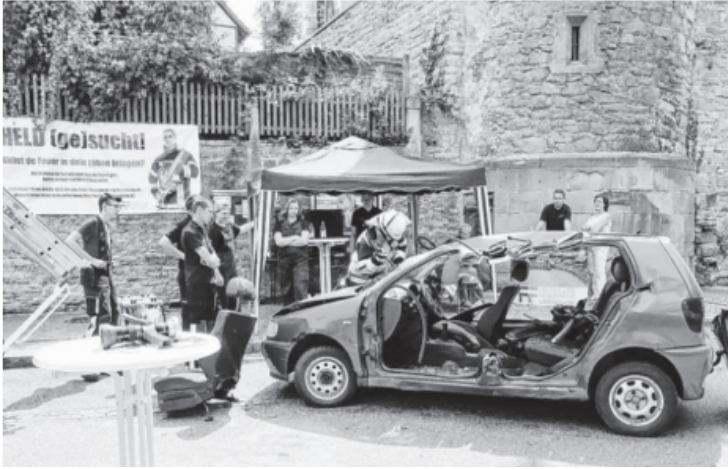
Beim „Sommer am Schloss“ präsentierte sich die Freiwillige Feuerwehr Sachsenheim. Die Besucher konnten sich als Feuerwehrmann- oder -frau versuchen und sich selbst an einem Schrottfahrzeug mit großem Gerät zu schaffen machen. So bekam man einen Eindruck davon, was bei einer Rettungsaktion nach einem Unfall zu tun ist.