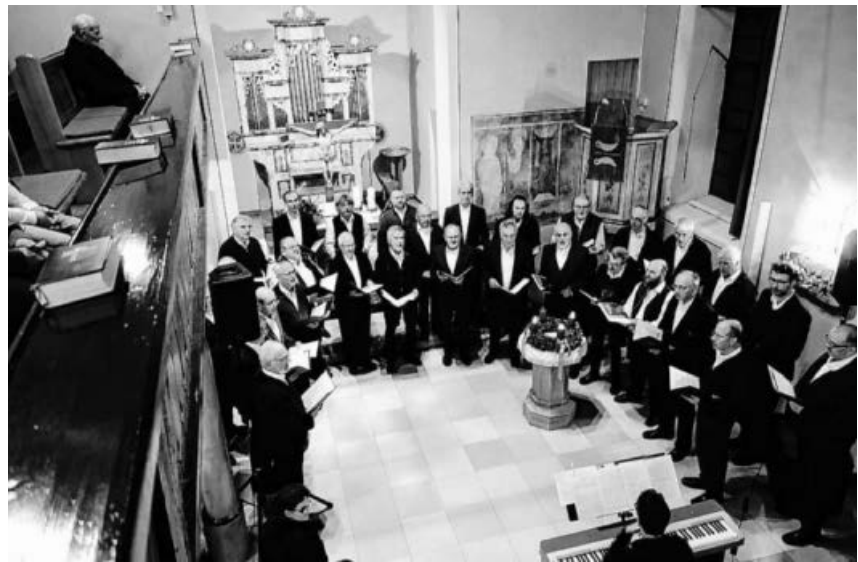
Festlicher Gottesdienst in der Dorfkirche Ochsenbach.