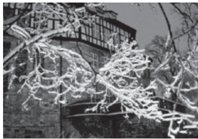
Konzert vor dem Schloss.

Alle, die sich auf Weihnachten einstimmen wollen, sind hierzu herzlich eingeladen.