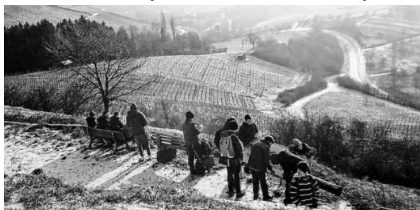
Winterwandertag mit erstem Schnee über dem Kirbachtal.

Wir bedanken uns ganz herzlich bei allen Eltern, Jugendbegleiter*innen, Mitarbeiter*innen, Lesepat*innen