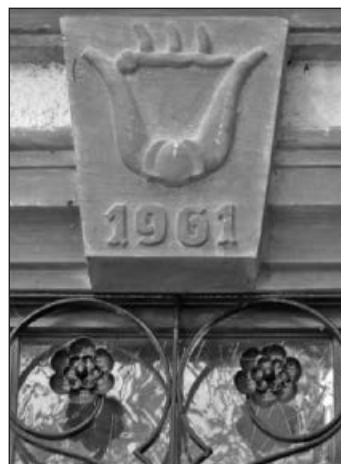
Steinwappen am Türsturz.