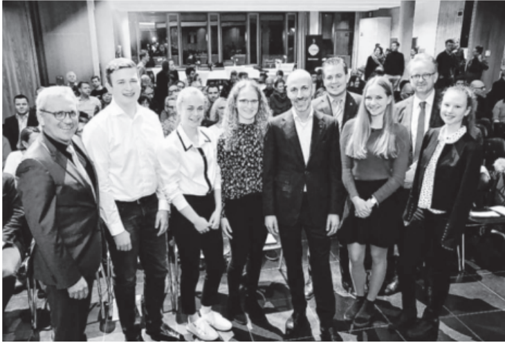
Die Wirtschaftsgespräche sind eine Kooperation der Stadt, des Lichtenstern Gymnasiums und der Sachsenheimer Zeitung. Sie wurden 2004 ins Leben gerufen und werden jährlich durchgeführt. Hier kommen Wirtschaftsfachleute, Schülerinnen und Schüler und Fachpublikum zu interessanten Vorträgen und Austausch zusammen. Die Öffentlichkeit ist immer gern gesehen.