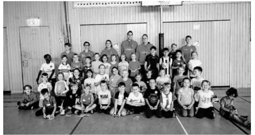
Grundschulaktionstag bei der Gemeinschaftsschule Sachsenheim.

Nach dem Aufbau kamen Punkt 8 Uhr 30 die Zweitklässler in die Sporthalle. Die Klassen wurden in Gruppen aufgeteilt, und es wurden mehrere Stationen aus Koordinationsübungen und Parteballspielen durchlaufen. Die vier Trainer des HC Metter Enz wurden von drei Jugend-