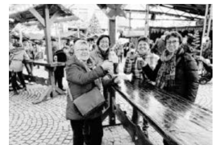
Hohenhaslacher Landfrauen in bester Glühwein-Laune.

Im Dezember fuhren die Landfrauen nach Bruchsal auf den Weihnachtsmarkt . In kleinen Gruppen waren sie an den schön beleuchteten Buden und auch in der Innenstadt unterwegs. Gestärkt durch Rote Wurst, Glühwein und was Süßes, spazierten die Frauen beschwingt zum Bus zurück. Mitch Axom brachte die Gruppe wohlbehalten nach Hohenhaslach zurück. Es war wie immer ein schönes Beisammensein.