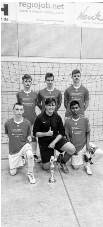
Die siegreichen B-Junioren mit dem Pokal.

In Oedheim, einer Gemeinde im Landkreis Heilbronn, fand letzten Samstag ein Hallenturnier der B-Junioren statt. Die Großsachsenheimer Jungs hatten einen ausgesprochen guten Tag erwisch und konnten alle sieben Spiele gewinnen. Besonders beim 5:1 gegen die SGM Neuenstadt und beim 4:0 gegen eine der beiden Heimmannschaften konnten die Großsachsenheimer Jungs auch spielerisch überzeugen. Nachdem der Aufstieg in die Leistungsstaffel in der Feldrunde ganz knapp verpasst wurde, können die Jungs auf dieser Leistung aufbauen und Selbstvertrauen tanken. Ein großes Kompliment auch an die beiden Trainer Thorsten und Pino, die die Jungs hervorragend eingestellt haben.