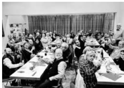
Gemütlicher Start ins Neue Jahr.

Ihnen und Euch nochmals alles Liebe, Schöne und Gute für ein gesundes, glückliches und zufriedenes 2019. Wir sind mit einem gemütlichen Wildessen in das neue Jahr gestartet. Unser Wirtschaftsteam mit Küchenchef Fritz hat uns und die Sängerinnen köstlich bewirtet, dazu gab es ausgewählte gute Tropfen aus Ochsenbach.