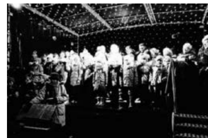
Einfach Singen auf der Weihnachtsbühne.

Viele Sternstunden im neuen Jahr wünscht das OrgaTeam & alle Sängerinnen und Sängern des Projekts EINFACH SINGEN