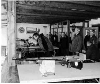
Jagd auf den Drei-König-Adler.

Beisammensein wurden die abgetrennten Teile ihren Gewinnern übergeben und man ließ den Tag gemeinsam ausklingen.