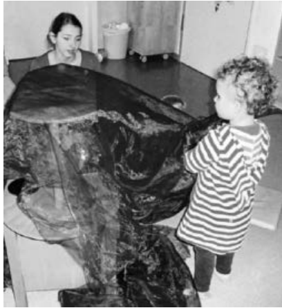
Was versteckt sich unter dem roten Tuch?

Zu Jahresende haben wir in der Krippe 2 ein neues Möbelstück bekommen. Alle Kinder waren im Morgenkreis auf die Überraschung gespannt, die sich unter dem roten Tuch versteckte. Ein paar Kinder halfen mit auszupacken und siehe da: eine neue Spielküche kam hervor. Die Augen waren groß und die Freude aller zu spüren. Natürlich wurde die neue Küche direkt ausprobiert. Es wurden Kuchen gebacken, Kaffee serviert, Mittagessen gekocht und auch alles stets probiert. Die Mahlzeiten waren köstlich. Mit dem Pinzettengriff wurde der Löffel festgehalten und kräftig in der Schüssel gerührt.