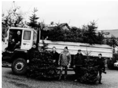
Eines der beiden Sammelteams mit einer Fuhre alter Bäume.

Am Samstag, den 12. Januar sammelten die Motorradfreunde Hohenhaslach Christbäume für einen guten Zweck in Hohenhaslach ein. Gegen eine „Spende“ von 2€ wurden ausgediente Christbäume eingesammelt und entsorgt. Der Erlös und die getätigten Spenden betragen mehr als 600€ und wurden dem Förderverein der Kleeblatt-Pflegeheime übergeben.