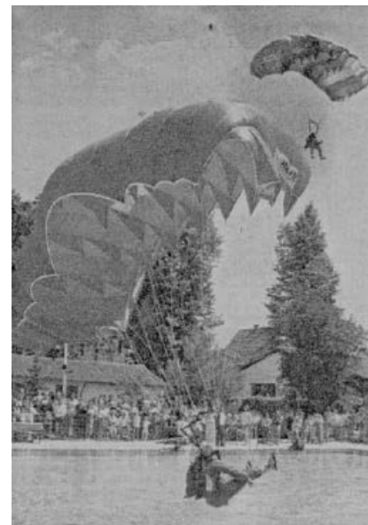
Bilderserie 1990: Fallschirmspringer landet im Freibad.

Nachdem die Saison 2004 unter der neuen Trägerschaft organisatorisch und verwaltungstechnisch gemeistert wurde, konzentrierte sich der Verein in der Saison 2005 und 2006 auf die Erhöhung der Badekomforts und der Attraktivität des Freibades. Neben dem weiteren Ausbau des angebotenen Sportprogrammes und der Vereinsaktivitäten, wie Sonntagsfrühstück, Stammtisch, Wanderwochenenden u.s.w. wurde vor allem auch in die bauliche Substanz investiert.