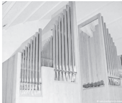
Orgelprospekt in der neuapostolischen Kirche Horrheim.