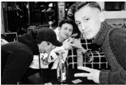
„Zocker des Monats“ im Januar.

Nach dem personellen Wechsel im Frühsommer hatte sich das Jugendhaus-Team wieder schnell neu aufgestellt, so dass der offene Betrieb ungehindert weiterlaufen und viele neue Ideen umgesetzt werden konnten: