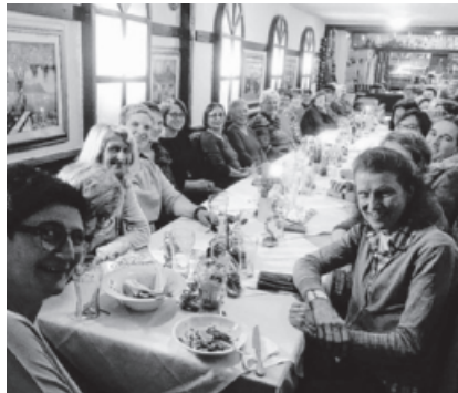
Gymnastikgruppe der Hohenhaslacher Landfrauen - Weihnachtessen in der Pizzeria "Ochsen".

Die letzte Aktion des vergangenen Jahres war der Brotverkauf am Adventsmärktele . Die Bevölkerung nahm das Angebot von frischem Bauernbrot, Hefezopf und Apfelbrot aus den Händen der Landfrauen gerne an. So mancher Besucher schaute auch in das Backhaus hinein. Hier war es wieder ein gutes Miteinander und die erfahrenen Landfrauen hatten nach dem Verkauf Backhaus und Garagen schnell wieder in den Originalzustand gebracht. Allen Helfern und Helferinnen ein herzliches DANKE.