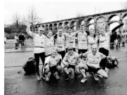
Ein Teil des Laufteams...

Am 31. Silvesterlauf 2018 in Bietigheim-Bissingen startete erstmalig ein Team des CVJM Hohenhaslach mit 15 Läufer/innen. Der Älteste und der Jüngste unserer Laufgruppe erzielten die Bestzeiten in unserer Gruppe und lieferten damit den Beweis, dass es beim Laufen kein „zu Alt“ und kein „zu Jung“ gibt.