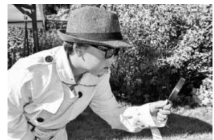
Als Detektiv im Museum unterwegs!

- Taschenlampenführungen auch für private Kinder- oder Erwachsenengruppen möglich -