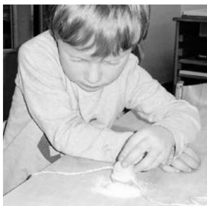
D. experimentiert mit Eiswürfel.

In dieser kalten Jahreszeit hält man sich aber gerne auch in den kuschelig warmen Räumen auf. Die Kinder lauschen Geschichten vom Winter, von Schnee und Eis, gerne werden beispielsweise Schneemänner aus Klorollen, Papptellern oder Knöpfen gebastelt, Pinguine ausgeschnitten oder Schneeflocken beklebt. Experimente mit Eis haben sich die Kinder gewünscht und waren schließlich hochmotiviert am Forschen und Entdecken. Viele weitere Angebote und Erlebnisse zu dieser Jahreszeit - egal ob draußen oder drinnen - warten noch auf die Kinder. Für die ältesten Kinder steht der Ausflug in die Eishalle zum Schlittschuh laufen bereits vor der Tür.