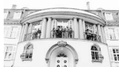
Lernen in schöner Architektur - das Aufbaugymnasium lädt ein zum Tag der offenen Tür.

Wir verwirklichen diesen Anspruch durch zwei Schulen unter einem Dach: ein Ganztagesgymnasium ab Klasse 5 und ein dreijähriges Aufbaugymnasium (ABG) für Mädchen (mit mittlerer Reife). Am Samstag, 19. Januar öffnen wir unsere Türen ab 10 Uhr für Schülerinnen und ihre Familien, die sich über das Aufbaugymnasium informieren wollen. Unser ABG zeichnet sich aus durch eine hohe Unterrichtsqualität aufgrund einer kleinen Eingangsklasse 11 (ca. 17 Schülerinnen) und individueller Förderung (verstärkter Unterricht in den Kernfächern, Studienzeiten, Lernateliers). Dadurch erreichen wir eine hohe Versetzungsquote ins Kurssystem. Den beruflichen Gymnasien vergleichbar bieten wir Französisch als zweite Fremdsprache für Anfängerinnen an. Bereits nach der zwölften Klasse erwerben Schülerinnen die schulischen Anforderungen für die Fachhochschulreife.