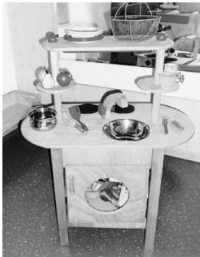
Die neue Spielküche.

Zu Jahresende haben wir in der Krippe 2 ein neues Möbelstück bekommen. Alle Kinder waren im Morgenkreis auf die Überraschung gespannt, die sich unter dem roten Tuch versteckte. Ein paar Kinder halfen mit auszupacken und siehe da: eine neue Spielküche kam hervor. Die Augen waren groß und die Freude aller zu spüren. Natürlich wurde die neue Küche direkt ausprobiert. Es wurden Kuchen gebacken, Kaffee serviert, Mittagessen gekocht und auch alles stets probiert. Die Mahlzeiten waren köstlich. Mit dem Pinzettengriff wurde der Löffel festgehalten und kräftig in der Schüssel gerührt.