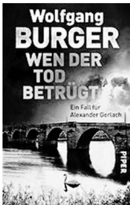
Der neueste Fall von Kommissar Gerlach!