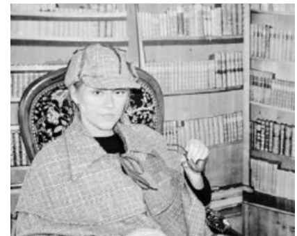
Sherlock Holmes persönlich wird die Besucher begrüßen!

Kostenbeitrag: 3 € pro Erwachsener, Kinder bis 18 Jahren frei. Voranmeldung nicht erforderlich.