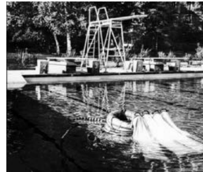
Bilderserie 1953: Auffangpumpe Schwimmbad.

Aus einer Gruppe engagierte Sachsenheimer Bürger heraus bildete sich ein Trägerverein zur Erhaltung und Betreibung des Sachsenheimer Schlossfreibades. Die Alternative wäre die drohende Schließung des Schwimmbades gewesen. Die Schließung konnte Gott sei Dank abgewendet werden.