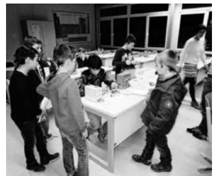
Einblicke in die Arbeit im Naturwissenschaftsraum.

Im Rahmen eines „Tages der offenen Werkrealschule“ stellt sich die Sekundarstufe der Kirbachschule am Donnerstag, den 7.2.19, um 17 Uhr , vor. Vor allem Viertklässlerinnen, Viertklässler und ihre Eltern können sich ein Bild davon machen, wie die Schülerinnen und Schüler in Hohenhaslach erfolgreich lernen. Aber auch alle anderen Interessierten sind herzlich willkommen! Auch wenn die Gemeinschaftsschule, die Werkrealschule und die Realschule nach demselben Bildungsplan arbeiten, hat doch jede Schule ihr eigenes Profil. Als eine von drei Alternativen für Schüler aus dem Kirbachtal (und teilweise auch aus den umliegenden Gemeinden), die gleichwertig zur mittleren Reife führen, bekennt sich die Kirbachschule klar zum dualen System und hat ihre Stärken in Sachen praxisbezogener Berufsorientierung. Des Weiteren spielen das sportliche und das musikalische Profil eine wichtige Rolle. Um zum Wohle der Kinder die richtige Entscheidung treffen zu können, empfiehlt sich der Besuch der in Frage kommenden Schulen.