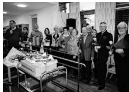
Dank an Gesangsensemble tonART09.