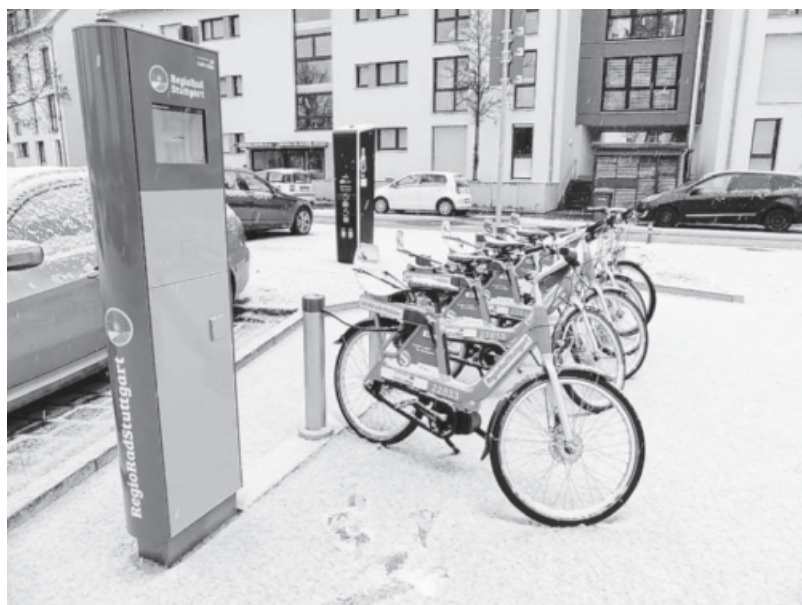
RegioRadStuttgart-Station am Sachsenheimer Bahnhof.

Pressestelle, Tel.: 0711/641-2451, pressestelle@stala.bwl.de Fachliche Rückfragen: Tel. (0711) 641-2513 oder -2523, mikrozensus@stala.bwl.de