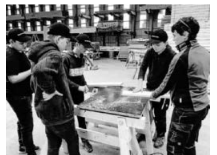
Praktisches Arbeiten, wie hier beim Bau einer "Friedenstreppe", spielt eine wichtige Rolle.