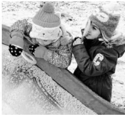
L. und J. erforschen den Schnee.

Draußen ist es kalt und vom Himmel fallen weiße, dicke Schneeflocken, die die Welt in eine bezaubernde weiße Winterlandschaft verwandeln. Alles sieht anders aus und die Kinder sind begeistert von dem Schnee und Eis, mit dem man so faszinierende Dinge machen kann. Einen „Schneesturm“ haben die Kinder bereits miterlebt, lustige Schneeballschlachten mit kleinen, aber auch riesigen Schneebällen veranstaltet und im Rollenspiel aus Eis und Schnee Essen gekocht. Der Schnee wird mit allen Sinnen erforscht, Schneeflocken werden versucht mit dem Mund zu fangen, Kugeln werden geformt und die Eiskristalle im Schnee mit einer Lupe genauer untersucht.