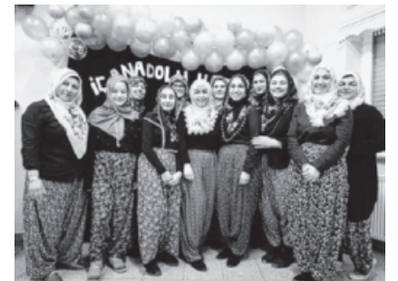
Die Mädchengruppe mit traditionellen Kleidern.