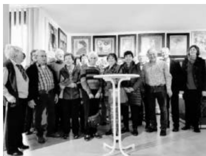
Die Teilnehmer im Kujau-Museum.

Bei einem gemütlichen Beisammensitzen bei Kaffee und Kuchen ließen die Teilnehmer den Nachmittag schließlich ausklingen.