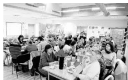
Nach getaner Arbeit Kaffee und Kuchen so viel man essen kann.