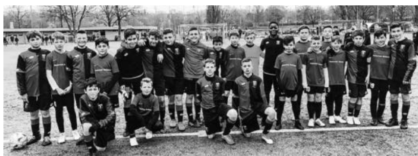
Die Sachsenheimer Jungs mit dem FC Genua.