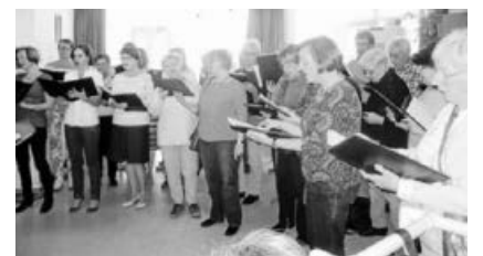
Vocalensemble Stromberg im Kleeblattheim.