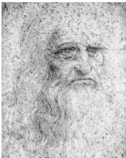
Selbstportrait Leonardo da Vinci.

Im Jahr 2019 jährt sich der 500. Todestag von Leonardo da Vinci (1452-1519). Nach einer dreiwöchigen Umbauphase wird im Stadtmuseum Sachsenheim dazu passend eine Leonardo da Vinci-Ausstellung eröffnet. Die Ausstellung thematisiert Leben und Werk des bekannten Künstlers und zeigt aus zahlreiche Schülerarbeiten aus allen Sachsenheimer Schulen. Interaktive Stationen runden das Ausstellungserlebnis ab.