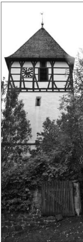
Häfnerhaslach: Blick auf die Kirche.