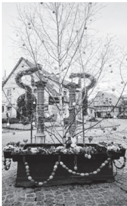
Unser schöner Osterbrunnen.....

Gemeinsam mit Eltern, Verwandten, den Landfrauen des Ortes und geladenen Gästen trafen sich am 05.04.2019 alle am Brunnen im Ort. Zu dem kleinen Programm, welches die Kinder mit Ihren Erzieherinnen vorbereitet hatten, gehörte das Gedicht vom „Hase mit dem blauen Ohr und natürlich das Lied vom „Osterhäschchen komm doch bald.....“.