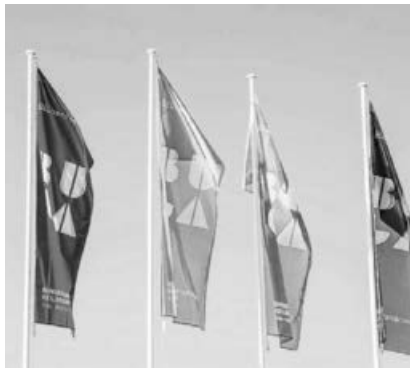
Auf der BUGA in Heilbronn engagieren sich die Kirchen unter dem Motto »Leben schmecken«.

Weitere Infos unter www.nak.org und unter www.nac.today wie auch unter www.oekumene-ack.de »Leben schmecken« - Kirche auf der BUGA