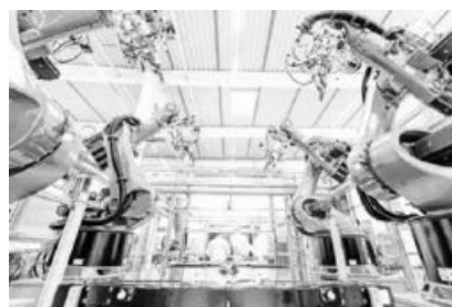
Innovative Technik am Standort Sachsenheim (Foto: DRÄXLMAIER Group).

Die Elektromobilität, eine der wichtigsten Zukunftstechnologien in der Automobilindustrie, hat DRÄXLMAIER früh als Megatrend erkannt und bereits 2009 mit der Entwicklung erster Prototypen für Batteriesysteme begonnen. Seitdem hat sich das Unternehmen auch im Bereich der E-Mobilität als zuverlässiger und innovativer Partner für Premiummarken der Automobilbranche etabliert – von der Entwicklung, über die Simulationstechnik, Prototypenfertigung und das hauseigene Testlabor bis hin zur Serienproduktion. DRÄXLMAIER wurde zuletzt zweimal vom Volkswagenkonzern mit dem VW Group Award geehrt – unter anderem für die Kooperation im Bereich der Elektromobilität.