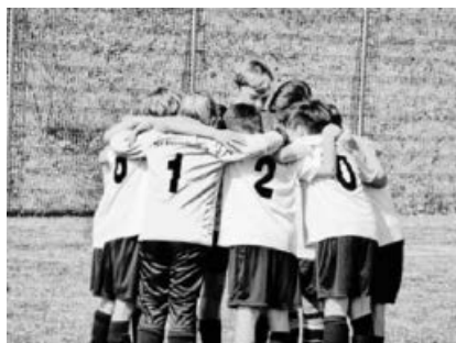
Der Zusammenhalt unserer Jugendteams ist uns sehr wichtig.

Dann bist du bei uns im TSV genau richtig. Was wir dir bieten: fach- und kindgerechtes Training; ein Team in dem sich jedes Kind entfalten und weiter entwickeln kann; in dem jedes einzelne Kind wichtig ist und mitwirken darf; Trainer und Jugendleiter, die ein offenes Ohr für jedes Kind und deren Eltern haben; Teamspirit und vieles mehr... Du möchtest dich selber davon überzeugen? Dann wollen wir dich und deine Familie am Samstag, 27.04. zu unserem SCHNUPPERTAG auf unserem Sportgelände an der Löchgauer Straße in Kleinsachsenheim einladen. Los geht es mit den Trainingseinheiten um 10 Uhr, anschließend wird für das leibliche Wohl gesorgt und zum Schluss wollen wir ein kleines Abschlussturnier machen. Das Veranstaltungsende ist für 14 Uhr geplant. Bitte Sportbekleidung nicht vergessen. Wir freuen uns auf dich!