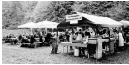
Das MVS-Waldfest am 01. Mai.

einsjahrs möchten wir wieder viele sonnenhungrige Besucherinnen und Besucher bei uns auf dem Waldfest willkommen heißen!