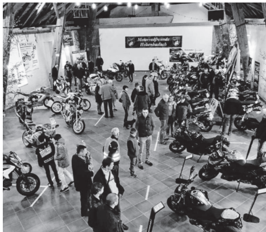
Blick von der Empore auf die Ausstellungsfläche.

Alle Motorradfahrer und -interessierten sind herzlich eingeladen.