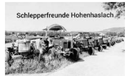
Schlepperparade Hohenhaslach am See.

Hallo Schlepperfreunde. Am Mittwoch den 1. Mai 2019 findet unsere erste Schlepperausfahrt statt. Start ist um 9.30 Uhr in Hohenhaslach Richtung Freudental unterer Weinbergweg bei Schieber. Unser Ziel: die Veteranenfreunde Ottmarsheim. Dort wollen wir an dem Schleppertreffen teilnehmen. Wer an der Ausfahrt teilnehmen möchte ist hiermit eingeladen. Die Vorstandschaft.