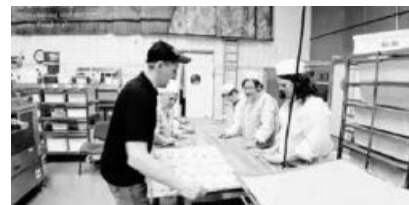
Hohenhaslach Landfrauen beim BeckaBeck - jetzt geht's los mit Brezeln schlingen.

Kürzlich machten sich fast 40 Frauen auf den Weg nach Reutlingen und anschließend zum BeckaBeck nach Römerstein. Der Stadtbummel in Reutlingen fand leider bei Regen statt. Weiter ging's dann nach Römerstein-Böhringen zum in der Region sehr bekannten BeckaBeck.