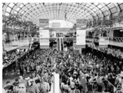
Internationaler Jugendtag der Neuapostolischen Kirche in der Messe Düsseldorf.

Am Himmelfahrts-Wochenende, von Donnerstag bis Sonntag, 30. Mai bis 2. Juni, fand der Internationale Jugendtag auf dem Messegelände Düsseldorf statt. Er stand unter dem Motto »Hier bin ich«.