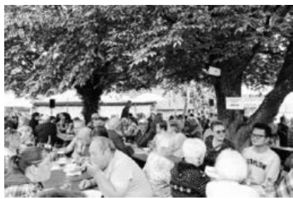
Gemütliches Dorffest beim Männerchor Ochsenbach.