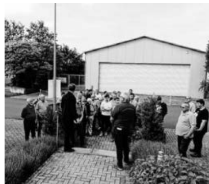
Begrüßung am Motorrad- und Technikmuseum Quirnheim.

Dieses zeigt neben einer großen Sammlung liebevoll restaurierter Motorräder aus sechs Jahrzehnten auch eine Anzahl an technischen Besonderheiten wie eine umfangreiche Präsentation der Wankelmotor – Technik. Eine funktionierende Transmission und vieles mehr. Im Aussenbereich gibt es eine konservierte Lanz Dampfmaschine von 1904 zu bestaunen sowie einen stationären Presslufthammer und eine Eismaschine.