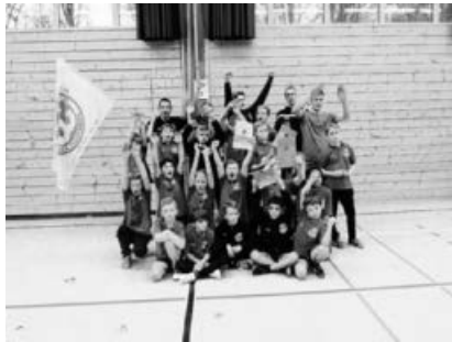
Mit Erfolg geschafft.