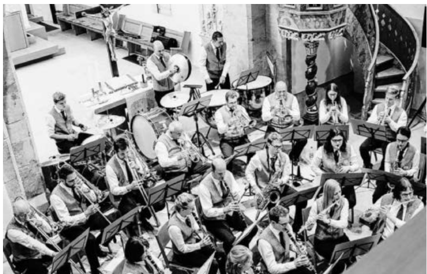
Rückblick auf das MVS-Kirchenkonzert.

Kinder unter 18 Jahren frei; eine Anmeldung ist nicht erforderlich