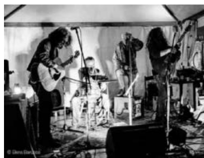
Ein ungewöhnliches Musikerkollektiv aus der Toskana gastiert am 31. Mai im Tender: die Jugband dalle Colline Metallifere.

Öffnungszeiten des Lädles: Donnerstag und Freitag 9:30 - 12.30 und 14.30 - 17.30 Uhr und bei Veranstaltungen im Tender.