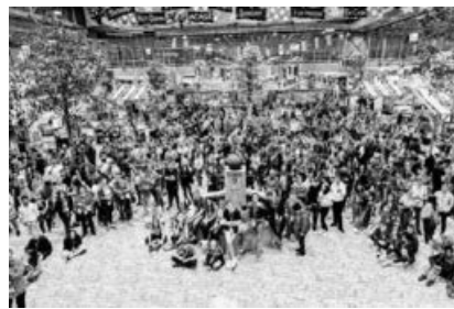
Stand der Gebietskirche Schweiz beim Internationalen Jugendtag der Neuapostolischen Kirche.

Gottesdienste, Andachten, Workshops, Bühnenstücke, Ausstellungen, Filme, Musik, Podiumsdiskussionen zu Glaubens- und Gesellschaftsfragen, theologische und wissenschaftliche Vorträge, Orte der Ruhe, Sport, Präsentationen und vieles mehr standen auf dem Programm.