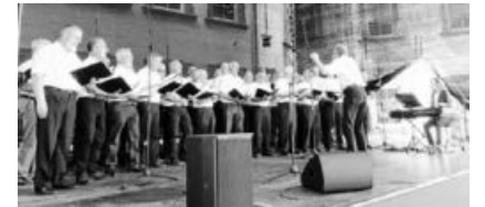
Der Männerchor LS bei seinem Auftritt in Heilbronn.....

Vorschau: Am Freitag, dem 14. Juni ist um 19.45 Uhr Chorprobe in Löchgau. Treffpunkt weiterhin 15 Minuten vorher. Wir proben für das Sommerfest im Kleeblattheim Kleinsachsenheim und weitere Auftritte.