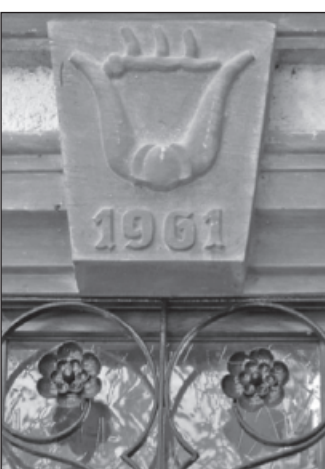
Steinwappen am Türsturz.