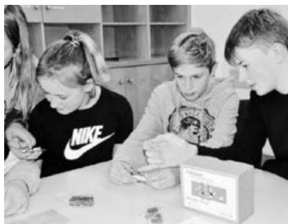
Schüler der Stufe 6.

Die Schüler*innen der Gemeinschaftsschule Sachsenheim haben fortan die Möglichkeit, intensive Einblicke in die Unternehmenswelt zu erlangen und bereits frühestmöglich Kontakte zu knüpfen. So werden die jetzigen Sechstklässler den ersten Projektabschnitt mit einer Exkursion zur Firma TRUMPF nach Ditzingen abschließen.