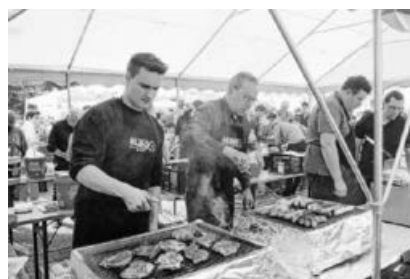
Grillzange statt Tischtennisschläger.

seiner vierten Auflage ein großer Erfolg. Bei bestem "Festleswetter" weilten nicht nur wandernde Väter am Himmelfahrtstag unter den zahlreichen Besuchern. Am Nachmittag gab es zeitweise nur Platz an den Stehtischen. Neben der Biermutter mit sechs angebotenen verschiedenen Bieren gab es leckere Speisen vom Grill und aus der Fritteuse sowie Kaffee und Kuchen. Die transportable Stockschützenbahn des 1. Stockschützenvereins Sachsenheim sorgte ebenso für Abwechslung wie die vom Nachwuchs gut nachgefragte Tischtennisplatte. Eine kleine Präsentation des Autohauses NISSAN Schmidt begleitete das Festgeschehen. Wir bedanken uns bei allen Gästen und hoffen auf ein Wiedersehen im kommenden Jahr.