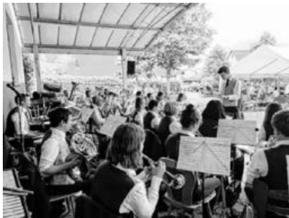
Zu Gast beim MV Ensingen.

Am Vatertag war der Musikverein Ochsenbach zu Gast beim Musikverein Ensingen. Im Unterschied zu den letzten Jahren bescherte die Wetterfee in diesem Jahr zum Glück herrliches Frühsommerwetter und so waren die Bänke vor dem Vereinsheim in Ensingen gut gefüllt. 2 Stunden lang unterhielt der MVO das Publikum mit der gewohnten Mischung aus traditioneller und moderner Blasmusik. Auch einige neue Stücke vom Frühlingskonzert wie das Amy Winehouse Medley und die 80er Jahre Kulttour brachten frischen Schwung ins musikalische Programm.