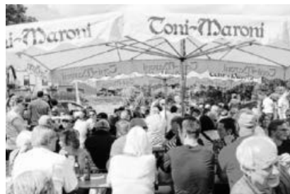
Zahlreiche Gäste auf dem TSV-Parkplatz.

23.06. TSV Kleinsachsenheim, ELBO-Cup 2019, das 22. TSV-Jugendfußballturnier, Sportgelände