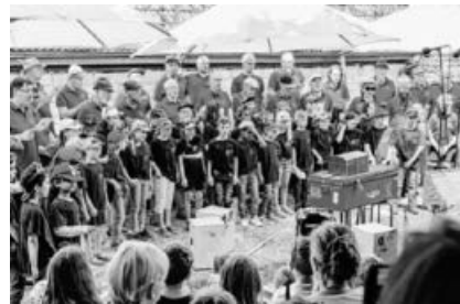
Kikeriki! Schulchor und Männerchor beim Auftritt.

Wir hatten so einen schönen Festtag und haben allen Grund DANKE zu sagen!