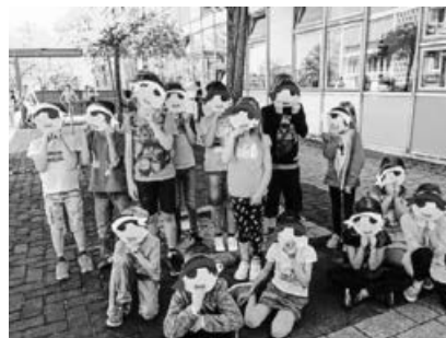
Nach einer Piratenveranstaltung in der Höfäckerschule, Sersheim.

VORLESEN IM PFLEGEHEIM: In unserem Terminkalender fest verankert sind zwei monatliche Verleseveranstaltungen. Die eine ist das Vorlesen für Kinder im Alter von 3 - 6 Jahren, jeweils am 1. Samstag im Monat. Neu hinzukommen ist nun das Vorlesen im Pflegeheim Sonnenfeld in Großsachsenheim.