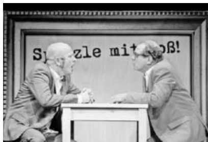
Spätzle mit Soß!

Sonntag, 30. Juni 2019, 19.00 Uhr Schülke's Hof, Ochsenbach (Bromberghöfe, Freiluftveranstaltung) VVK 16 €/AK 19 € (VVK bei Schreibwaren Bader, Bürgerservice Sachsenheim, Hofladen Schülke und online unter www.sachsenheim.de ) VVK ab 23.05.2019