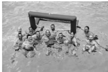
Spaß beim Wasserball.

Das wöchentliche Sportprogramm für unsere Mitglieder hat begonnen. Der Trägerverein lädt ein zur Aqua-Fitness : immer wieder dienstags um 09:15 Uhr und freitags um 19:00 Uhr (die Teilnahme am Aqua-Fitness am Dienstag ist auch für Nicht-Mitglieder möglich). Jeden Sonntag wird um 19:00 Uhr die Zeit mit Yoga unter freiem Himmel entschleunigt. Zum geselligen Wasserball kann Frau und Mann jeden Dienstag um 20:00 Uhr kommen. Eine Anmeldung zu diesen Veranstaltungen ist nicht erforderlich, bei Interesse kann jedes Mitglied einfach vorbeischaun und mitmachen.