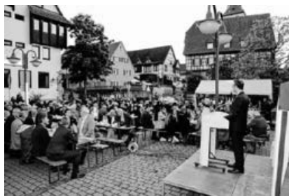
Gemeinsam auf dem Kirchplatz anlässlich des Fastenbrechens.

ren für diese Veranstaltung, die die Nachbarschaft stärkt und die Sachsenheimer verbindet und hob seine Hoffnung hervor, dass dieses Treffen sich bestimmt nächstes Jahr im Fastenmonat Ramadan wiederholt.