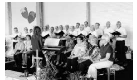
...und zusammen mit dem Kirchenchor in Kleinsachsenheim.